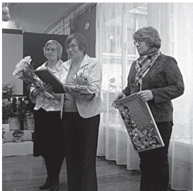
Ļaudonas vidusskolas kolektīvs.

Mūsu tuvākie kaimiņi, Ļaudonas vidusskolas plašā saime , kā arī apvienotās virtuves kolektīvs.