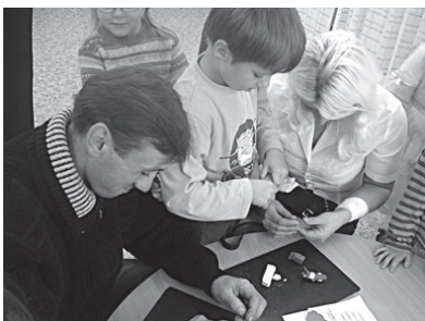
Darbojas vecāki kopā ar bērniem.

... pirmdien uz PII aicinājām bērniem vistuvākos cilvēkus – vecākus, vecvecākus, krustvecākus, lai vērotu bērnu ikdienas darbošanās dažādus veidus un tajos arī piedalītos paši.