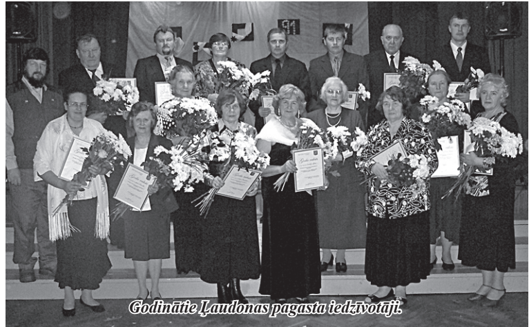
Godinātie Ļaudonas pagasta iedzīvotāji.

Varbūt tāpēc, ka esam maza tauta, mums piemīt kopības sajūta. Katrs esam jutuši līdzīgu Latvijas vārda nesējiem pasaulē, vai tie būtu sportisti, mūziķi, mākslinieki vai laba darba darītāji. Arī mūsu pagasta sportisti Latvijas vārdu nes plašajā pasaulē.