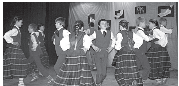
Koncertu sniedza pagasta pašdarbības kolektīvi un vidusskolas skolēni.