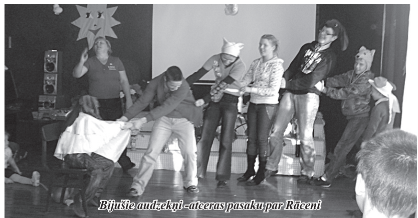
Bijusī audzēkņi – atēras pasaku par Rāceni