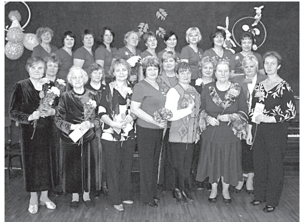
Esošie un bijušie bērnudārza darbinieki.

Ļaudonas PII skaistajā jubilejā sveica Madonas novada domes vadītājs