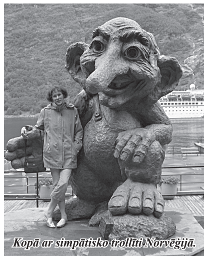
Kopā ar simpātisko trollīti Norvēģijā.