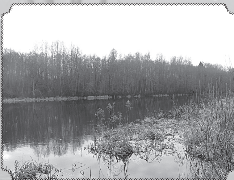
Aiviekste pie Ķikuriem.

29. novembrī iedegsim pirmo Adventes sveci ceļā uz Ziemassvētkiem.