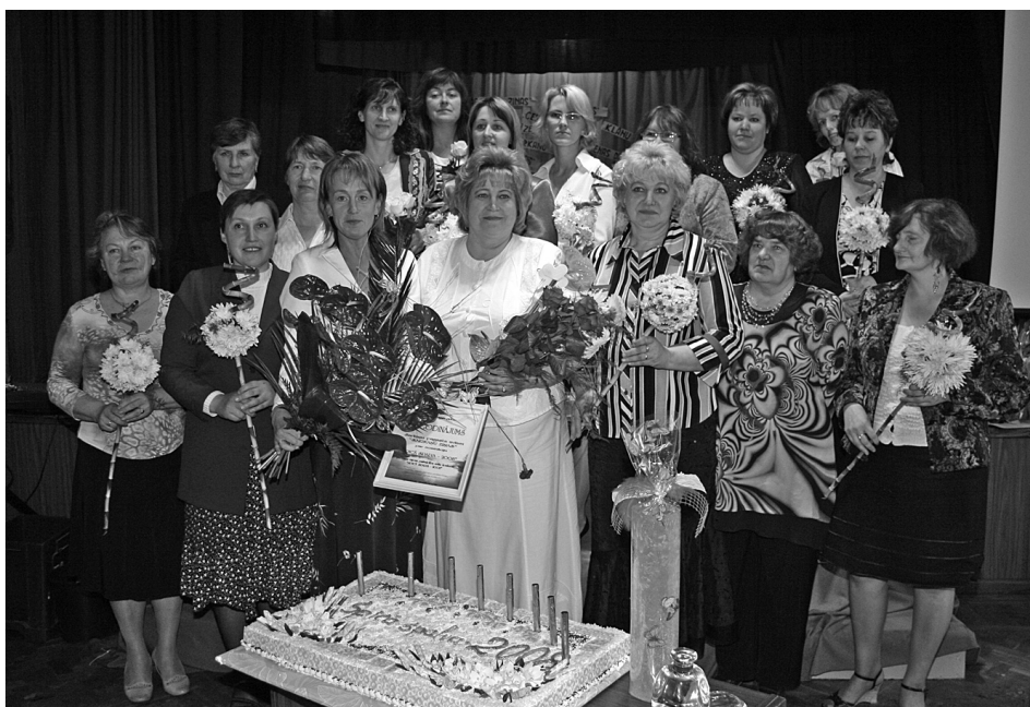
Konkurss „Spicā spalva” notika jau astoto reizi, bet kopīga konkursa dalībnieku – pašvaldību izdevumu redaktoru – „ģimenes bilde” tapa pirmo reizi.