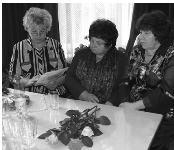
„Aronas Pagasta Vēstis”.