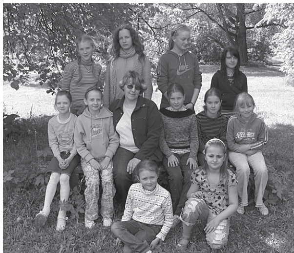
Mazie floristi kopā ar vadītāju.