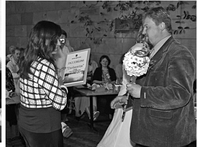
Nomināciju saņem „Dzelzavietis”.