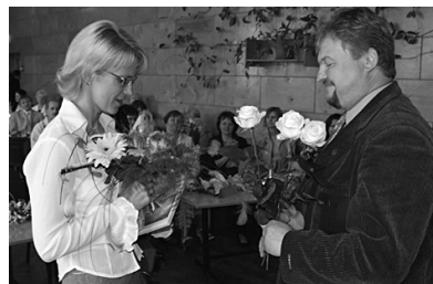
Nominācijas saņem „Barkavas Vārds”.

Vēl tikai kopīgs redaktoru foto pie li- lās svētku tortes, un svinīgā svētku daļa izskanējusi.