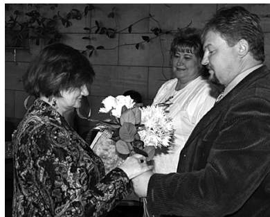
Nominācijas saņem „Bērzaunes Rīts”.