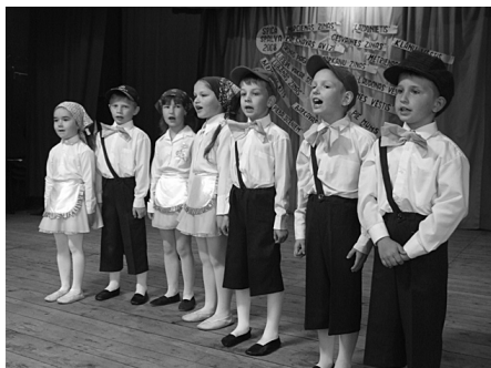
Ciemiņus sveica mazie PII dziedātāji...