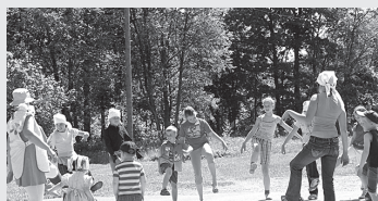
Kultūras dzīve pagastā