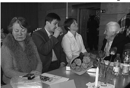
„Varakļonīts” un Vestienas „Pie Mums”.