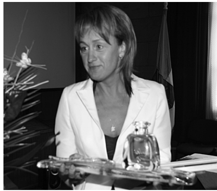
Galveno nomināciju „Spicā spalva 2008” saņem „Sarkaņu Ziņas”.