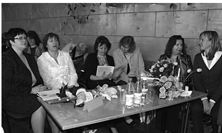
Izdevēji un viesi.