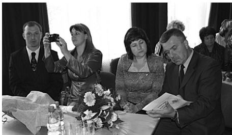
„Rankas Vēstis” komanda.