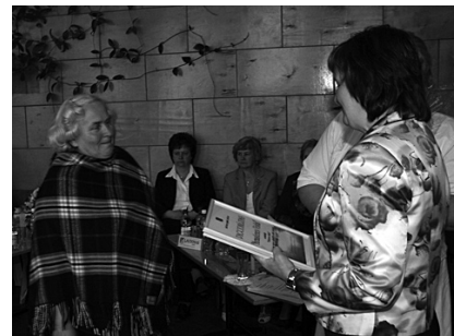
Nominācijas saņem „Murmastienes Vēstis”.