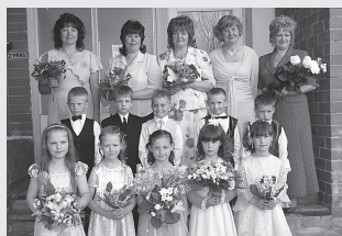
No ikdienas pagasta izglītības iestādēs