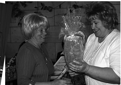
Nominācijas saņem „Mārcienas Ziņas”.