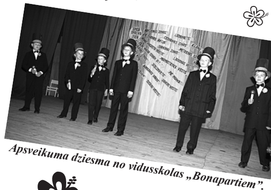
Apsveikuma dziesma no vidusskolas „Bonapartiem”.