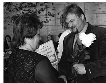
Nominācijas saņem „Mētrienas Dzīve”.