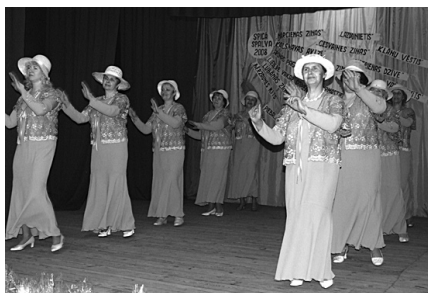
Dāmu deju grupa „Mežrozīte”.