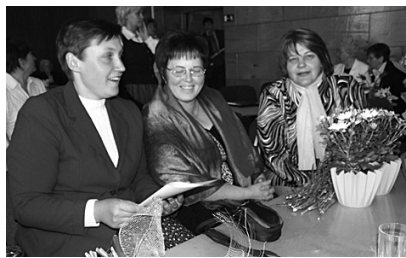
„Kalsnavas Avīzes” redkolēģija.