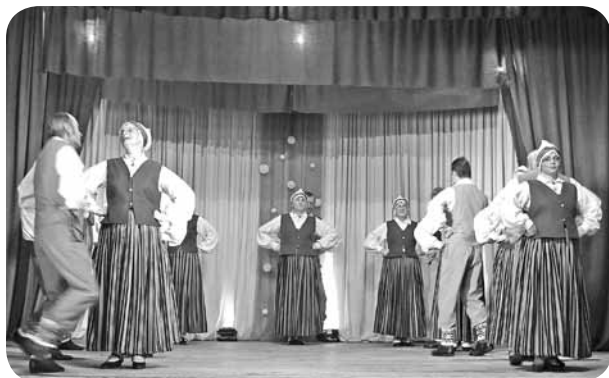
Senioru deju kolektīvs "Divi krasti".

Runājot par tikumu, zinām, ka latvietim darba tikums nav svešs. Tas dzīvo sirdīs un prātos, taču izpaužas darbos. Lai arī ikdienas dzīvē nereti latvietis latvieti nesaprot, nosoda un pat apkaro, mēs tomēr zinām, ka mūsu no sirds ieguldītais darbs ir mūsu kopīgais nezūdamais īpašums, kas mūs paglābs no bojāejas, ja mēs to sargāsim tūrās un stiprās rokās.