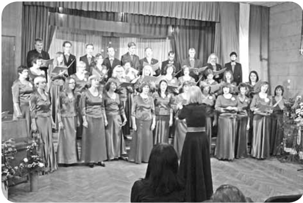
Uzstājas jauktais koris "Lai top!".

17. novembrī Ļaudonas kultūras nams bija tērpies svētku rotā, lai suminātu Latviju 97. gadadienā.