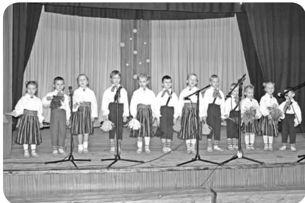
Mazie PII "Brīnumdārzs" dziedātāji.

Katra cilvēka dzīvē dzimšanas svētki ir kas īpašs... gadu no gada. Savus svētkus mēdzam svinēt dažādi. Ar prieku. Ar savīļņojumu. Ar sentimentālu sajūtu, atskatoties pagātnē... Taču, atzīmējot valsts dzimšanas svētkus, visas šīs sajūtas satiekas, jo atskatāmies gan uz pagātņi, kas pilna ar notikumiem, kas atstāj iespaidu uz nākotņi, gan raugoties nākotnē, kas sevī var nest bažas, raizes, prieku un līksmi.