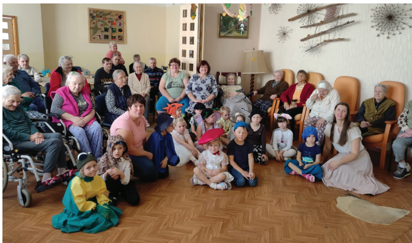
Ciemos Ļaudonas SAC ar izrādi 13. oktobrī.

ju dienai veltītajiem apsveikumiem un ziediem! Paldies pagasta pārvaldei par krāšņo apsveikumu, mēs sajūtāties novērtētas un īpašas. Paldies par to!