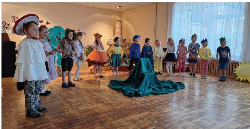
Jubilāriem izrāde „Zem sēnītes” 29.09. „Kaķu” grupas izpildījumā.