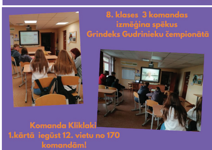
Komanda Kliklaki 1.kārtā iegūst 12. vietu no 170 komandām!