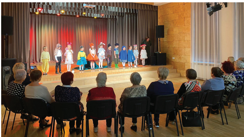
Kuplais pasākuma pulks.