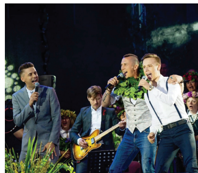
„Nebaidīšos teikt, ka atrasties uz lielās skatuves ir „kaifs”. Tā ir vislabākā atkarība, kas vien var būt.” Koncerts „Ligojam Bauskā” 2019. g.

Jā, sports ir mans lielākais hobijs! Nesen uzstādīju sev par mērķi noskriet šo 5 km distanci, to izdarīju pavasarī „Rimi Rīgas maratonā”.