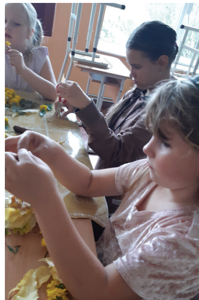
Darbs ar dabas materiāliem.

Ar septembra mēnesi atsākušās mazpulcēnu nodarbības. Šogad par mazpulka vecāko izvirzījām Evelīnu.