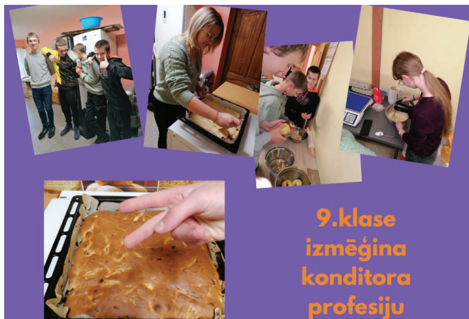
9.klase izmēģina konditora profesiju