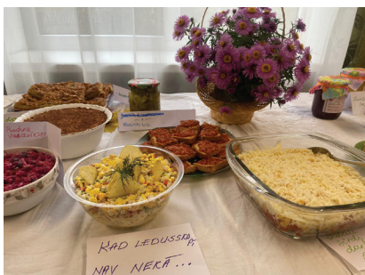
Rudens gardumi – „Saulīte smaida”, „Kad ledusskapī nekā nav”, „Rudens varavīksne” un citi.