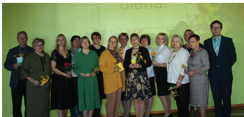
A. Eglīša Ļaudonas pamatskolas skolotāju kolektīvs.