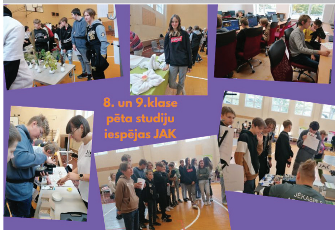
8. un 9.klase pēta studiju iespējas JAK