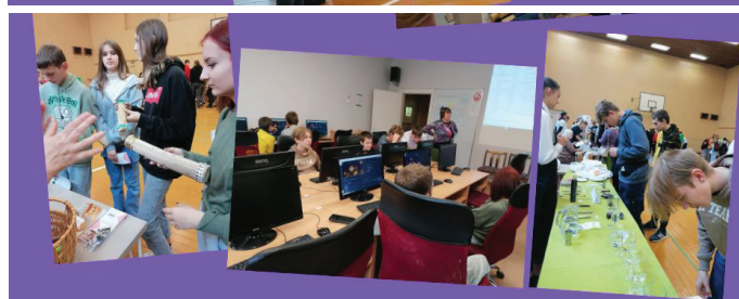
8. klases 3 komandas izmēģina spēkus Grindeks Gudrinieku čempionātā