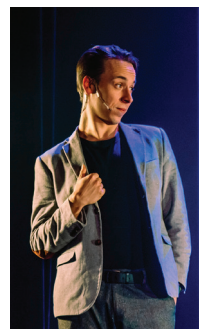
„Mīlestība uz mūziku man tika ielikta jau bērna šūpulī.”