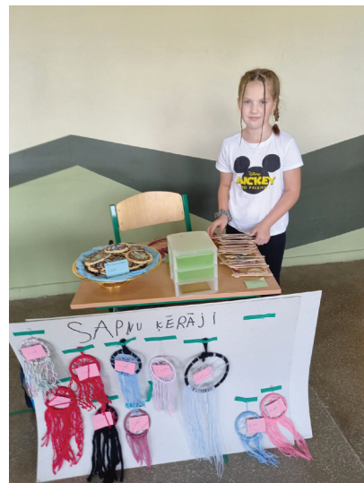
Miķeļdienas tirgus pūlis pamatskolā.