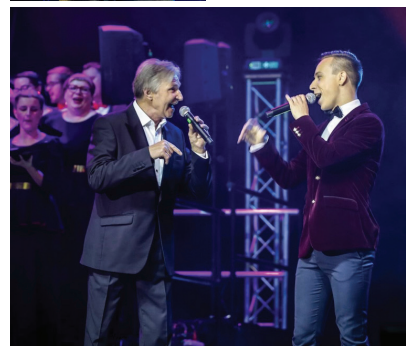
„Es vēl līdz šim brīdim nevaru aptvert, ka esmu bijis uz vienas skatuves ar Zigmaru Liepiņu, Jāni Lūsēnu vai kādu citu leģendāru mākslinieku.”