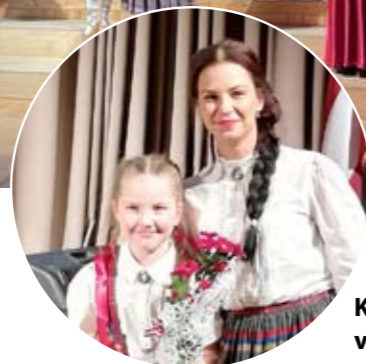
Svētku koncerta dalībnieki.