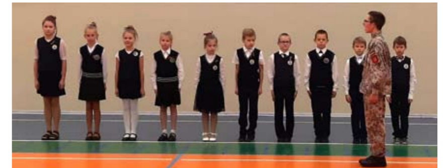
Pamatskolas 3. klase.

17. novembrī svinējām svētkus iesaistoties svētku koncertā „Daudz laimes, Latvijai!”.