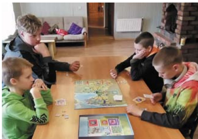
Galda spēles „Šurpu turpu” laikā.

Aizvadot Valsts svētkus, sākas Ziemassvētku gaidīšanas laiks. Protams, neatņemama sastāvdaļa ir Adventes vainags, tāpēc lai arī pie mums jauniešu centrā sāktu virgot svētku sajūtas, 24. novembrī kopīgi ar jauniešiem veidojām mūsu BJIC „Acs” Adventes vainagu.