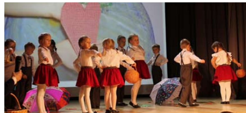
Kaķu grupas bērni.