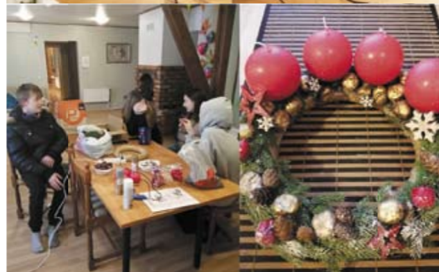
Adventes vainaga izveides laikā.