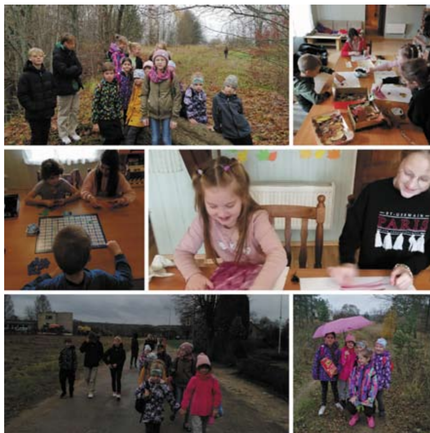
Rudens brīvlaika aktivitātes.

Sagaidot Latvijas Republikas proklamēšanas gadadienu, jaukā četru puīšu kompānijā apceļojām un iepazīnām interesantas vietas Latvijā, spēlējot galda spēli „Šurpu Turpu”. Aizraujošās 2h pabijām visos četros Latvijas novados. Piestājām Daugavas lokos, Lielajā Ķemeru tīrelī, Siguldā un citās vietās. Vislabāk spēlēt veicās un pie saldās pārsteiguma balvas tika Uno.