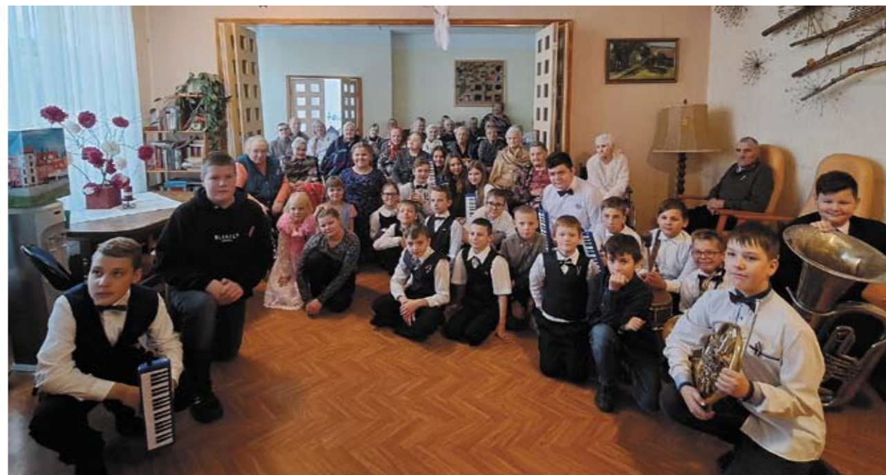
Ļaudonas pansionāta saime kopā ar viesiem.

Pansionātā, valsts svētkus gaidot, kopīgi taisījām dekorācijas latviskās noskaņās, arī skatījāmies latviešu filmas.