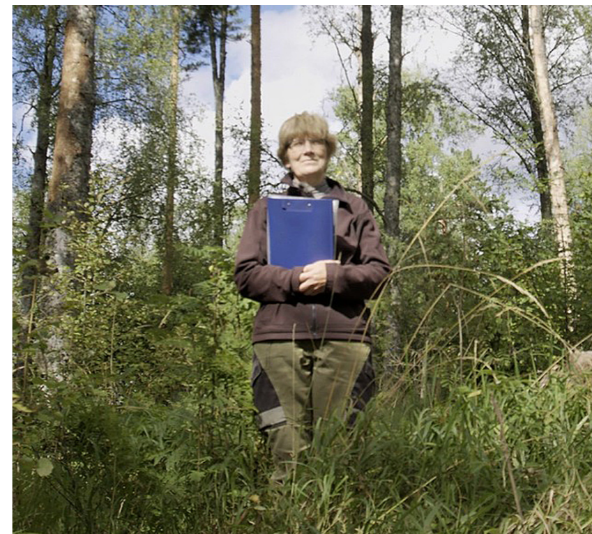
Mirkļis no raidījuma „Meža stāsti”.

gi, ka dzīvojam tik ainaviskā dabas ielokā. Iesim dabā! Baudīsim skatus, ko mums sniedz apkārtnē. Tepat, pie mums Ļaudonā.