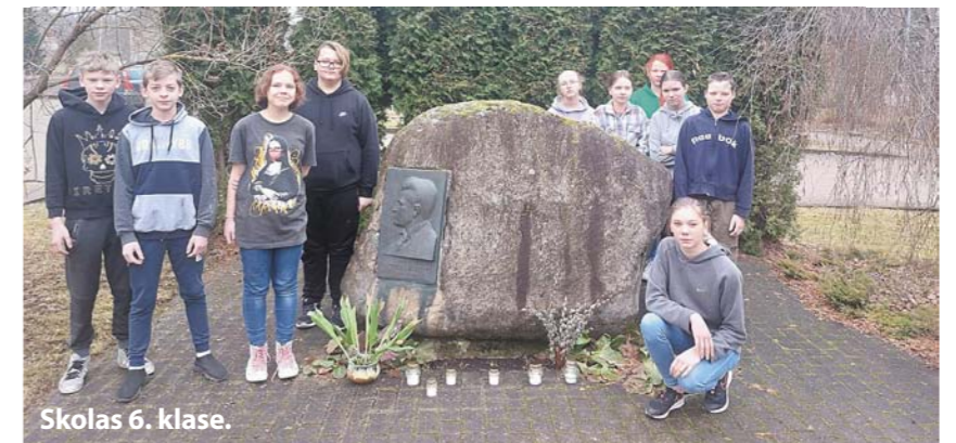
Skolas 6. klase.