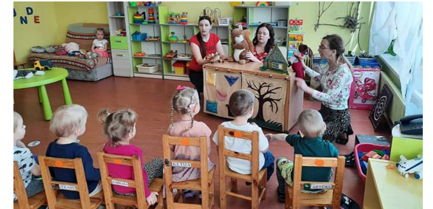
Teātris par draudzēšanos „Zaķu” grupā.