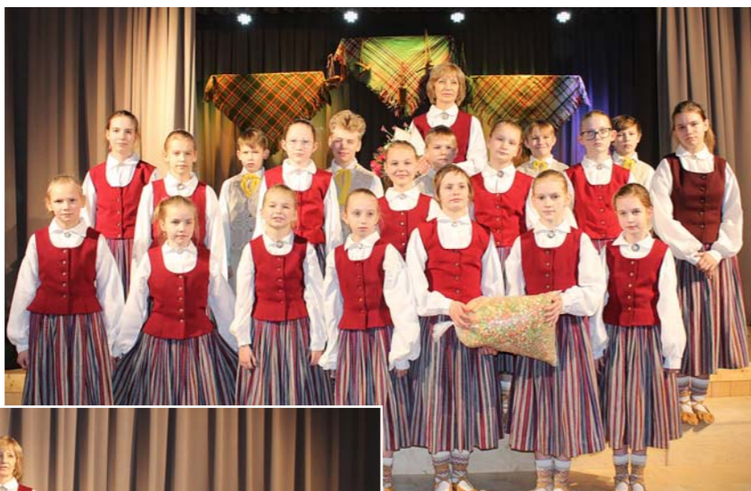
A. Eglīša Ļaudonas pamatskolas 3. – 6. klases deju kolektīvs.