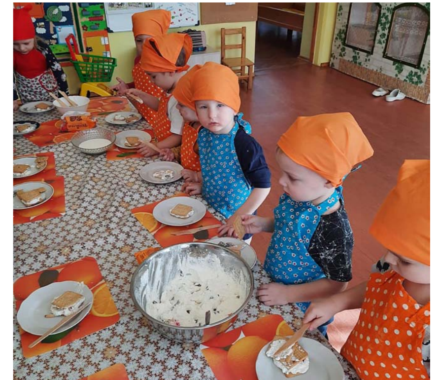
Draugu torte top „Zaķu” grupā.