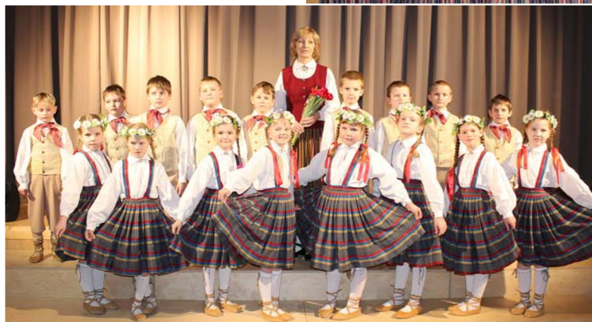
A. Eglīša Ļaudonas pamatskolas 1. – 2. klases deju kolektīvs.