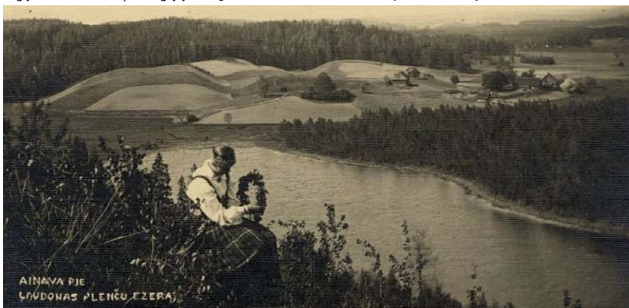
Raugoties no Plenču ezera augstienes, dūmakaina pavaras Malienas ainava.

Krāšņi te rotājas Ļaudona Aiviekstes ielejā, gleznainais dievnams un ēnainie dzirnavu dambji. Gājējus priecina ainavām bagātais Lazdonas lielceļš, Kalnvirsas auglīgie tīrumi, krāšņā Maija birzs Plenču ezera augstienē. Nav daudz tādu vietu Latvijā, kur meži un ezeri vēl atspoguļotu tik pirmatnīgu skaistumu, kur staigātu tik vienreizīgi cilvēki, vienalga, vai tas spēka un trakulības pārpilnais Jaunzemju ciems, vai miera pilnā Meirānu puse. Liels, varenu vētru svaidīts, ceļas Malienas gars – ar viņa elpu dzird runājam sentēvus un jaunus šūpuļus. Zobenu atvēzdam, no Visagala ciņās aizgājīs pulkvedis Kalpaks. Toces muižā audzis A. Līventāls – viens no pirmajiem latviešu rakstniekiem. Skaļāk un klusāk savus rakstus tautā ienesuši Aiviekstes bajārs J. Medenis, mūžīgu cīņu pilnais V. Eglītis, izsmalcinātais Anšlavs Eglītis, Malienas mistikas apdvestais J. Ezeriņš, Andrejs Eglītis, kaislīgais mednieks, romānists J. Sārts un citas jaunākas atvases.