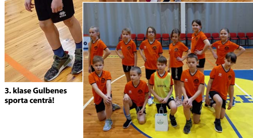
3. klase Gulbenes sporta centrā!