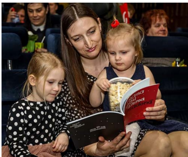
No grāmatas atklāšanas svētkiem „Mana sapņu ziema Madonā”.