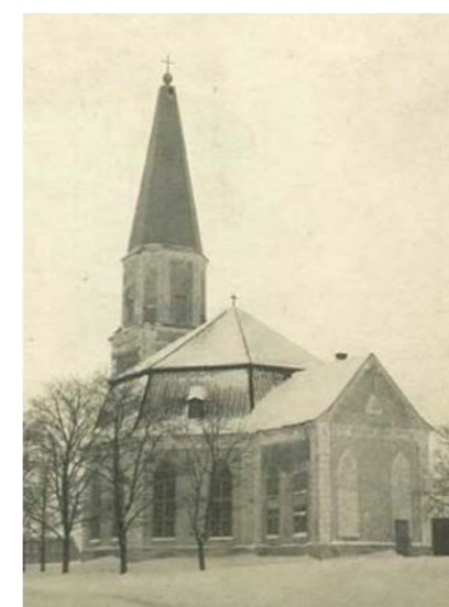
Gleznainais Ļaudonas dievnams Malienas krustceļos. Baznīca Otrā pasaules kara laikā 1944. gada vasarā nodega.