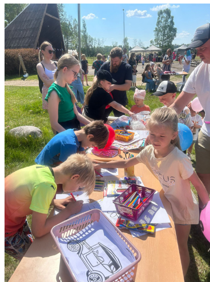
BJIC „ACS” aktivitātes.