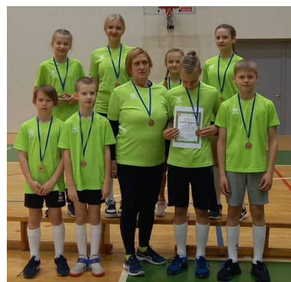
Drošie un veiklie!

12. aprīlī 3. klašu grupā sacentās 75 skolas no 25 Latvijas novadiem un valsts pilsētām. Jēkabpils novada vidusskolas apakšgrupā „Sporto visa klase!” kopā ar komandām no Jēkabpils 3. vidusskolas, Ludzas pilsētas vidusskolas, Salas vidusskolas, Ilmāra Gaiša Kokneses vidusskolas, Ludzas 2. vidusskolas sacensībās piedalījās 13 Andreja Eglīša Ļaudo-