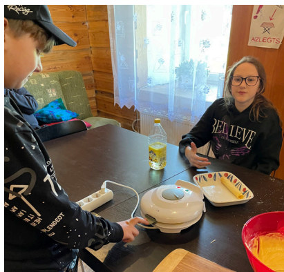
2. maijā kopā ar bērniem cepām klasiskās vafeles ar putukrējumu un kakao iebiezinātā piena pildījumu. Pēc tam spēlējām UNO.

Šīs divas dienas, mēs radoši darbojāmies – no krāsainā papīra tapa puķu pušķi. Bērni varēja izvēlēties, kādās krāsās veidot puķes. No papīra glāzēm savukārt tika veidotas vāzes, kuras tika izrotātas.