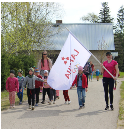
Apkārt Olimpiskajam centram – „Brīnumdārzam”.

Pavasaris ir rosības mēnesis gan dabā, gan darbos, gan arī sportā. Sporta dzīvē PII „Brīnumdārzs” iezīmējies ar diviem lielākiem pasākumiem.