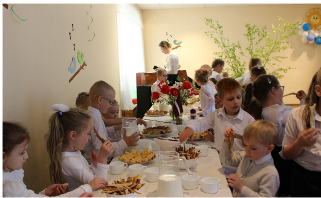
PII „Brīnumdārzs” skolēni.