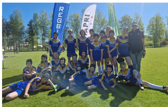
RK Ļaudona 12. maijā Baldones stadionā.