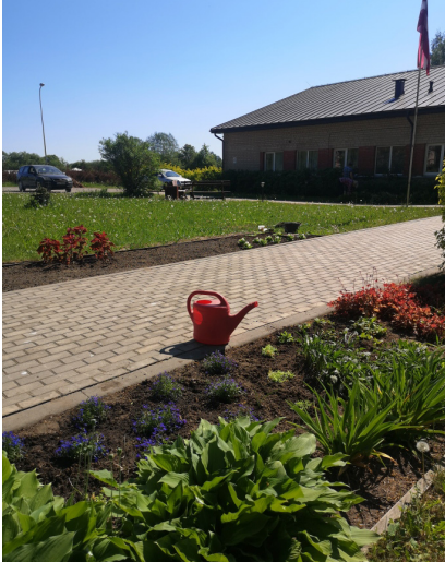
Pie Ļaudonas kultūras nama.

jumos un estrādes parkā, gan pie kultūras nama.