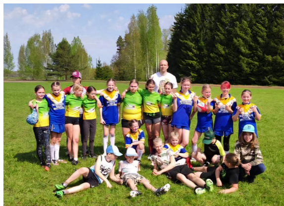
Ļaudonas meitenes draudzības spēlē ar Rīgas Katoļu ģimnāzijas komandu, 1. maijā Ļaudonā.