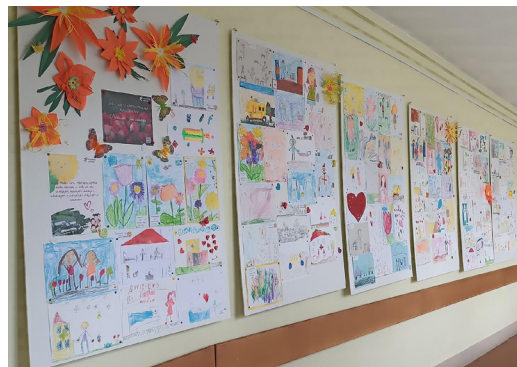
Zīmējumu izstāde Madonas slimnīcā – „Sveiciens medicīnas darbiniekiem!”