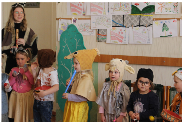
„Rūķu” grupa spēlē kaķu orķestri! Teātris „Kucēna piedzīvojumi lauku sētā”.

Es vēlos dāvināt jums skaistu dienu, ar saules gaismu, Putnu dziesmām piepildītu. Ar ceriņziedu saldo, brīnumjauko dvašu, Ar pieneņplāvu, dzeltenu un plašu, Kur bites dziedot saldu medu vāc, Bet iedzelt var, Ja basām kājām nāc... Jums dāvinu šo Gaišo saules dienu, Lai sirds jums priecīga, Lai pasmaidītu.