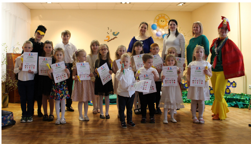
Konkursa 1. kārtas dalībnieki un žūrija Ļaudonas PII „Brīnumdārzs”.