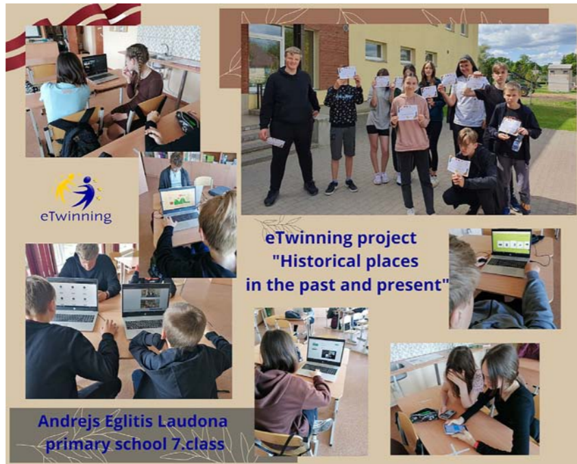
eTwinning project "Historical places in the past and present"