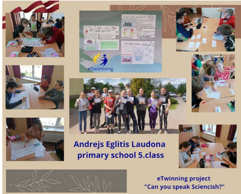
Andrejs Eglītis Ļaudona primary school 5.class

eTwinning project "Can you speak Sciencish?"