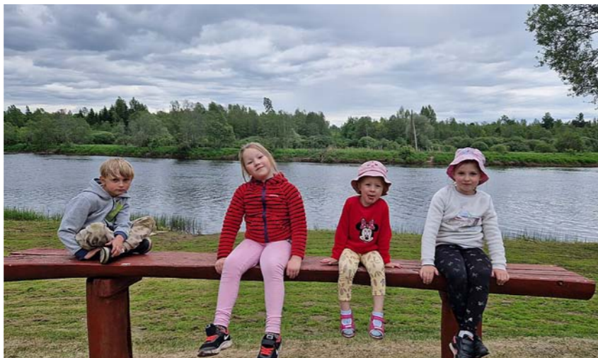
Aiviekstes krastmalā, atpūtas vietā „Jasmīni”.