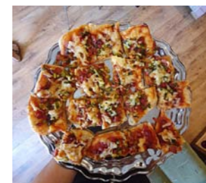
Paēdis bērns būs laimīgs bērns! Uzkodām – pica!