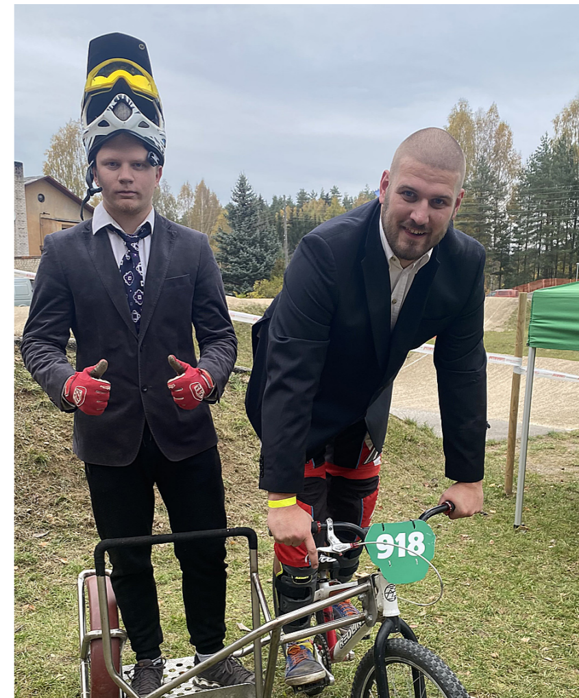
2021. gada blakusvāgu sezonas noslēguma sacensības Smiltēnē.