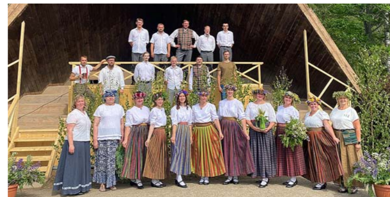
Vestienes amatiereteātris „Aušas”, kas viesojās Ļaudonā ar izrādi „Līgošanas nerātības” un VDPK „Grieze”.