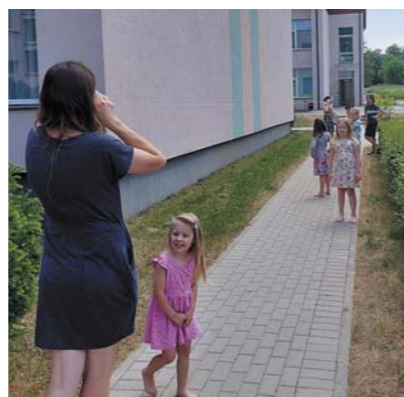
„Paroles” nodošana klusajā telefonā.

uz notikušo eksperimentu pēcpusdienu, varu teikt, ka izdevās viss, kas bija plānots. (Varbūt vienīgi atspirdzinošais dzēriens bija pārāk skābs...) Eksperimentu pēcpusdienu sākām ar kluso telefonu. Katram no dalībniekiem bija jāsadzird parole, lai dotos tālāk. Pēc tam izmēģinājām piepūst balonu, izmantojot sodu un etiķi, noskaidrojām, vai ir iespējams balonu caurdurt, to neuzspridzinot, veicām dažādu vielu sajaukšanu un vērojām, kā tās savā starpā reaģē, pamēģinājām dabūt olu pudelē, to nespiežot u.tml.