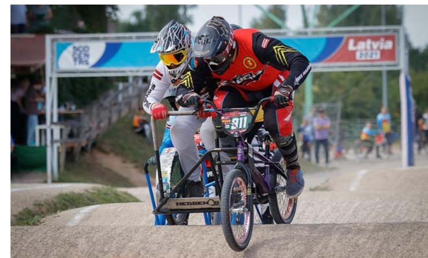
Ar brāli Kristeru Austrumpuses blakusvāgu čempionātā.