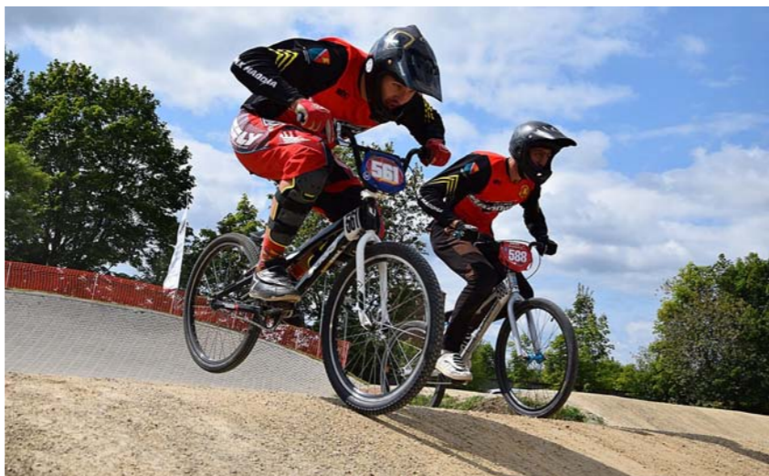
Aktīvajos sportista gados sacensībās Preiļos.

Interese par trenēšanu un savu zināšanu nodošanu citiem parādījās jau tad, kad vēl pats aktīvi trenējos un piedalījās sacensībās. Agrāk skatoties, kā Tētis vada Madonas BMX klubā treniņus, ļoti ieinteresēja trenera darbs. Būt trenerim ir liela atbildība, jo jaunos sportistus var veidot kā figūras no plastilīna. Kādas zināšanas un padomus tu būsi ielicis viņā, tik spējīgs un varošs