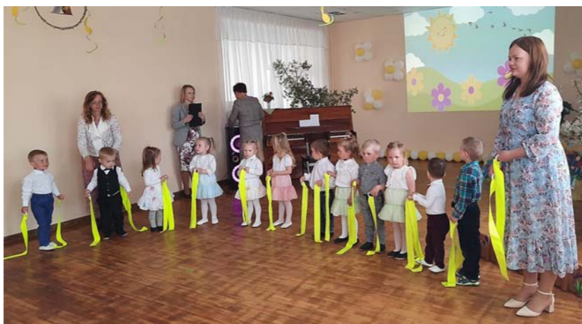
„Zaķu” grupas audzēkņi ar skolotājām Māmiņdienas koncertā.

28. aprīlī notika noslēguma pasākums projektam „Skola katram bērnam”, kas norisinājās Rīgā, augstskolā Turība. Projekta ietvaros bija iespēja vairāk uzzināt par iekļaujošo izglītību, projekts sniedza iespēju iepazīt bērnu stiprās puses, arī pamānīt talantīgos bērnus un strādāt ar