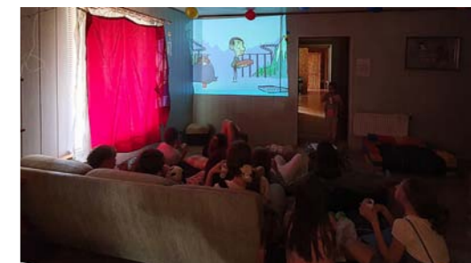
Skatoties Misteru Binu!