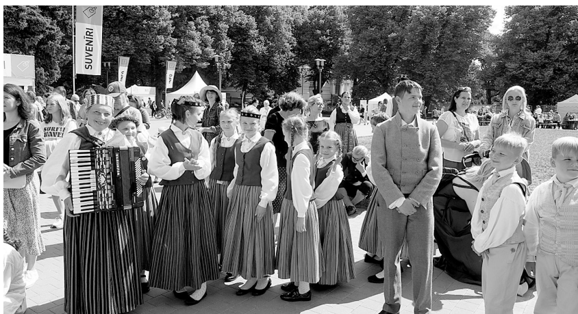
Folkloras kopa „Driksnēni”.

Svētku nedēļa bija piepildīta ar daudz un dažādām norisēm – izstādes, tirdziņi, dažādi koncerti un, protams, galvenie notikumi – deju lieluzvedums “Mūžīgais dzinējs” un