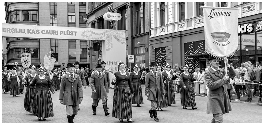
Senioru paaudzes deju kolektīvs „Divi krasti”.

dalībnieku vidū arī Tautas lietišķās mākslas studijas no Cēsaines, Ērgļiem un Sarkaņiem. Trīs folkloras kopas un divi koklētāju ansambļi, kā arī lauku kapela un vokālais ansamb-