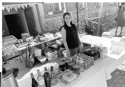
Pop-up kafejnīca līdzās kultūras namam.