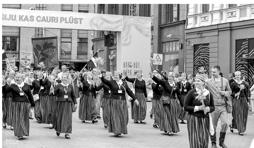
Jauktais koris „Lai top!”.

noslēguma koncerts Mežaparka lielajā estrādē “Kopā augšup”.