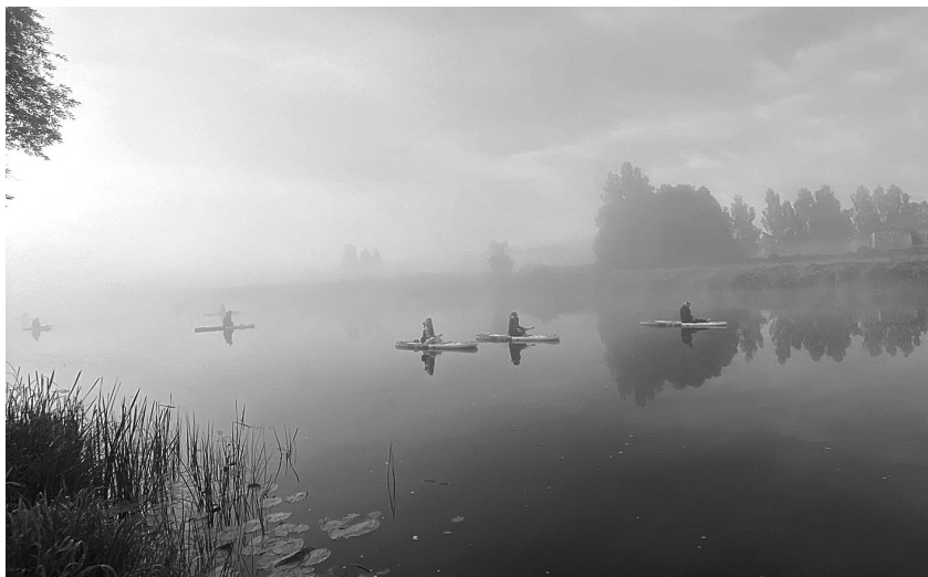
Ar SUP dēļiem pa Aivieksti miglas tiklos.

Arī virves vilkšanas sacensības nu jau pieskaitāmas pie stabilas pagasta svētku tradīcijas – kad uz tilta satiekas labā un kreisā krasta iedzīvotāji, lai mērotos spēkos un atraktivitātē par spēcīgākā un veiksmīgākā krasta iedzīvotāju titulu! Četros raundos – bērni, dāmas, kungi un jauktā komanda - tika noteikts, ka ar rezultātu 3:1 šajās sacensībās uzvarēja labā krasta iedzīvotāji! Malāči! Paldies visiem atnākušajiem par drosmi un cīņas spar!