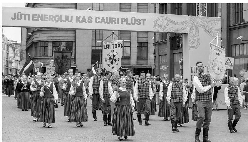
Vidējās paaudzes deju kolektīvs „Grieze”.