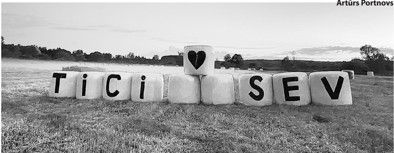
Rodi spēku un ticību mazajā paradīzes stūrītī – Ļaudonā!