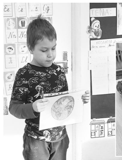
Mūsu pašu – Zeme!

Vai esat kādreiz domājuši par to, kā izskatās visums un planētas visumā? Šā gada janvārī „Kaķu” grupas audzēkņi iedziļinājās tēmā „Kosmosa plašumos”. Bērni uzzināja, ka