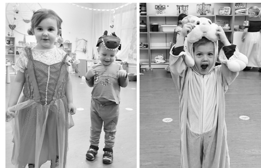
Princese un krokodils.

Bet „Rūķu” grupas februāra mēneša tēma – „Profesiju pasaulē!”. Šī mēneša laikā bērni iepazīna apkārt esošās profesijas un to darbiņus. 15. februārī grupa devās uz Valsts ugunsdzēsības un glābšanas dienestu Madonā. Bērniem tika dota iespēja uzlikt sev ugunsdzēsēja ķiveri, aplūkot transportu un uzdot