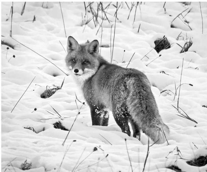
„Ziemā auksti tiem, kam nav siltu atmiņu.”

nas bibliotēkā, sīkumos neieslīgšu – par to plašāk I. Kārklīnas sagatavotajā bibliotēkas rubrikā.