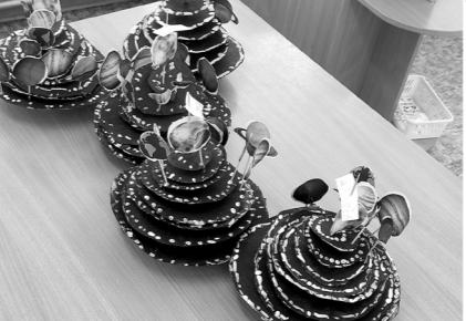
Saules sistēma no cita skatupunkta.