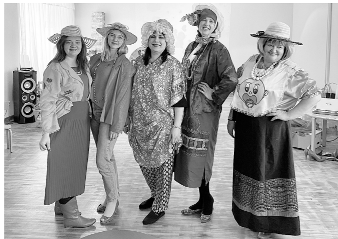
Skolotājas vienmēr modīgas!

bai, rotaļa „Celiši”, kura guva īpašu atsaucību. Tāpat bērni varēja ierasties draudzību un analizēt, kas no redzētā bija labi un kas nē. Ļoti jauka aktivitāte bija „Sagērbim moderni savu skolotāju”, kur bērni izvēlējās dažādus apģērbus un aksesuārus savu skolotāju sapošanai, rezultāts bija brīnumains un iezīmējās jau jaunie dizaineri.