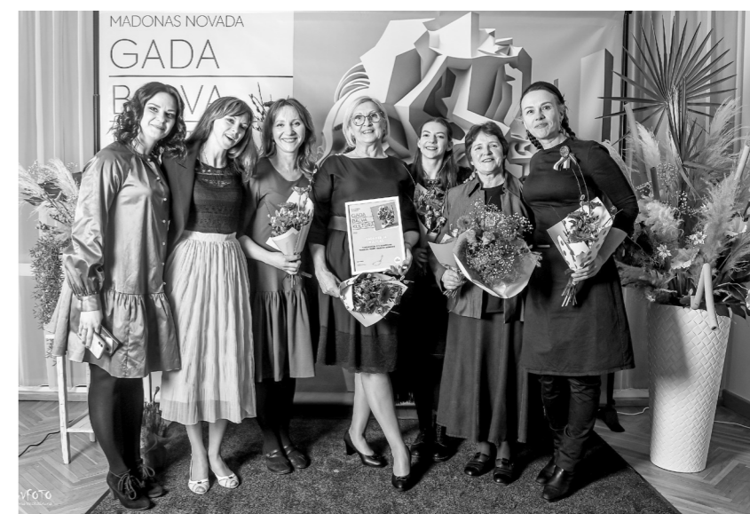
Sirsniņi sveiceni nominantiem ar godam pelnītajiem apbalvojumiem. Patiesi jācer, ka šis pasākums kļūs par stabilu Madonas novada vērtību.

Āra dziedāšanas festivāls ir latviešu kultūras saknes un identitāte – tā mūsdienu latvieti šķietami aizved atpakaļ pagātnē, ļaujot izjust dabas varību un cilvēka balss spēku un varu