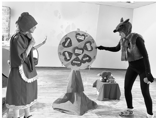
Sarkangalvīte un Vilks.