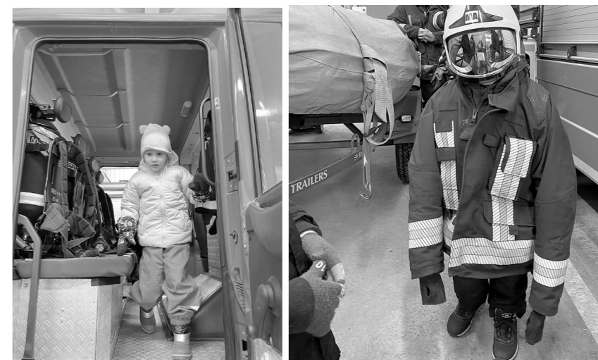
Ugunsdzēsēju auto iepazīstot. Mazais ugunsdzēsējs.

sev interesējošus jautājumus par ugunsdzēsēja profesiju. Dodoties mājās, visa grupas bērni vēlējās kļūt par ugunsdzēsējiem! Mūsu glābējiem no sirds novēlam stipru veselību un izturību!