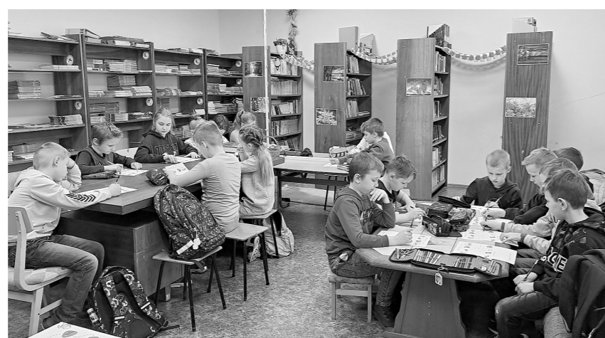
Bibliotekārās stundas laikā.

Kopīgi klausījāmies pasaku „Mājas pele un lauku pele”, kam sekoja dažādu uzdevumu izpilde. Kā pirmais uzdevums bija sasaistīts ar pasakas uzmanīgu klausīšanos – jāuztver konkrēti vārdi pasakā, kas uzdevumu lapā arī bija jāatzīmē. Kā otrais – jautājumu un atbilžu uzdevums, skolēni paši saviem spēkiem mēģināja atbildēt uz jautājumiem, bet pēc tam to