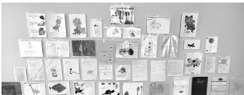
Miklas un to atminējumi bērnudārza telpās.

Pasākuma laikā bija jāveic dažādi Sarkangalvītes sagatavotie uzdevumi – „Karsā sirds” draugu samīļošanai, „Es ar savu cisu maisu” veikli-