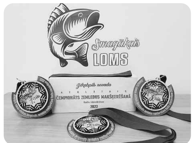
Medaļas un titulbalva.