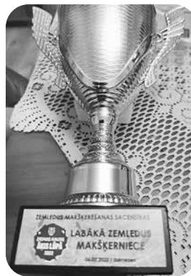
Saņemtā kausa nominācijā „Labākā zemledus makšķerniece”.