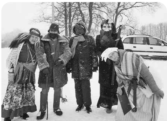
Vai vari atpazīt ļaudoniešus?