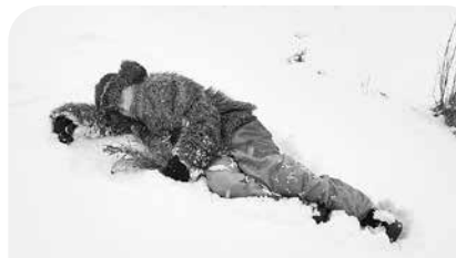
Ziemas miegā gulošais "lācītis".