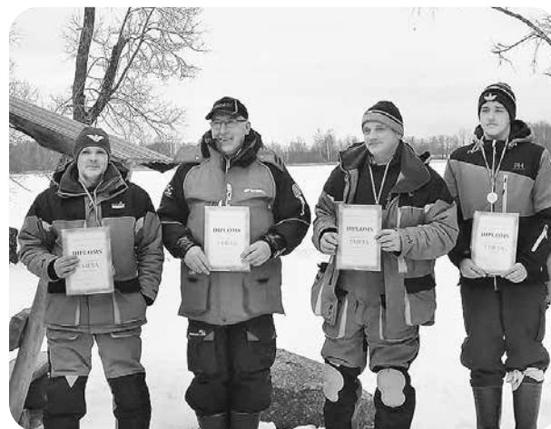
Valdis otrais no kreisās.

abi iegulda lielu laiku un pamatīgu darbu, lai izveidotu kārtīgu godalgu un trofeju telpu jauniegūtajā ģimenes īpašumā Upes ielā.