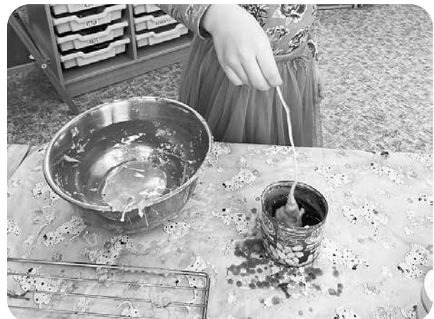
Sveču liešanas procesā.

Februāris tiek dēvēts par sveču mēnesi, bet 2. februāris par Sveču dienu. Lai Sveču dienas tradīcijas neizzustu pavisam, arī mūsu iestādē ik gadu notiek radošas aktivitātes par godu Sveču dienai, jo viens no uzdevumiem pirmsskolā ir veicināt latviešu tautas tradīciju iedzīvināšanu un kopīgu svētku svinēšanu. Visas dienas garumā bērni aktīvi darbojās – leja un audzēja sveces, iepazīna Sveču dienas ticējumus, apliecēja sveces ar dziju un pat gleznoja ar svecēm. Cik daudz prieka var sagādāt ar mīlestību veikti bērnu darbiņi! Sveču dienā lietās sveces deg visgaišāk un visilgāk. Neticiet – pamēģiniet paši!