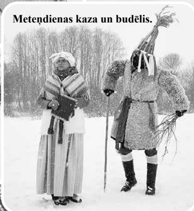
Metēdienes kaza un budēlis.