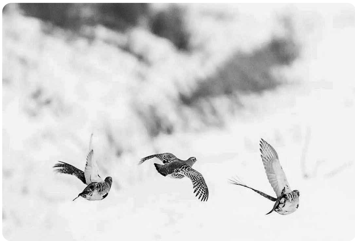
Pērno ziedu nokrāsā līgani pār laukiem steidz irbes.