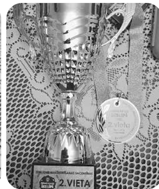
Kausa un medaļa par izcīnīto 2. vietu sacensībās „Āķis lūpā”.