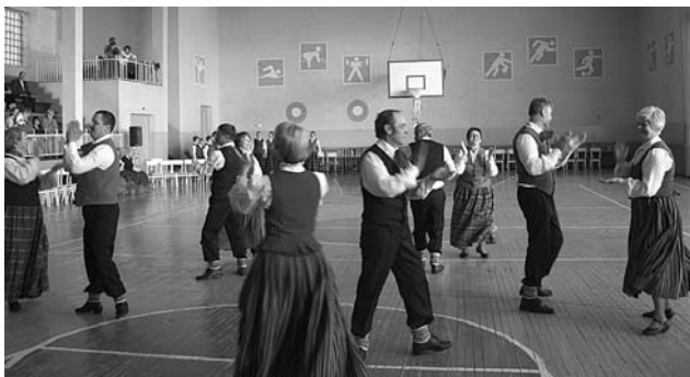
Dejo otrais vidējās paaudzes deju kolektīvs.