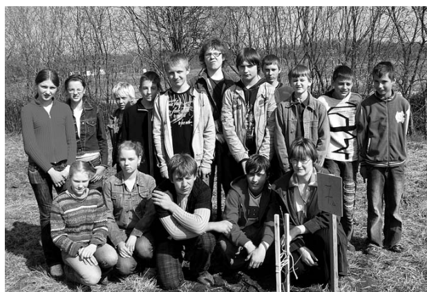
7. klases skolēni.