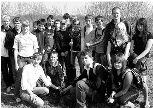
8. klases skolēni.