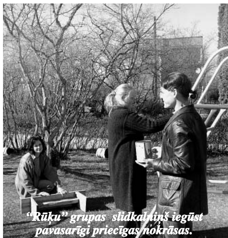
"Rūķu" grupas slīdkalniņš iegūst pavasarīgi priecīgas nokrāsas.