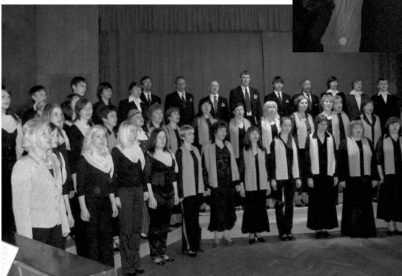
Kopkora izpildījumā skan valsts himna.