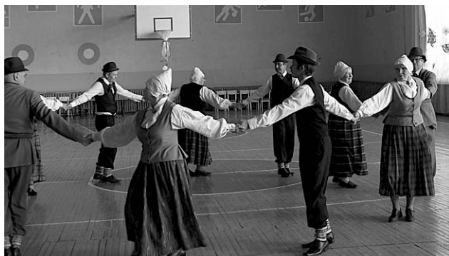
Dejo visvecākie dejojāši.