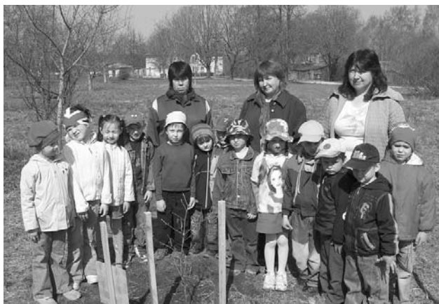
„Kaķu” grupas bērni un skolotājas pie iestādītā ozola.

Nedēļas laikā bērni kopā ar skolotājiem pārrunāja par koku nepieciešamību dabā, par to saudzēšanu, aizsardzību, mācījās latviešu tautas dziesmas par ozoliem, salīdzināja kokus ar cilvēkiem. Ieinteresējot mazos par šo tēmu, centāmies attīstīt piederības sa-