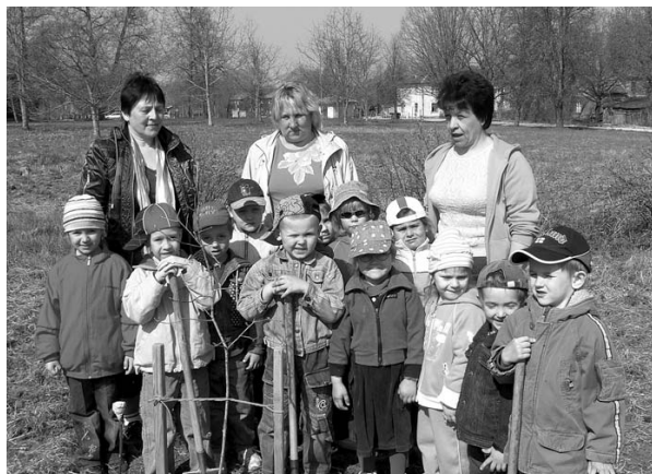
„Rūķu” grupas bērni un skolotājas pie iestādītā ozola.