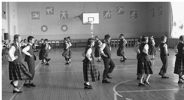
Dejo Ļaudonas vidusskolas deju kolektīvs.