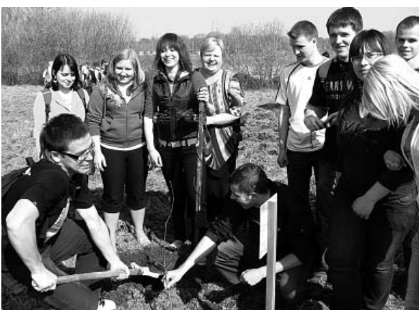
11. klases skolēni.