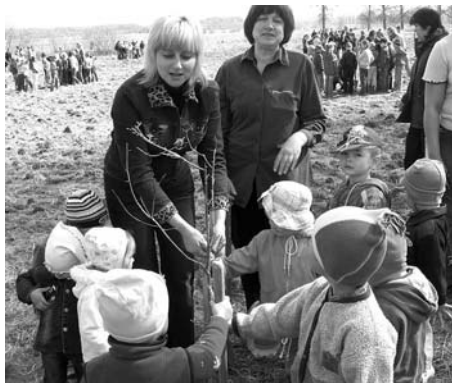
“Zaķu” grupiņas bērni un skolotājas pie sava ozola.

Akcijas mērķis bija celt pilsonisko pašapziņu, stiprināt lepnumu par savu māju, skolu, pagastu, valsti, padziļināt zināšanas par Latvijas kokiem un dižkokiem. Visi šie mērķi ir iekļauti arī pirmsskolas audzināšanas programmā. Tādēļ arī mēs, PII, iesaistījāmies šajā akcijā.