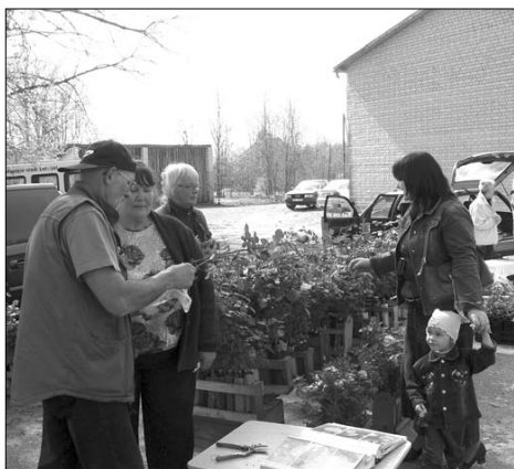
Ļaudonieši izvēlas rožu stādus.

piedāvāja Latvijā ražotus dīvānus. Protams, kā jau katrā tirgu, pircējiem tika piedāvātas arī citas rūpniecības preces.