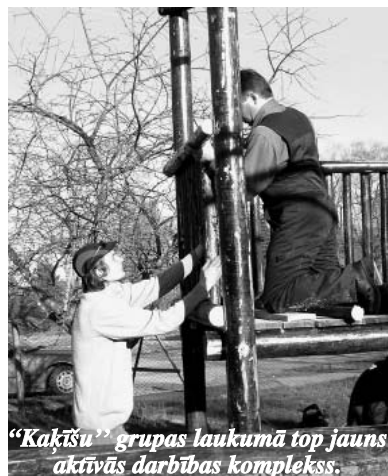
"Kaķu" grupas laukumā top jauns aktīvās darbības komplekss.