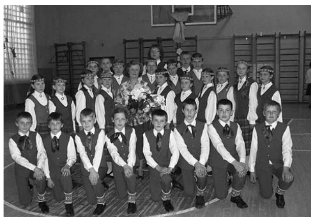
Ļaudonas vidusskolas dejojāši.