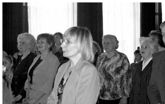
Koncerta noslēgumā visi kopā dzied l.t.d.z. „Pūt, vējiņi!”.