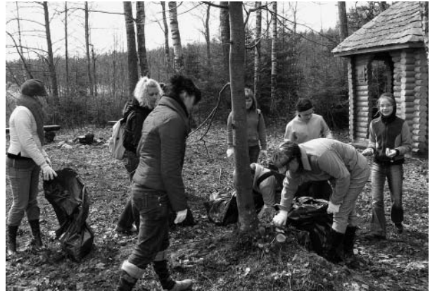
Atpūtas vietas sakopšanas laikā.

Tas nozīmē, ka cilvēki kļūst kulturālāki un atkritumus izmet noliktajās tvertnēs, nevis zemē. Tas mūs visus patīkami pārsteidza. Pēc padarītā darba ļoti jauks atpūtas mirklis pie ugunsкура ar desiņu cepšanu, interesantām sarunām un nelieliem konkursiņiem par meža dzīvi. Paldies meža darbiniekiem par vērtīgu informāciju, praktiskiem piemēriem dabā!