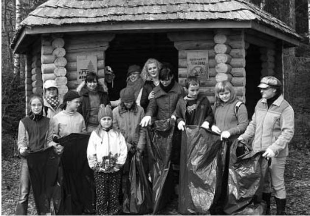
Pēc padarīta darba.