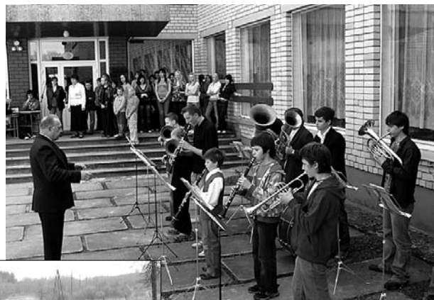
Svinīgais pasākums skolas pagalmā pirms ozolu stādīšanas.

28.aprīlī Ļaudonas vidusskolas skolēni, skolotāji un pirmsskolas izglītības audzēkņi un viņu skolotāji pulcējās uz svinīgo līniju skolas pagalmā. Svinīgo līniju atklāja skolas pūtēju orķestris skolotāja V.Baloža vadībā,