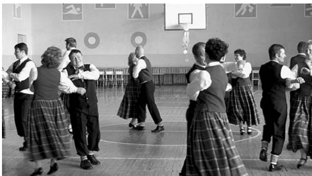
Dejo vidējās paaudzes deju kolektīvs.