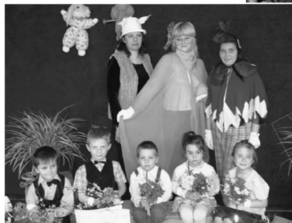
Nebēdnis „Vējiņš” kopā ar draugiem un aprīļa mēneša jubilāriem.

Ļaudonas PII par tradīciju kļūvis vienu reizi mēnesī atzīmēt bērnu dzimšanas dienas. 17. aprīlī visa saime pulcējās kopā, lai sveiktu šī mēneša gaviļniekus.