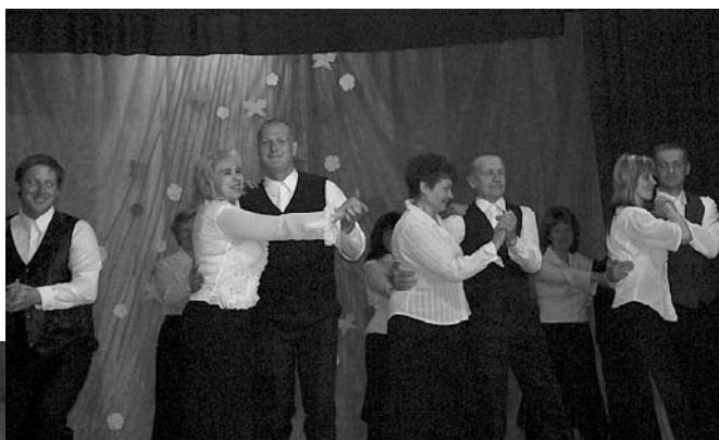
Dejo vidējās paaudzes deju kolektīvs.

Latvijas Republikas Neatkarības deklarācijas pasludināšanas dienā, 4. maijā pulksten 18.00, vairāk nekā 400 Latvijas kultūras namos skanēja "Dievs, svētī Latviju!". Ar himnu atklāja Latvijas Kordiriģentu asociācijas organizēto koncertu "Ar dziesmu par Latviju". Arī Ļaudonas kultūras nams atbalstīja šo pasākumu, lai pievērstu Latvijas sabiedrības uzmanību Dziesmu svētku galvenajai un vēsturiskajai idejai – dziesmas un dejas mīlestībai, dotu iespēju katram iedzīvotājam