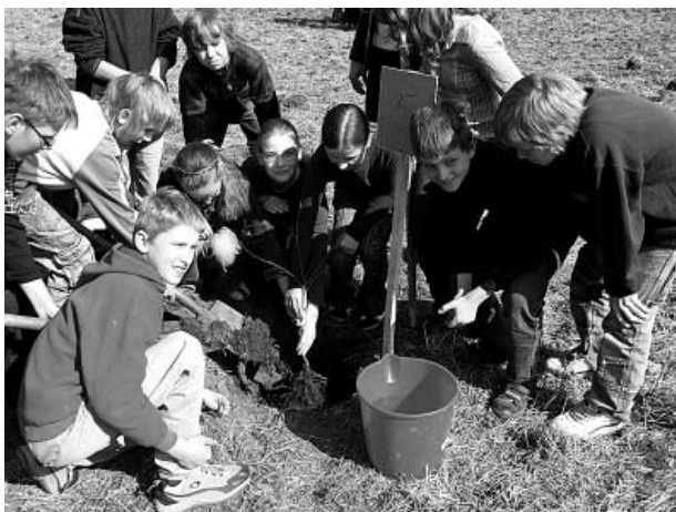
Savu ozolu iestāda 5. klases skolēni.