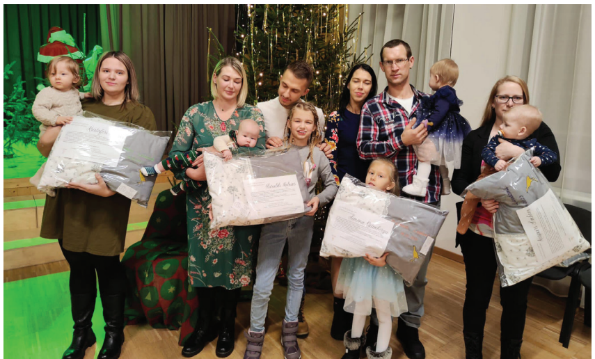
Ļaudonas pagasta jaunie vecāki saņem pagasta pārvaldes dāvanu – „Dzimis Ļaudonā”.

pikojās un brauca pasaku vilcienā – līdz beidzot atradām pašu svarīgāko – mīļo Ziemassvētku Vecīti!