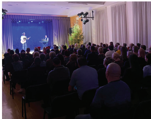
Koncerts Otrajos Ziemassvētkos.