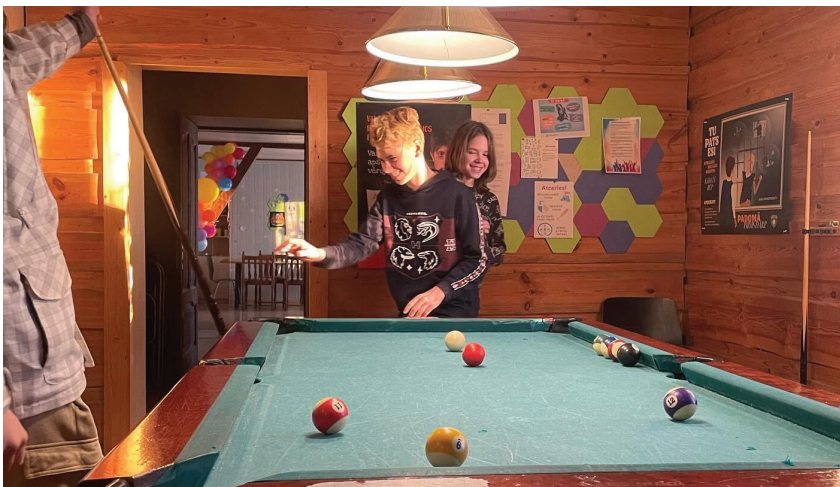
Biljarda spēles laikā.

17. janvārī notika biljarda turnīrs, kurā piedalījās 12 bērni. Spēles bija ļoti sīvas un nervu kutinošas, jo uzvarēt vēlējās jebkurš.