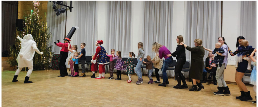
Pasākuma „Kā Rūķīte pēc dāvanām brauca” laikā.

Pasākumā Ļaudonas pagasta amatiereteātra aktieri, kas bija pārtapuši pasaku tēlos, kopā ar bērniem devās meklēt Ziemassvētku vecīti un dāvanas. Rūķene, Vilks, Lokomotive un Zaķis kopā ar bērniem gan mācījās pulksteni, gan dejoja un