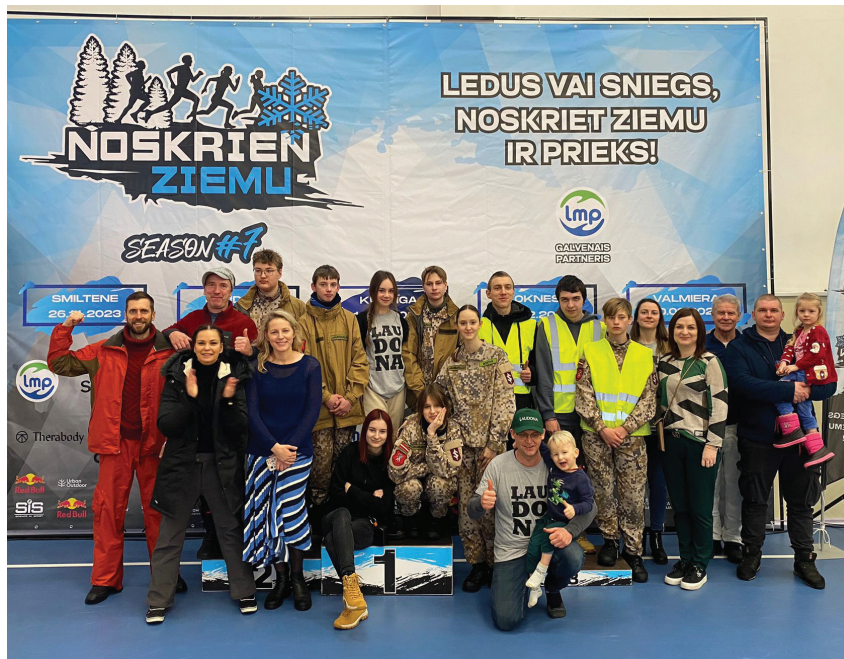
Brīvprātīgo komanda kopā ar Ļaudonas pagasta pārvaldes darbiniekiem.

„[...] Esot bijusi taku skriešana, bet es teiktu, ka tas bija kaut kāds