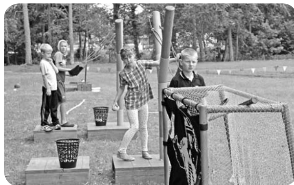
Netradicionālās sporta spēles gan lieliem, gan maziem.

Dienas turpinājumā mazākie pagasta iedzīvotāji izmantoja iespēju piedalīties radošajās darbnīcās, kurās viņiem bija iespēja gan pašiem pagatavot kādu mājup nesamu nieciņu, gan arī ļauties darbnīcas mākslinieču radošajam lidojumam - veidot zīmējumus uz sejas un rokām. Daudzi mazie ļaudonieši uzskatīja, ka tas ir labs veids, kā saposties pagasta svētku koncertam, un ar zīmējumiem turpināja rotāties līdz pat svētku izskaņai.