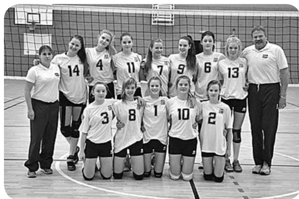
Latvijas volejbola kadetu meiteņu izlase.