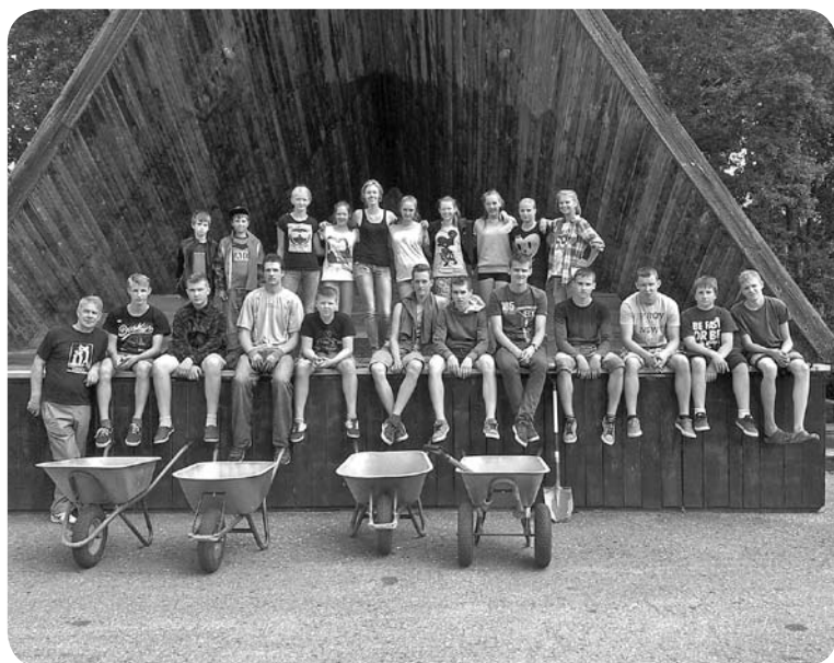
Jaunie volejbolisti pēc talkas pagasta parkā.

Šīs nometnes mērķis bija veselīga dzīvesveida veicināšana, volejbola spēles mācīšana, komandas darba iemaņu veidošana. Brīvajā laikā nometnes dalībnieki skatījās nodarbību laikā uzfilmētos video, piedalījās vides sakopšanas darbos pagasta parkā un pagasta svētku norises laikā, apmeklēja jauniešu centru „Acs”.