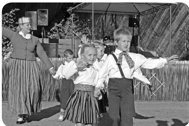
Dejo PII „Brīnumdārzs” audzēkņi.