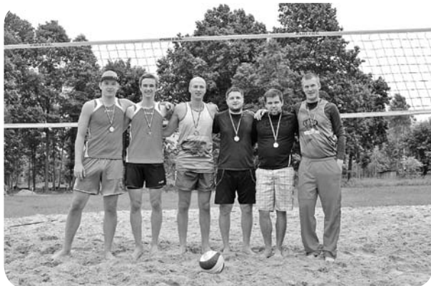
Volejbolisti pagasta svētkos.

Vadoties no pareiza dienas režīma, pēc mošanās sekoja sportiskas aktivitātes svaigā gaisā. Ikvienam, gan lielam, gan mazam, bija iespēja izmēģināt spēkus, piedaloties netradicionālās sporta spēlēs, kur galvenais uzvars tika likts nevis uz rezultātu sasniegšanu, bet gan uz jautrības nodrošināšanu gan pašiem dalībniekiem, gan vērotājiem. Savukārt rūdītākiem sportistiem un lielākiem sporta entuziastiem bija iespēja piedalīties pludmales volejbola turnīrā.