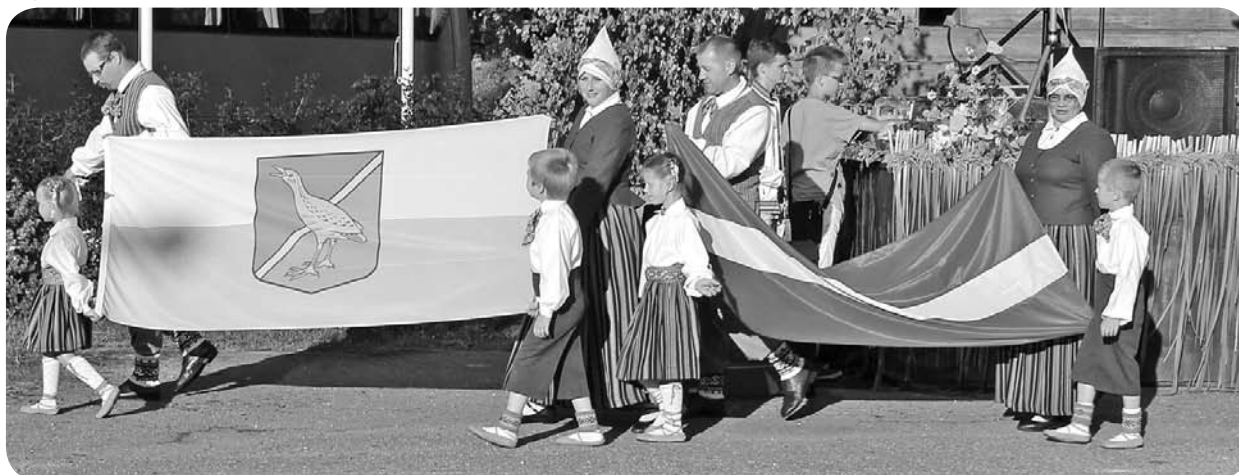
Svinīga karogu pacelšana.