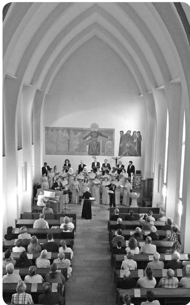
Koncerts Kloppenburgas luterāņu baznīcā.

Koncerts Alhornas katoļu baznīcā noteikti bija visspēcīgākais, emocionālākais un vizuāli skaistākais, pateicoties baznīcas arhitektūrai un dabīgajai gaismai, kas caur vitrāžām apgaismoja kori.