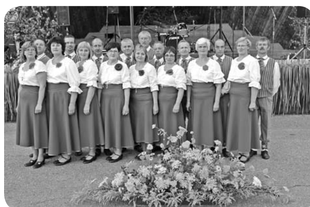
Senioru deju kolektīvs pēc uzstāšanās svētku koncertā un pēc dejas, ko pirmo reizi dejojā pagasta svētku koncertā.

Svētku izskaņā vēl viens arī jau par tradīciju kļuvis rituāls. Tieši pirms pusnakts devāmies gaišo domu lidojumā pār Ļaudonu, palaižot debesīs krāsainas laternas ar dažādām gaišām domām - par labāku, skaistāku un gaišāku nākotni mums Ļaudonā un visā Latvijā.