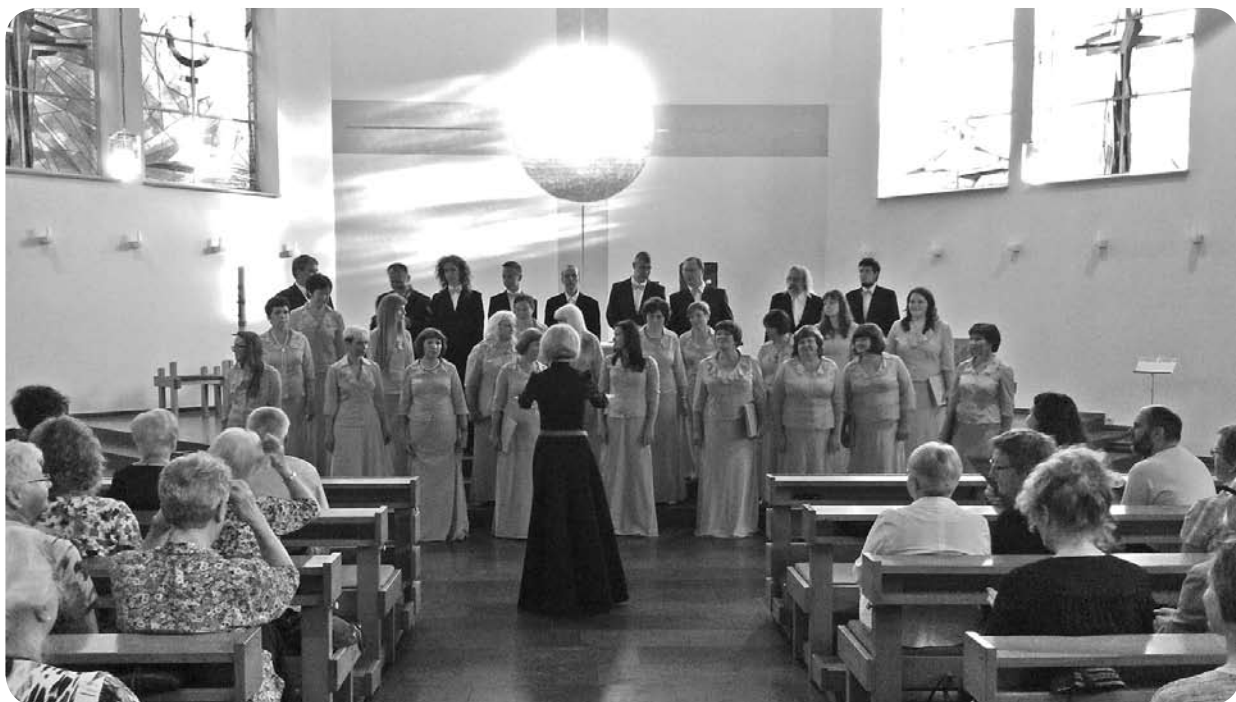
Koncerts Alhornas baznīcā.

Paldies visiem tiem, kas ar visu sirdi un dvēseli bija kopā ar kori, esot tur - Vācijā.