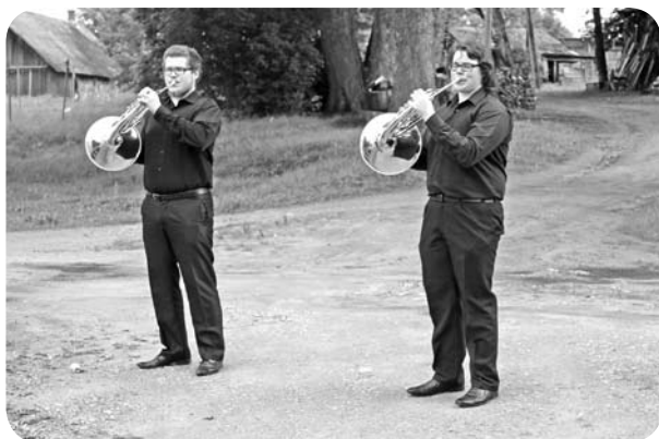
Ļaudonieši mostas, skanot mežragu skaņām.

Nu jau par tradicionālu norisi kļuvusi ļaudoniešu un Ļaudonas modināšana. Pagājušajā gadā visi mosties tika aicināti uz Aiviekstes tilta, taču šoreiz, lai mostos, nebija nekādas vajadzības atstāt savas gultiņas. Šoreiz ļaudoniešiem bija iespēja mosties kā senos laikos, kad iedzīvotājus modināja taures skaņas. Ar mežraga skaņām rīta agrumā tika pieskandinātas tuvas un tālas pamales, daudzdzīvokļu māju pagalmi, kā arī pagasta iestādes. Neviens nedrīkstēja nokavēt Ļaudonas svētkus.