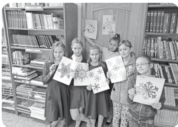
Radošajā pēcpusdienā bibliotēkā tapa skaistas un krāsainas sniegpārslas.

Pēkšņi tas parādās - pirmais sniegs. Un citviet sasnieg biežā segā, kamēr citur nav sagaidāms. Kāds ir sniega un tā miniatūro "šūniņu" - sniegpārslu - noslēpums? Kāpēc sniegs ir tāds, kāds tas ir? Snieg tur, kur snieg?