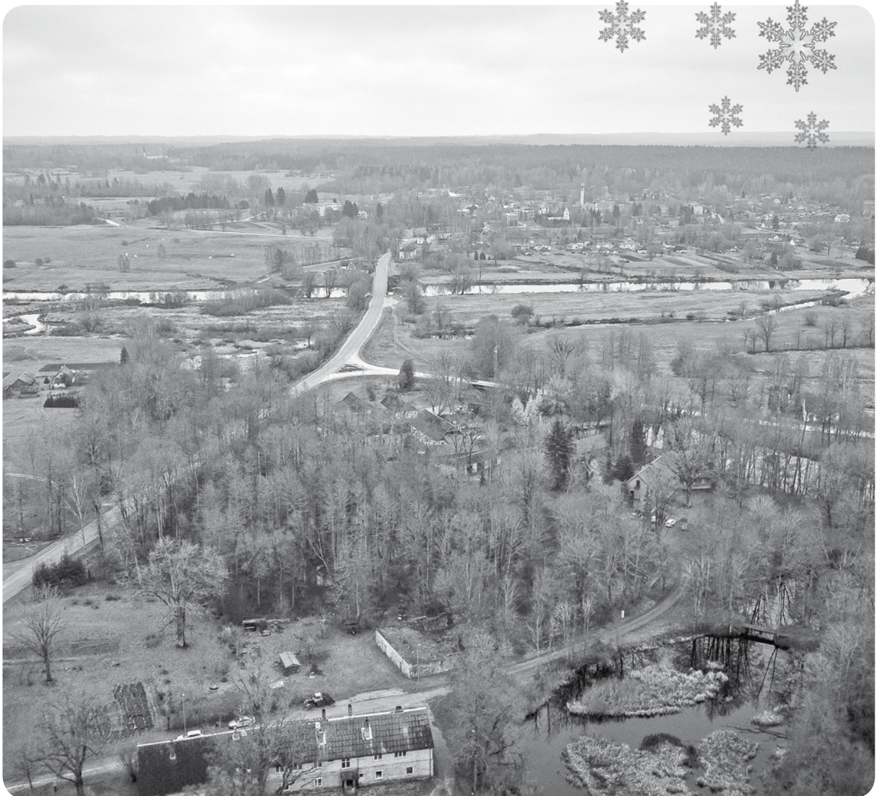
Ļaudona no putna lidojuma. 2018. gada 16. novembris.