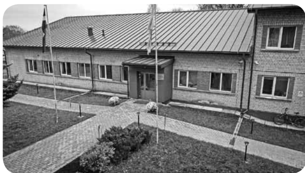
Kultūras nams piedzīvojis vizuālas pārmaiņas gan iekštelpās, gan apkārtnē.