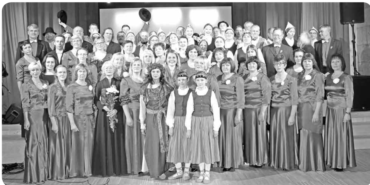
Paldies koncertuzveduma „Latvijas stāsts, kamolā satīts” māksliniekiem un skatītājiem! Mums kopā izdevās radīt brīnišķu dāvanu Latvijai svētkos!

Signe Prušakeviča Māra Stiprā un Mārites Cīrules foto