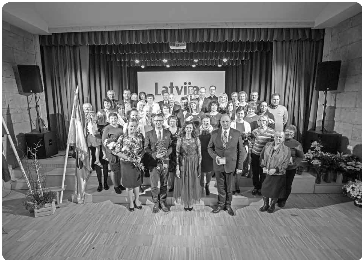
Pateicības pasākuma kopbilde.