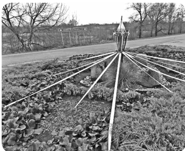
Svētku rota ceļu krustojumam.