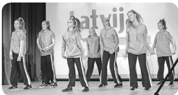
Madonas mūsdienu deju grupa „Aliens”.