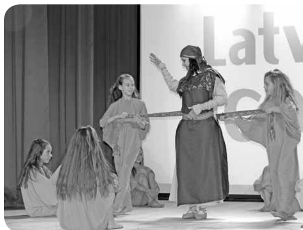
Koncertuzvedums „Latvijas stāsts, kamolā satīts”.