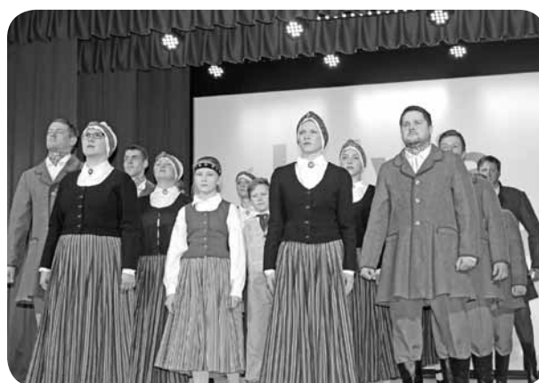
Vidējās paaudzes deju kolektīvs „Grieze” un A. Egliša Ļaudonas vidusskolas skolēni.