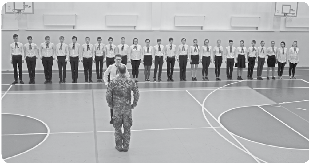
A. Eglīša Ļaudonas vidusskolas skaitliski lielākā - 9. - klase ierindas skatē rādīja lielisku sniegumu.

Cerēsim, ka šī tradīcija turpināsies un atsaucība būs