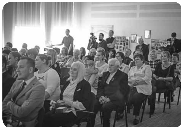
Prieks par ļaudoniešu interesi un svētku atmosfēru kultūras nama atvēršanas dienā.