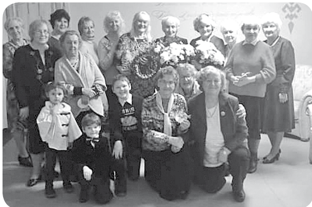
Klubiņa dalībnieces kopā ar mazajiem māksliniekiem.