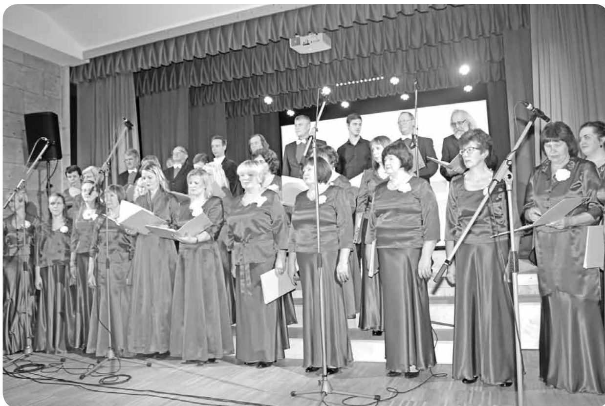
Pagasta jauktais koris „Lai top!”.