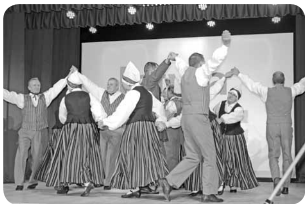
Senioru paaudzes deju kolektīvs “Divi krasti”.