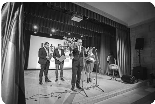
Sveiciens vārdus teic novada domes deputāti.