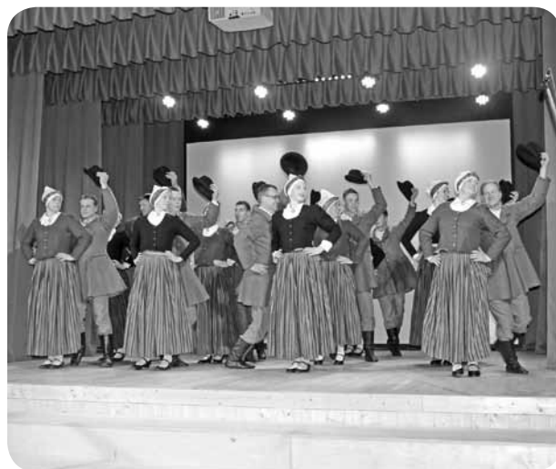
Vidējās paaudzes deju kolektīvs „Grieze” ar speciāli šim pasākumam apgūtu deju „Diždeja”.