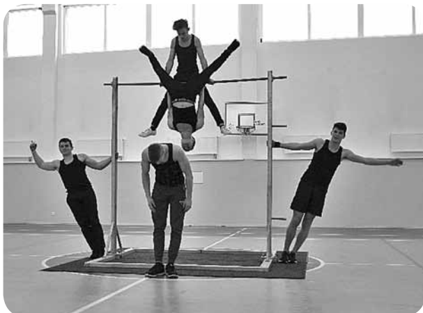
Pēc apbalvošanas laudoniešus priecēja un ar sportisku enerģiju uzlādēja ielu vingrotāji no Madonas - BarX.