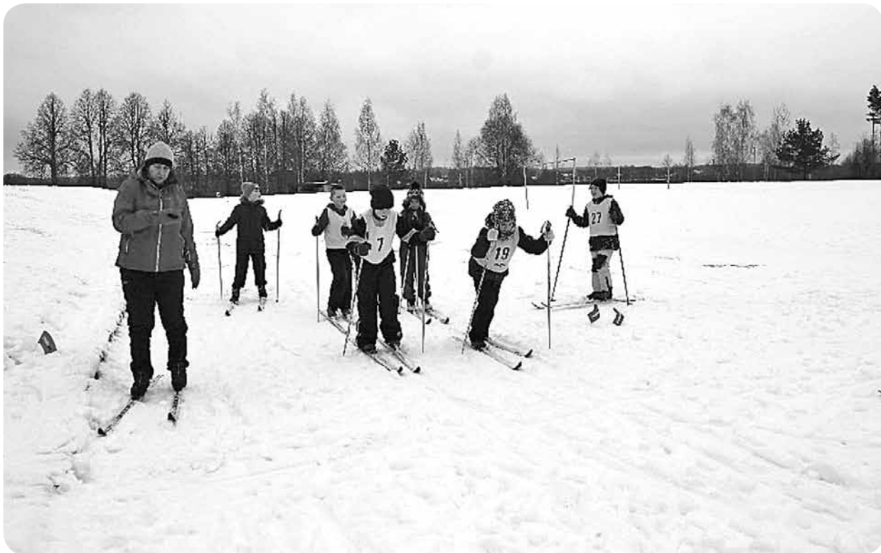
Tiek dots starts komandu disciplīnai – biatlonam.

2. februārī tradicionāli notika Sniega diena. Laikapstākļi lutināja un visu dienu spīdēja saulīte. Sasildīties bija iespējams pie ugunsкура, turpat arī iedzert tēju.