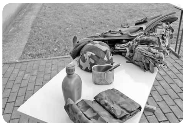
Jaunsargi bija parūpējušies par interesantiem uzskates līdzekļiem.