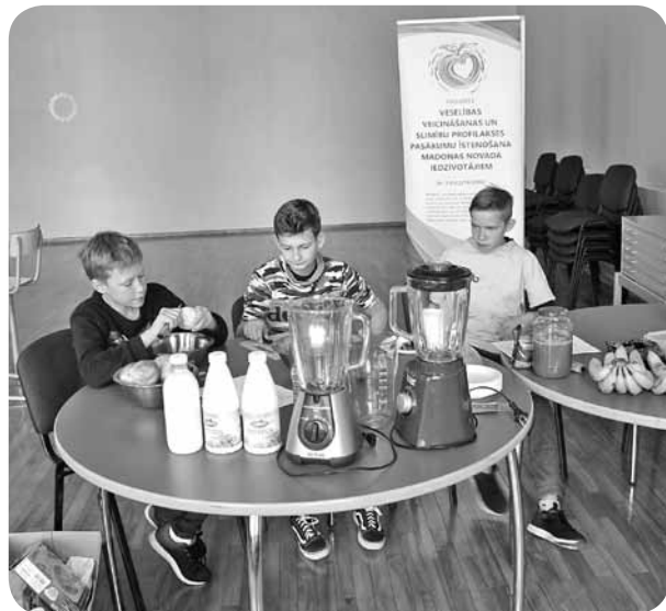
Veselīga uztura meistarklasē tika interesanti pastāstīts un praktiski parādīts, kā gatavot veselīgas uzskodas.