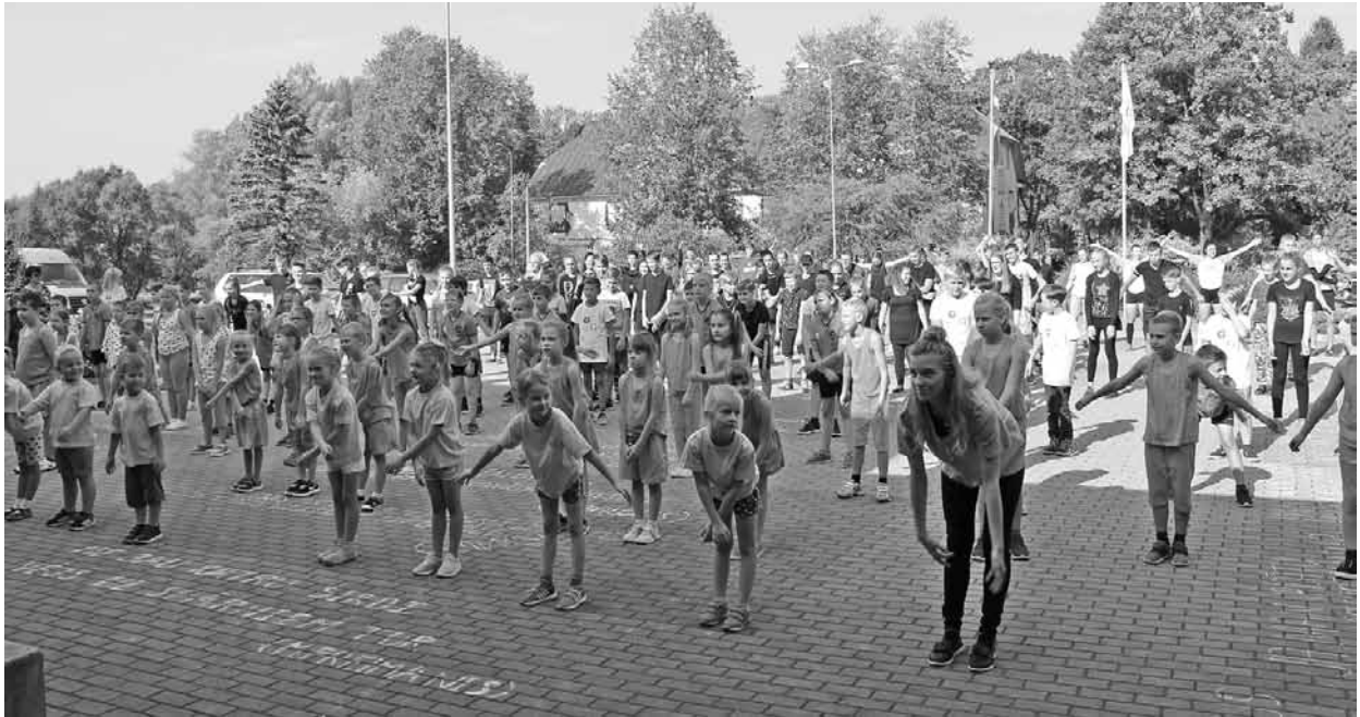
Jautra un atraktīva rīta vingrošana visiem kopā - gan lieliem, gan maziem.

21. septembrī visā Latvijā, tostarp Ļaudonas pagasta izglītības iestādēs, norisinājās Olimpiskā diena.