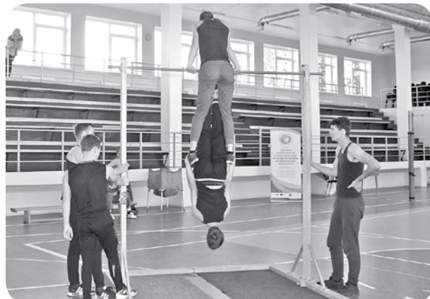
Ielu vingrotāju komandas no Madonas „BarX” šovs.