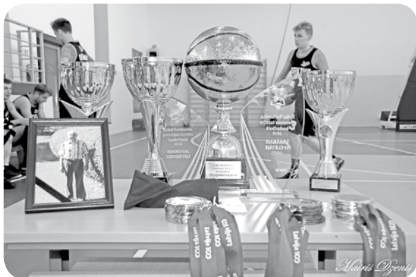
Pateicoties atbalstītājiem, balvu fonds ir bagātīgs un krāšņs.