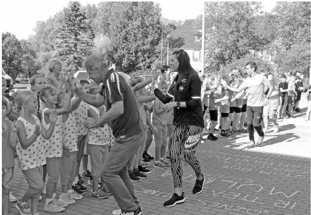
Skolas pagalmā tiek sagaidīti Olimpiskās dienas organizatori un viesi.

Visās norises vietās vienlaicīgi notika arī vingrošanas kompleksa atrāšanās - Olimpiskās dienas dalībnieki bija sagatavojušies un kopīgā vingrošana izdevās patiesi izcila! Rīta vingrošanas mērķis bija dalībniekus pamodināt un sagatavot turpmākās dienas aktivitātēm, kā arī atgādī-