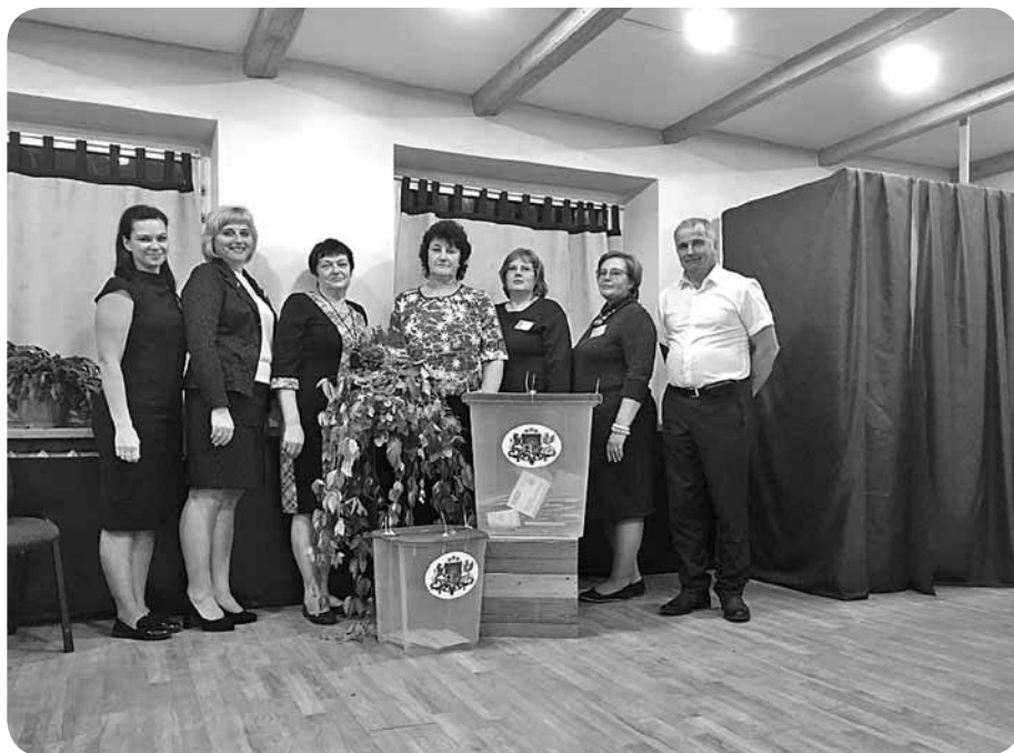
Ļaudonas vēlēšanu iecirkņa 13. Saeimas vēlēšanu komisija.

No 500 derīgajām apkopsnēm 493 bija ar derīgām vēlēšanu zīmēm.