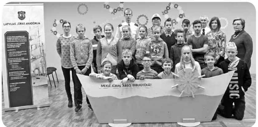
Bibliokuģa komanda kopā ar zinātkārajiem bērniem un atbalstītājiem.