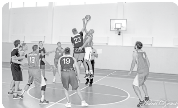
Šī gada turnīrā piedalījās 6 basketbola komandas.