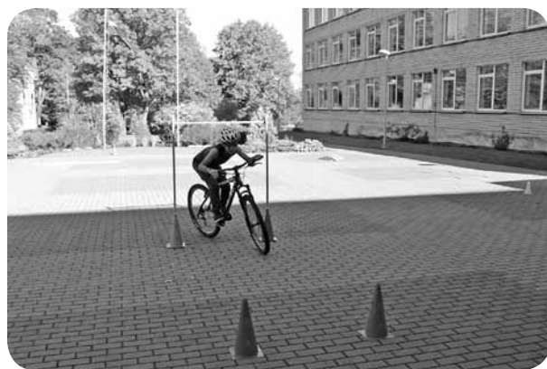
Uzdevumi velo trasītē.

Kamēr citi gatavoja veselīgu maltīti, tikmēr paralēli notika vidusskolas sporta zālē sportiskās aktivitātes - ielu vingrošanas paraugdemonstrējumi, ko ļoti gaidīja vairums cilvēku, pasākuma dalībnieku. Priekšnesums beidzās ar lielām ovācijām un aplausiem. Tiešām skaists priekšnesums puisi izpildījumā. Pēc tam viņi piedāvāja interesentiem pamēģināt pašiem tikt uz stieņa un atbildēja uz interesējošiem jautājumiem, kuri bija radušies pasākuma dalībniekiem. Paralēli tam sporta zālē notika arī individuālās sacensības.