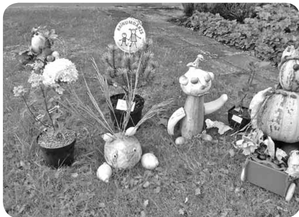
„Brīnumdārza” dārzenu Miķeļi, ko veidoja bērni kopā ar vecākiem Miķeļdienas pasākumā, aizceļoja uz Madonas Kartupeļu svētkiem, kur konkursā - izstādē tika novērtēti kā labākie.

• Ēdināšanas izmaksas par vienu apmeklēto dienu (bro-kastis, pusdienas, launags) - 1,32 EUR, Madonas novada pašvaldība sedz 0,57 EUR par apmeklēto dienu katram bērnam, tas nozīmē, ka VECĀKIEM jāmaksā (brokastis, pusdienas, launags) - 0,75 EUR.