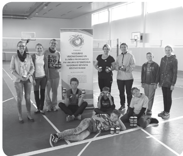
Izturīgākie Veselības dienas dalībnieki sportiskās dienas izskaņā.