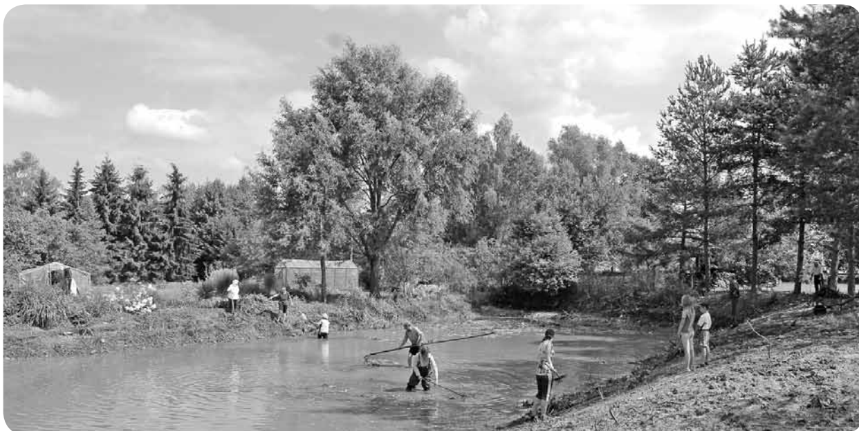
Dīķa tīrīšana, iesaistoties mazdārziņu īpašniekiem, kā arī pagasta darbiniekiem un pensionāta vadītājam.