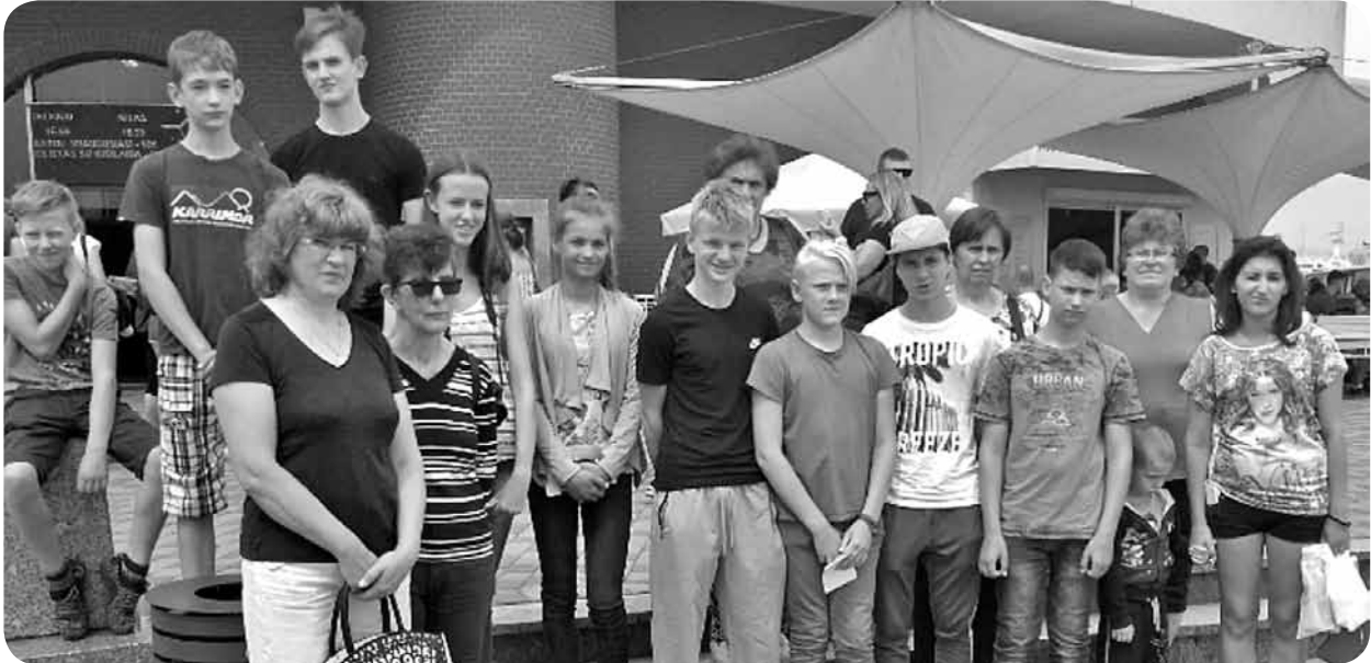
Ekskursanti gatavi doties uz Delfinārija šovu.

12. jūlijā BJIC „Acs” devās savā ikvasaras ekskursijā, šoreiz uz Klaipēdu. Jau sen jaunieši bija izteikuši vēlmi redzēt delfīnu šovu un pabūt Dinozauru parkā. Tagad šī jauniešu vēlme piepildījās.