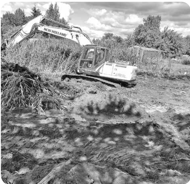
Dīķa rakšanas darbi.

2017. gadā tika izsludināts Nodibinājums „CEMEX Iespēju fonds”, kurā piedalījās arī Ļaudonas pensionāts ar projektu „Apkārtējās vides labiekārtošana pensionāta iemītnieku dzīves kvalitātes uzlabošanai”. Projekta mērķis - uzlabot pensionāta iemītnieku dzīves kvalitāti, sakopjot apkārtējo vidi ar un ap ūdens tilpni. Sakopt dīķi, kas atrodas pagasta teritorijā Avotu ielā 3. Lielie rakšanas darbi tika veikti 5. un 6. jūlijā, bet vēl jau darbu pie dīķa sakopšanas ir daudz - jāiztīra ūdens zāļu saknes, jānolīdzina zeme gar krastiem un vēl citi darbi.