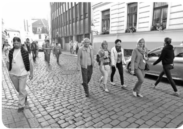
Brīvajā laikā no mēģinājumiem dejojāji ar prieku devās nelielās ekskursijās.