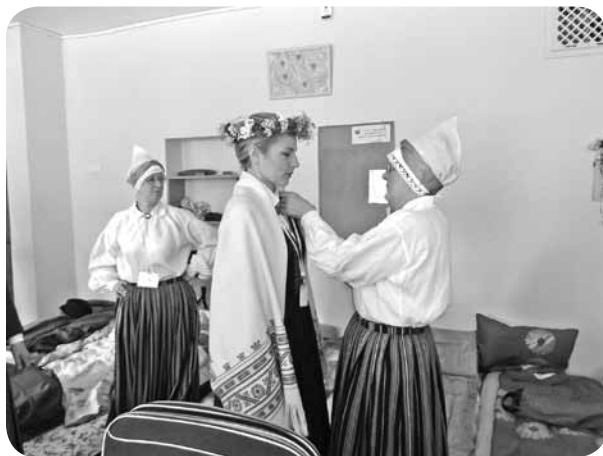
1. jūlijā dalībnieki bija agri cēlušies. Tomēr, iebraucot Rīgā, uzreiz posās svētku gājienam.