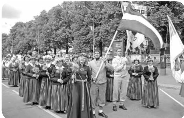
Jauktais koris „Lai top!” . Tā kā arī šie bija Latvijas 100gades svētki, organizatoru lūgums bija katram kolektīvam gājienā nest arī Latvijas karogu, ko Ļaudonas kolektīvi darīja.