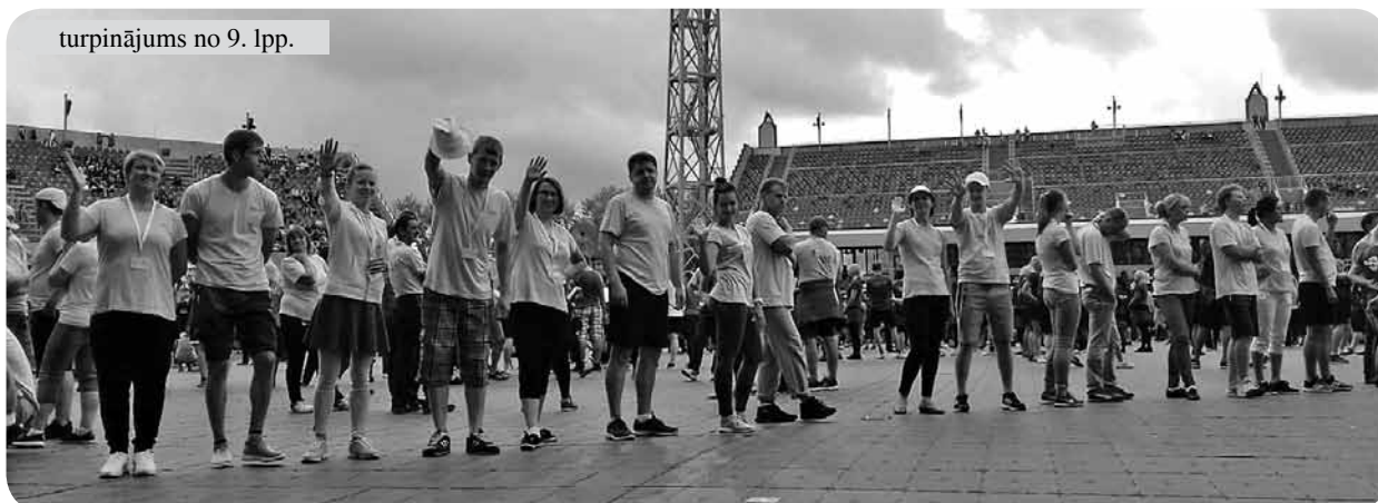
Intensīvajam mēģinājumu grafikam gatavi!