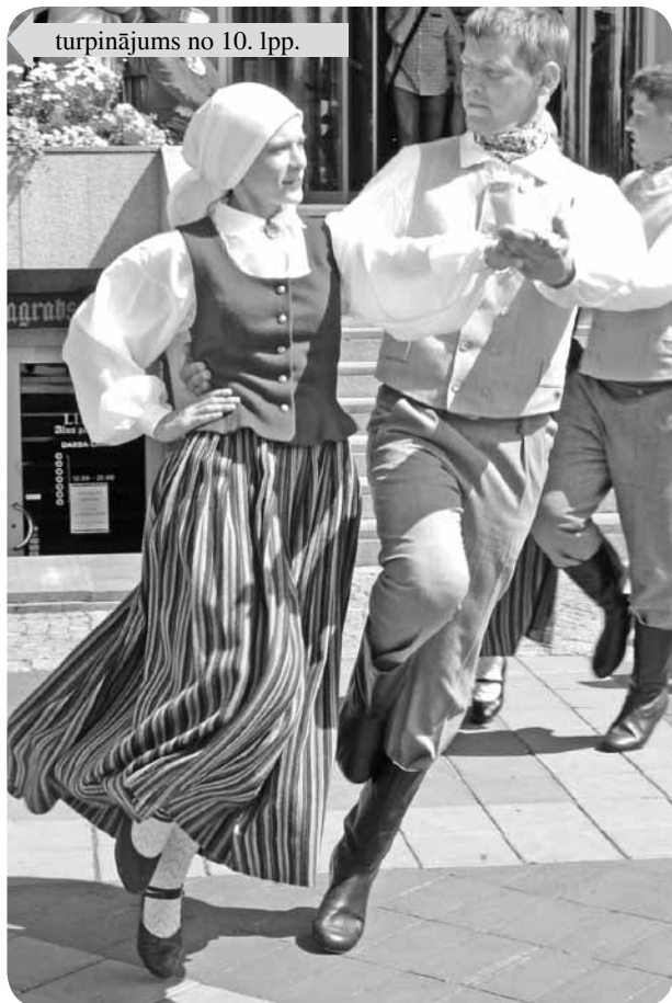
Brālīt's māsu dancot veda!