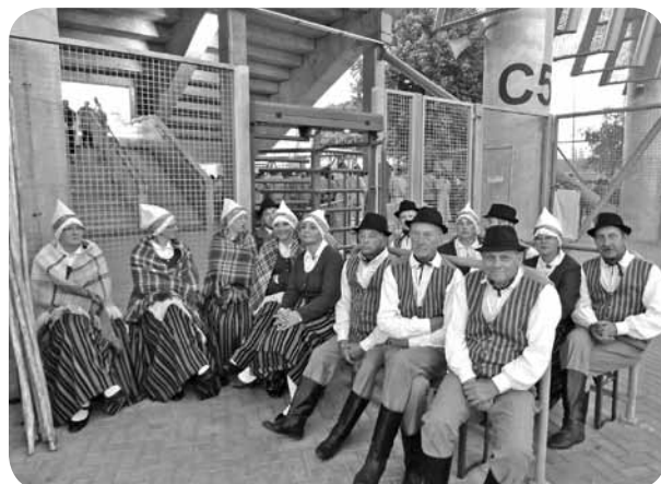
Senioru kolektīvs gaida savu iznācienu vakara koncertā.