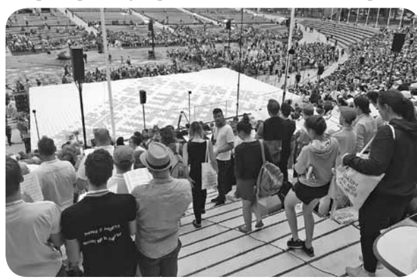
Mirkļis no mēģinājuma Mežaparka atjaunotajā estrādē.