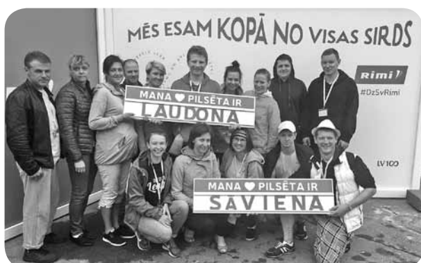
Vidējās paaudzes deju kolektīvs lepojas ar vietu, no kurienes nākuši.