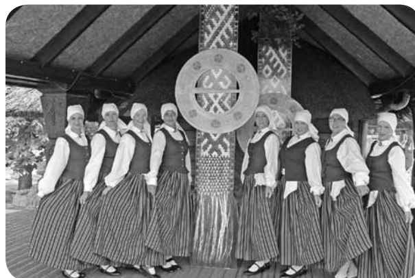
Meitiņas kā rozītes!