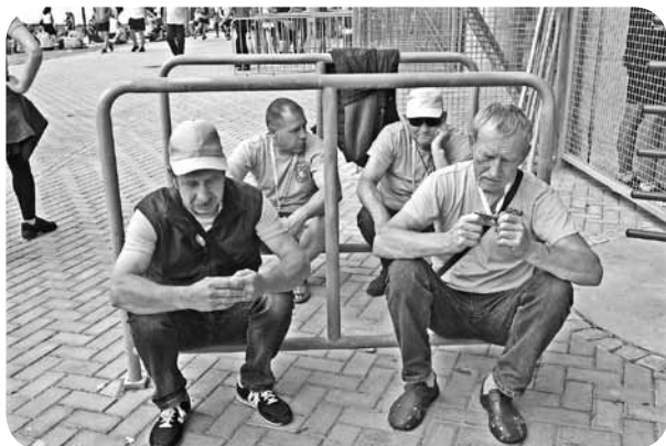
Nav svarīgi, kur. Ka tik piesēst un atpūtināt kājas...