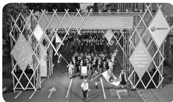
Ļaudonas pagasts cēli soļo svētku gājienā. Pagasta pārvaldes vadītājs nes Ļaudonas karogu.