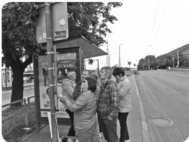
Kā lai tiek uz Daugavas stadionu?

Jūlija pirmā nedēļa aizritēja zem Dziesmu un Deju svētku zīmes. Par to, kā mūsējiem veicās Rīgā, lai stāsta neliela fotoreportāža.