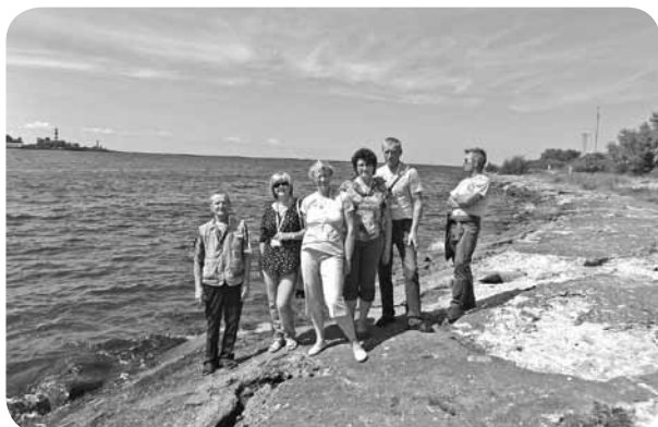
Atpūtas brīdis pie jūras.