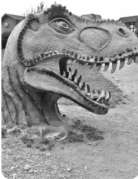
Atrakciju parkā pārsteidza daudz un dažādi dinozauri.

Dinozauru parkā sastapām 40 dažādus dinozauros, kuri gan kustējās, gan izdvesa skaņas, gan spļaudījās. Vislielāko interesi ieguva 5D kino, ko daži apmeklēja pat trīs reizes. Piedzīvojumiem bagāta bija vizināšanās ar katamarāniem, izkļūšana no spoguļu labirinta, no dino-