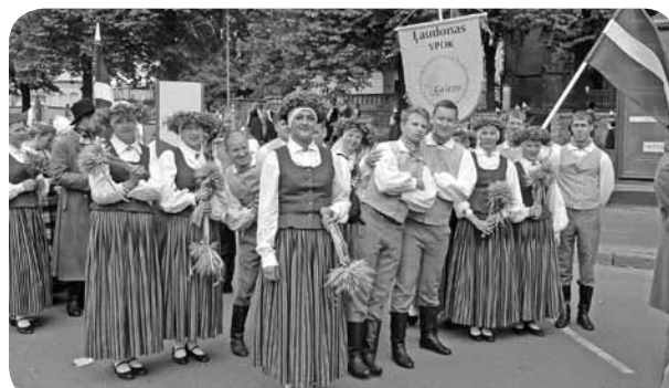
Kā zināms, stāšanās gājienam aizņem laiku, tādēļ var izklaidēties ar ne tik nopietnām bildēm.