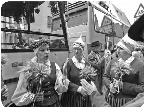
Pedējās norādes pirms došanās Rīgas ielās.