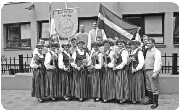
Vidējās paaudzes deju kolektīva „Grieze” dejotājiem šie svētki paliks atmiņā kā ļoti īpaši, jo lielai daļai tie bija paši pirmie Deju svētki.