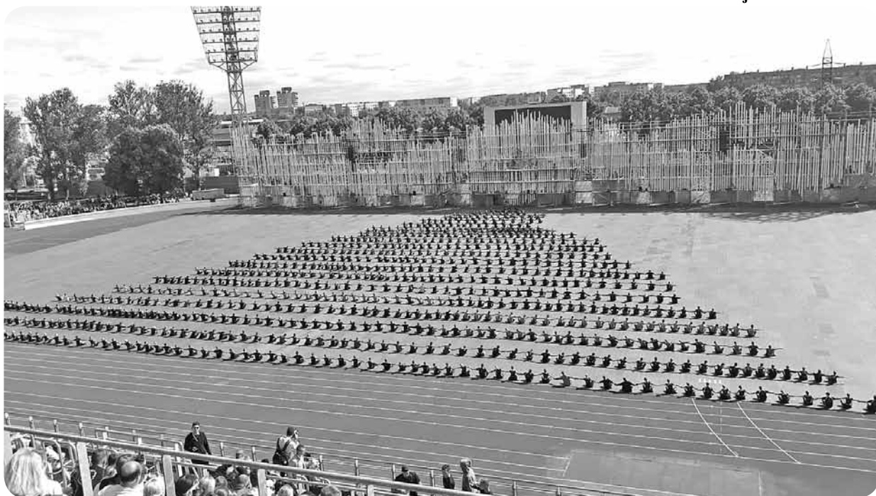
Mēģinājumu starplaikos, sēžot skatītāju tribīnēs, dejojājiem bija iespēja vērot citu kolektīvu sniegumu un redzēt skaisti veidotās zīmes uz laukuma.