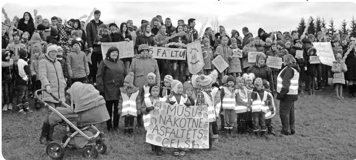
Televīzijas sižeta filmēšanas laikā.

Kā jau iepriekšējā avīzes numurā varējāt lasīt, oktobrī Ļaudonas pagasta pārvaldes vadītāja izsūtīja vēstuli atbildīgajām institūcijām ar prasību - Īstermiņā veikt valsts autoceļa P82 Jaunkalsnava - Lubāna asfaltēšanu posmā Jaunkalsnava - Ļaudona - Mūrnieki (līdz savienojumam ar autoceļu P62), lai nodrošinātu drošas un ērtas pārvietošanās iespējas reģiona iedzīvotājiem visos gadalaikos, lai garantētu reģiona turpmākās attīstības iespējas.