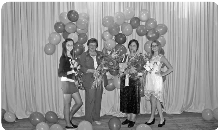
Pie krāšņā jubilejas desmitnieka!

Mūsu Centriņa galvenais uzdevums ir nodrošināt jauniešiem saturīgu un interesantu brīvā laika izmantošanu pēc mācībām skolā. Jauniešu intereses ir ļoti dažādas, tāpēc mēs cenšamies radīt apstākļus, lai jauniešu intereses apmierinātu.