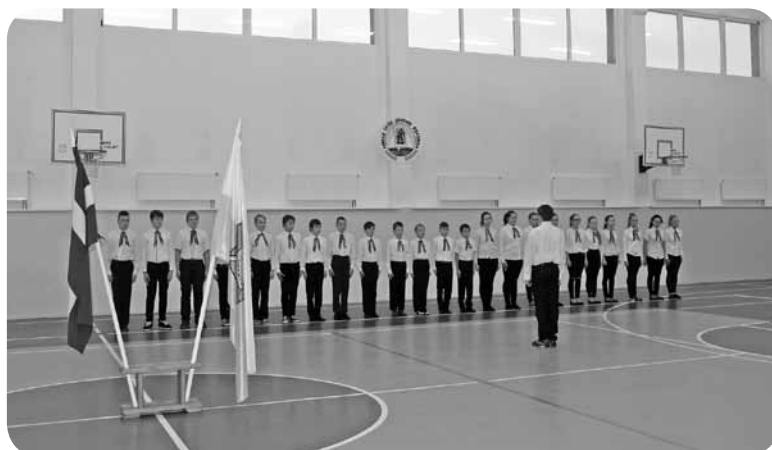
7. klase ierindas skatē.

Pēc piemiņas mirkļa pie Pārupes kapiem Gaismas ceļš veda uz Aiviekstes tiltu, kas tika izgaismots ar svečīšu liesmām. Gaismas ceļa noslēgums - pie A. Eglīša Ļaudonas vidusskolas, kur gājiena dalībniekus gaidīja silta tēja un ugunskurs, lai sasildītos un vēlreiz izdziedātu apgūtās karavīru dziesmas.