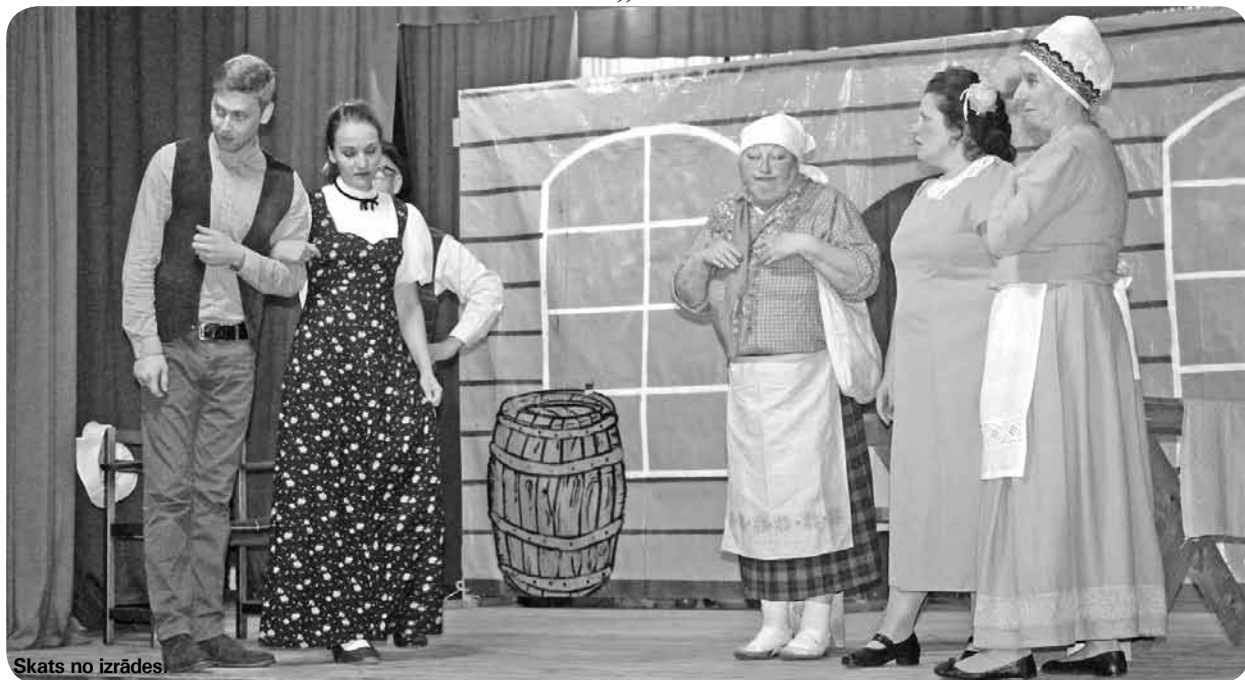
Skats no izrādes.