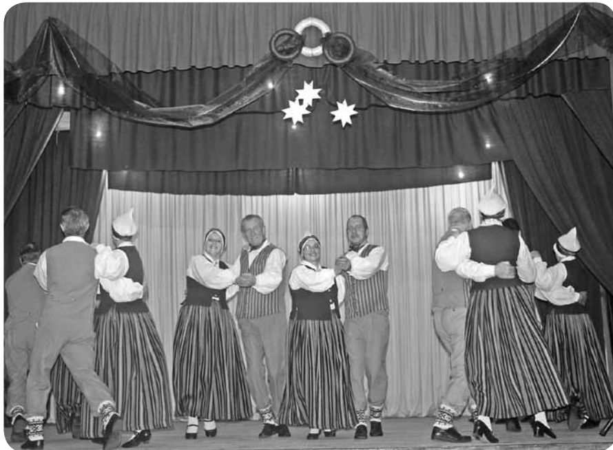
Deju kolektīvs „Divi krasti”.