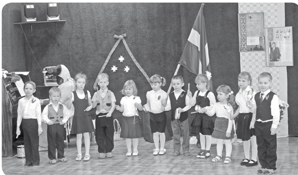
Muzicē "Rūķu" grupas bērni.