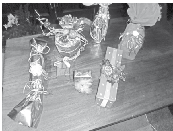
12. novembrī Ļaudonas kultūras namā notika radošā nodarbība „Dāvanu noformēšana”, kuras rezultātā tapa skaistas dāvanas un idejas turpmākajiem svētkiem.

Lai mūsos mājā gan dāvanu darinātāja prieks, gan dāvanu saņēmēja prieks! Un, ja dāvaniņa būs gatavota, ieliekot tajā