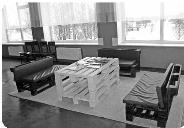
3. stāva atpūtas stūrīti mēbeles veidotas no koka paletēm, darbos iesaistoties arī pašiem skolēniem.

Vizītes mērķis bija novērtēt skolas sagatavotību jaunajam mācību gadam. Domes pārstāvji īpaši interesējās par 1. klases mācību darbu un ar prieku novērtēja izremontēto un moderni labiekārtoto dabaszinību kabinetu. Tāpat atzinīgi novērtēja interaktīvās tāfeles, kas ir vairākos kabinetos un sniedz skolēniem un skolotājiem iespēju paplašināt mācību procesu ar dažādām mūsdienīgām metodēm.