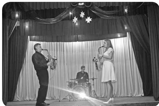
Ģimenes muzikālā apvienība „Muskatrieksts”.

Koncerta laikā tika sumināti mūsu pagasta cilvēki, kas saņēmuši Madonas novada pašvaldības apbalvojumus.