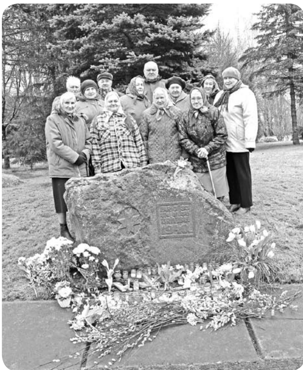
Pie piemiņas akmens Ļaudonā.

Stingst asins lāses dzīslās skarba marta rūtā, klie dzied doma neziņā - kas būs, ko teiks un kurā brīdī Liktenis ceļā dzīs? Zied neredzēti ziedi Sibīrijā, tie nāves aukstā krāsā plaukst, Pūš taigas meži moku sviēdru smārdu, liek cerībām kā vilku mātēm kauti - vīd domās sapnis balts par Latviju... Atgriezies ir ceļa gājējs sirms ar smagu atmiņsāpi sirdī. Ir atkal marts, deg svece piemiņai tiem mirušiem, kas svešā zemē mīlestību svēto neatstāja.