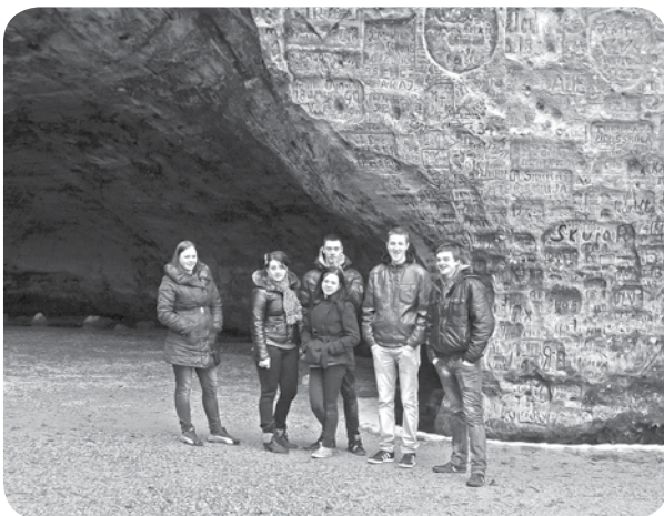
11. klases skolēni baudot Siguldas dabas krāšņumu.

15. martā A. Eglīša Ļaudonas vidusskolas 11. klases skolēni devās nopelnītā ekskursijā uz Siguldu. 15. marta laikapstākļi nebija visai iepriecinoši, taču tas neatturēja baudīt šo dienu. Bija iepianots apskatīt vairākus objektus, tādēļ ceļā devāmies jau agri no rīta.