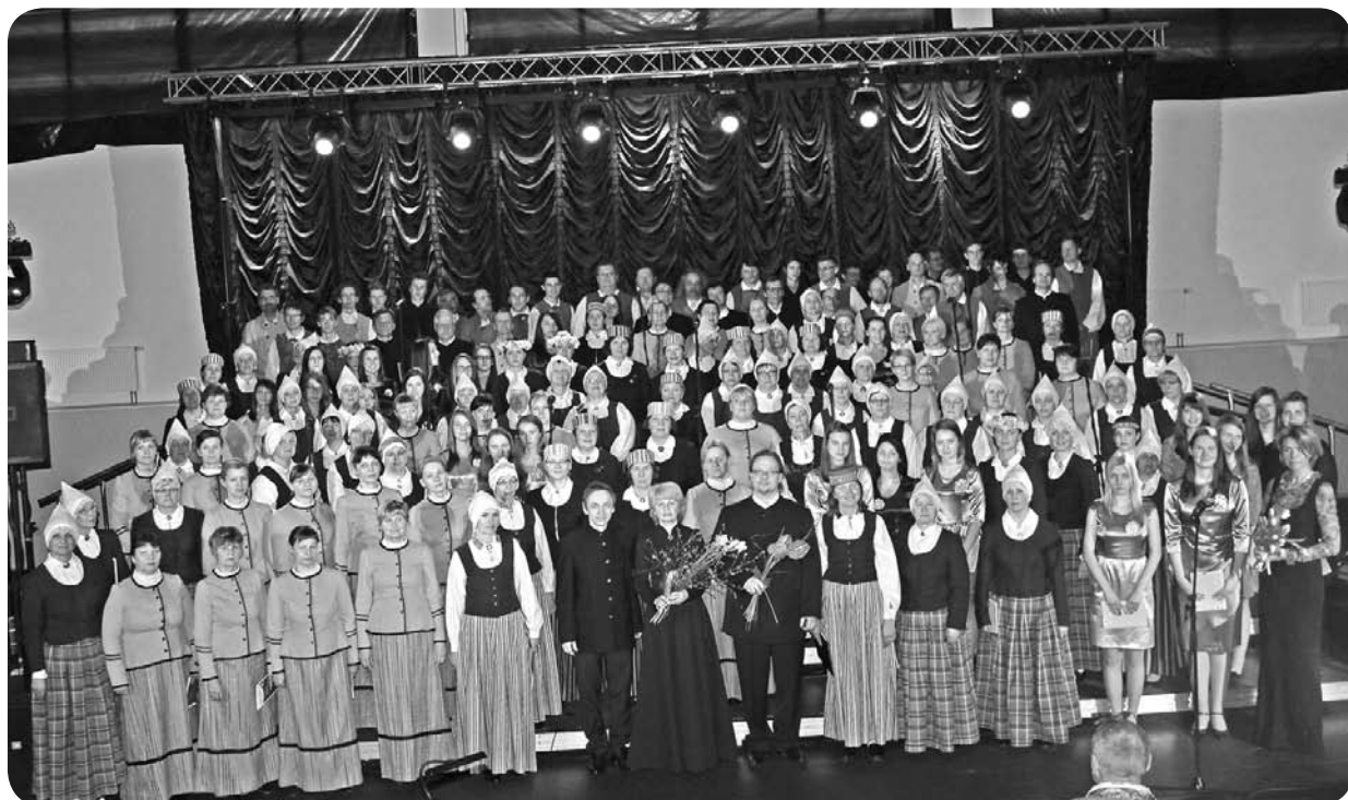
Raksta turpinājums 4. lpp.

Paldies skanīgajām balsīm, kas ļāva ielūkoties mūzikas krāsu karuselī! Koriem, kuru dziedātās dziesmas apgāja apli - apli dabā un cilvēka mūžā.