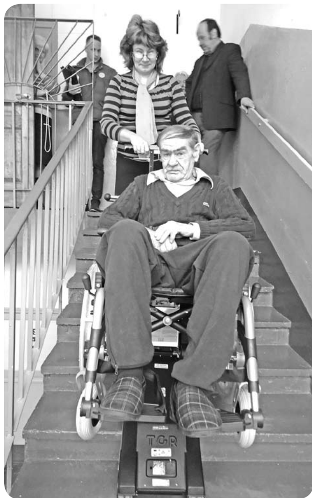
Pansionāta sociālā darbiniece iemēģina jauno pacelēju, iedrošinot arī pensionāta iemītniekus izmantot iespēju nokļūt svaigā gaisā.

Pirms kāda ilgāka laika piedalījāties Lattelecom programmā „Seniori apgūst datorprasmes”. Nedaudz jau zaudējām cerības par to, ka varētu saņemt datorus un apgūt kaut ko jaunu un interesantu. Bet nu, jaunam gadam iesākoties, datori piegādāti, un mēs varam sākt mācīties strādāt, apgūt, kas ir pele, dators, klaviatūra un vispār ko, strādājot ar datoru, var iemācīties. Interese par datoru radās uzreiz un jau tūlīt pēc pieslēgšanas sākām apgūt, kas ir kas. Visi darbinieki kopīgiem spēkiem apmācām pensionāta iemītniekus datorprasmēs.