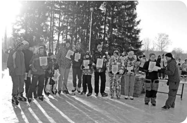
Pateicības saņem jaunieši, kas dienu un nakti strādāja pie hokeja laukuma izveides.

Pirmajā Ļaudonas hokeja turnīrā piedalījās a/s „Aldaris”, LTV „Tautas sports” un Ļaudonas komandas, kā arī komandas no Raunas, Madonas, Mētrienas un Mārcienas. Pēc vairāku stundu hokeja spēles tika sveiktas visas komandas, nosakot arī komandu, pie kuras nokļuš Ļaudonas hokeja ceļojošais kauss. Savā pirmajā hokeja spēlē Ļaudonas spēlētāji