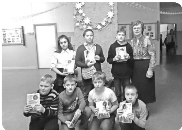
Decembrī skolēni tiek svinīgi uzņemti mazpulku saimē.

Pašreiz mazpulkā darbojas 27 mazpulcēni, no tiem aktīvi vasaras darbu projektos iesaistījās 27 skolēni, bet savu darbu aizstāvēt varēja tikai 17. Šajā mācību gadā mazpulcēnu nodarbībām pieteikušies 23.