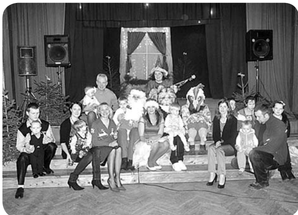
Bērni kopā ar Ziemassvētku vecīti un draugiem no Sarkanjiem.

21.decembrī uz svētku pasākumu tika aicināti bērni, lai kopīgi noskatītos Sarkanu amatiereteātra „Piņģerots” izrādi „Brēmenes muzikanti Ziemassvētkos” un sagaidītu Ziemassvētku vecīti. Izrāde bērniem un vecākiem patika, jo tajā darbojās spilgti un pamanāmi tēli – ēzelis, suns, gailis,