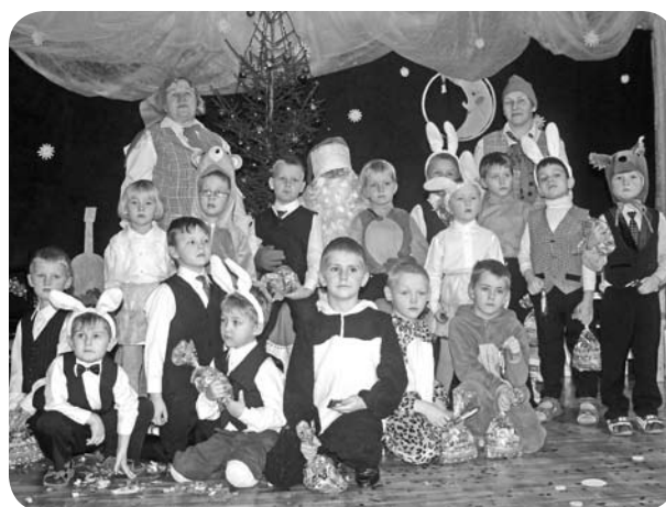
Pēc sagatavotajiem priekšnesumiem un gardo tūtu saņemšanas bērni labprāt fotografējās ar Ziemassvētku vecīti.

Un kā ikkatru gadu, Ziemassvētku vecītis bija klāt, lai uzklautu dzejoļus un iepriecinātu mazos bērnus ar saldiem gardumiem. Iepriecināti tika arī pieaugušie. Šogad, kad „Brīnumdārza” iegādāta cepeškrāsns, tika papildīts lolotais sapnis par kopīgu piparkūku cepšanu. Un tā iestādes labvēļiem tika pasniegtas gardās, bērnu rūpīgi ceptās un noformētās piparkūkas.