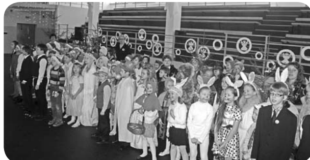
Mirklis no 1.- 4.klašu Ziemassvētku ludziņas uzveduma.

1.- 4. klašu skolēni kopīgi bija iestudējuši ludziņu, kurā darbojās dažādi meža dzīvnieciņi un pasaku tēli. Kopīgi izspēlētā ludziņa vēstīja par to, ka, lai arī reizēm ziemā ļoti auksti, tomēr