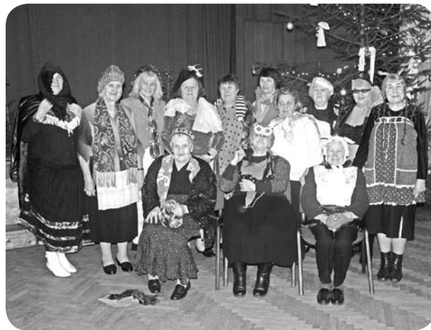
Pēc atraktīvās pārgērbšanās spēles.