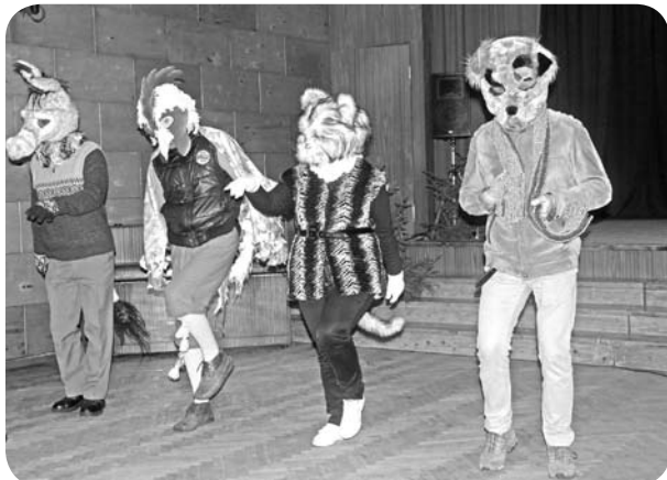
Krāšņās maksas izraisīja patiesu apbrīnu mazajos skatītājos.

21.decembrī uz svētku pasākumu tika aicināti bērni, lai kopīgi noskatītos Sarkanu amatiereteātra „Piņģerots” izrādi „Brēmenes muzikanti Ziemassvētkos” un sagaidītu Ziemassvētku vecīti. Izrāde bērniem un vecākiem patika, jo tajā darbojās spilgti un pamanāmi tēli – ēzelis, suns, gailis,