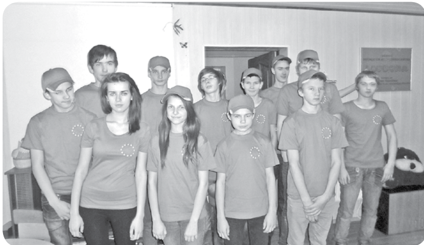
Jauniešiem prieks par iegūtajiem „Acs” krekliņiem.