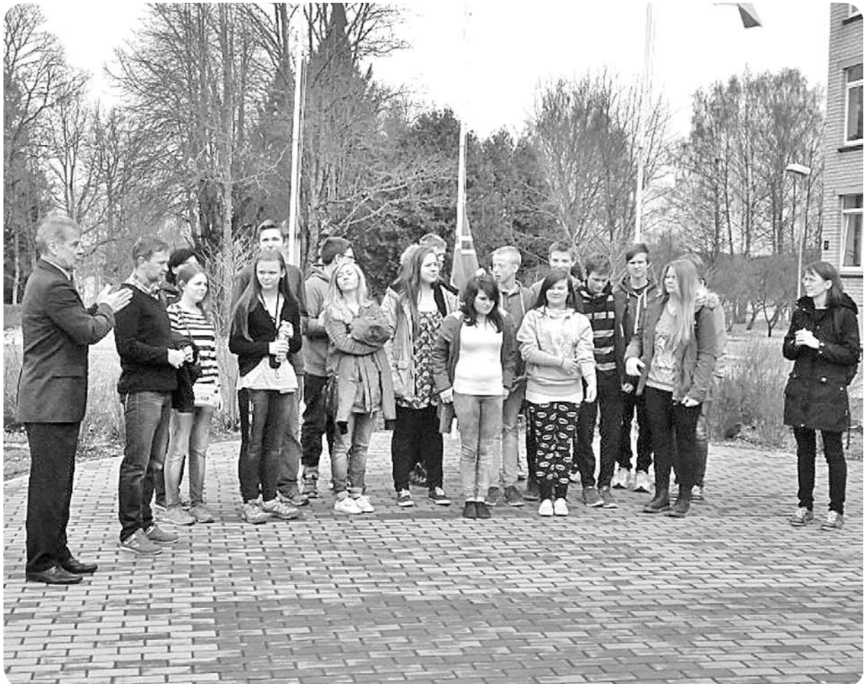
Sagaidot norvēģus, skolas pagalmā svinīgi tika uzvilkti Norvēģijas valsts karogs.

Laikā no 5. līdz 10. aprīlim Ļaudonā viesojās skolēnu un skolotāju delegācija no Norvēģijas - Mouldes kristīgās skolas. A. Eglīša Ļaudonas vidusskola laipni uzņēma jauniešus, izmītinot viņus internāta telpās un piedāvājot iespēju tikt ar skolēniem. Viesu delegācijas grupa no Ļaudonas aizbrauca ar prieku piepildītu sirdi, viņus patiesi aizkustināja ļaudoniešu atvērtība un viesmīlība. Plašāk lasiet par norvēģu viesiem avīzes 4. lpp.