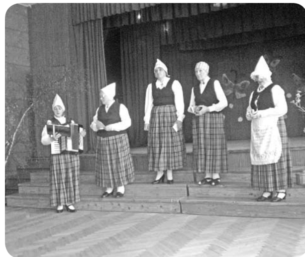
Meirānu TN tradīciju kopa “Sietiņš”.