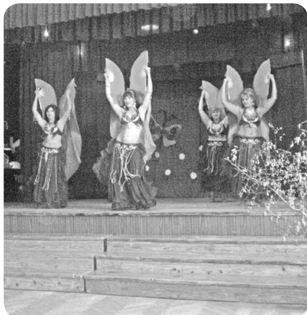
Ar krāšņām dejām priecēja vēderdeju grupa „Oreo” no Bērzaunes.