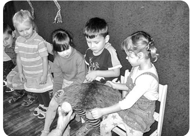
Kāds droši, kāds ne tik droši - tomēr iespēja pataustīt zvēru ādas bērniem atklāja jaunu pasauli.