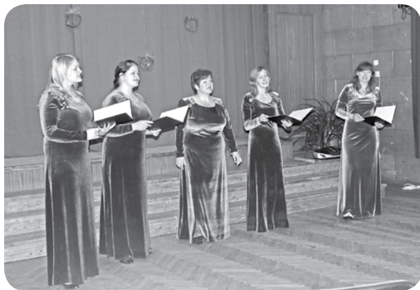
Ansamblis „Stari” priecēja ar sirsnīgām dziesmām.

zied!” tā saka pašas dziedātājas, jo dziedāšana paceļ augstāk par ikdienas darbiem un steigu, liekot aizmirst par problēmām, kuras uzrodas neaicinātas, bet dziedot tās izplēn un izkūst dziesmā.