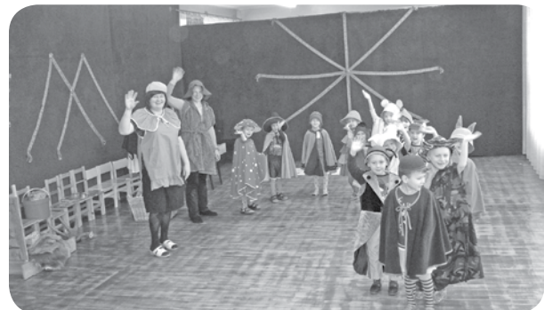
Bērni ar aizrautību pārtapa dažādos pasaku tēlos.