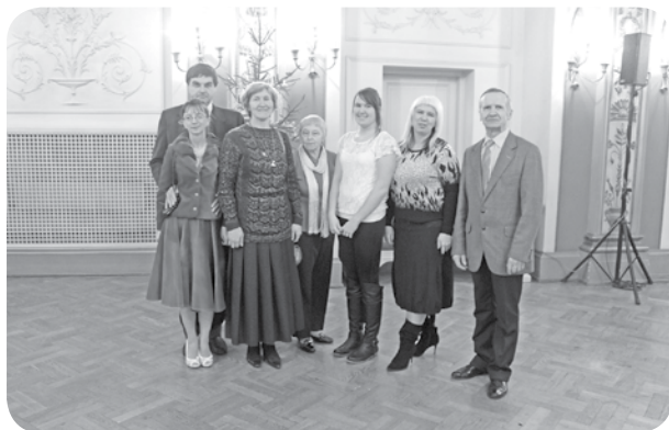
Ļaudonieši pēc koncerta Rīgas Latviešu biedrības namā.