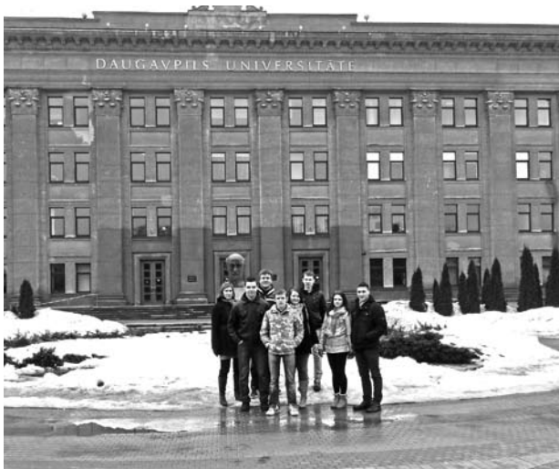
11. klases skolēni pie Daugavpils Universitātes.

2013. gada 13. aprīlī Andreja Eglīša Ļaudonas vidusskolas 11.klases audzēkņi brauca ekskursijā uz Daugavpili. Tā bija balva par iegūto pirmo vietu konkursā “Labākā klase” I mācību pusgadā. Paldies Ļaudonas pagasta pārvaldei un skolas vadībai par šo iespēju.