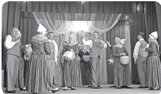
Ļaudonas pagasta senioru deju kolektīvs „Divi krasti” deļā „Simjūdu tirgus”.