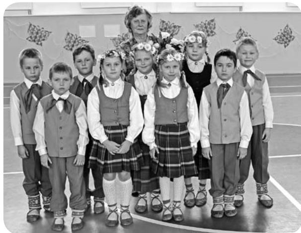
Andreja Eglīša Ļaudonas vidusskolas 1. – 2. klases tautisko deju kolektīvs.