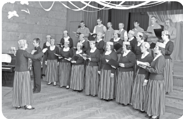
Ļaudonas pagasta jauktais koris „Lai top!”.