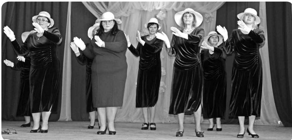
Ļaudonas dāmu deju grupa atklāj koncertu ar deju „Tikšanās”.