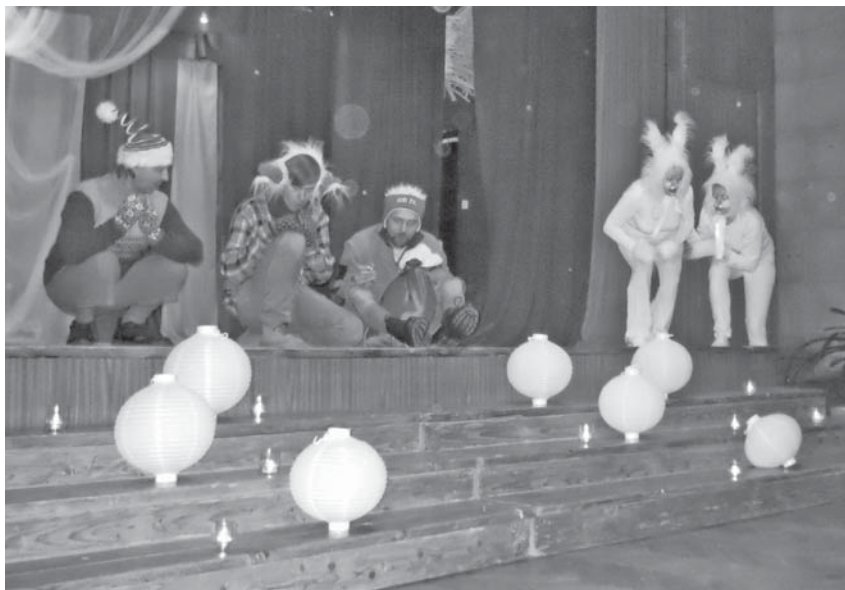
Mirkļis no teātra izrādes.