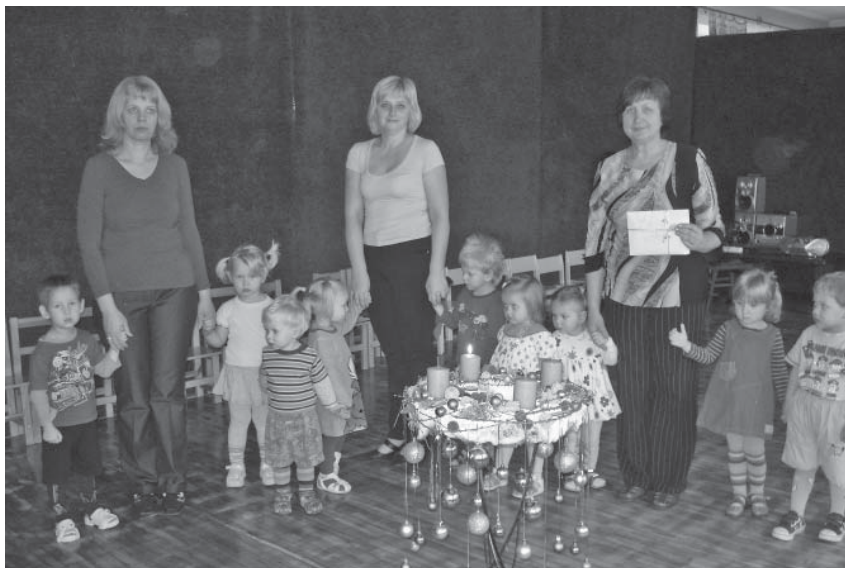
"Zaķu" grupa kopā ar audzinātājām pie "Brīnumdārza" Adventes vainaga.

Otrajā sveces iedegšanas reizē mūs apciemoja rūķis Jautrulis. Viņš spēlēja ģitāru un dziedāja Ziemassvētku dziesmas. Gāja ar bērniem rotaļās. Vi-