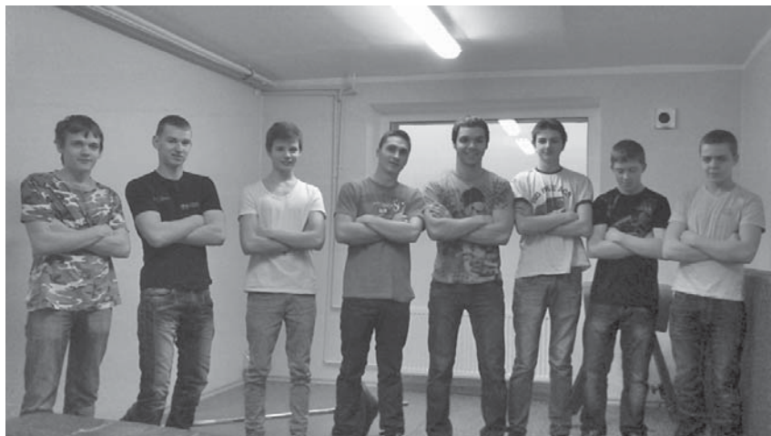
A. Eglīša Laudonas vidusskolas skolēni, kas nodarbojas ar atlētisko vingrošanu.

Veiksmīgam rezultātam nepieciešams visu mūsu atbalsts, tādēļ esiet