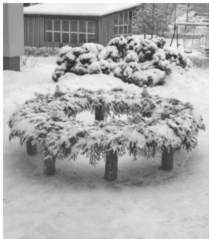
Liels Adventes vainags "Brīnumdārza" pagalmā.

ņa dotais uzdevums bija iemācīties dziesmu par eglīti un izcept svētkiem pi-parkūkas.