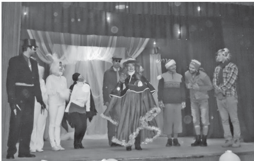
Feja ikvienu aicina vērot Ziemassvētku brīnumu – egles izgaismošanos lampiņu gaismās.