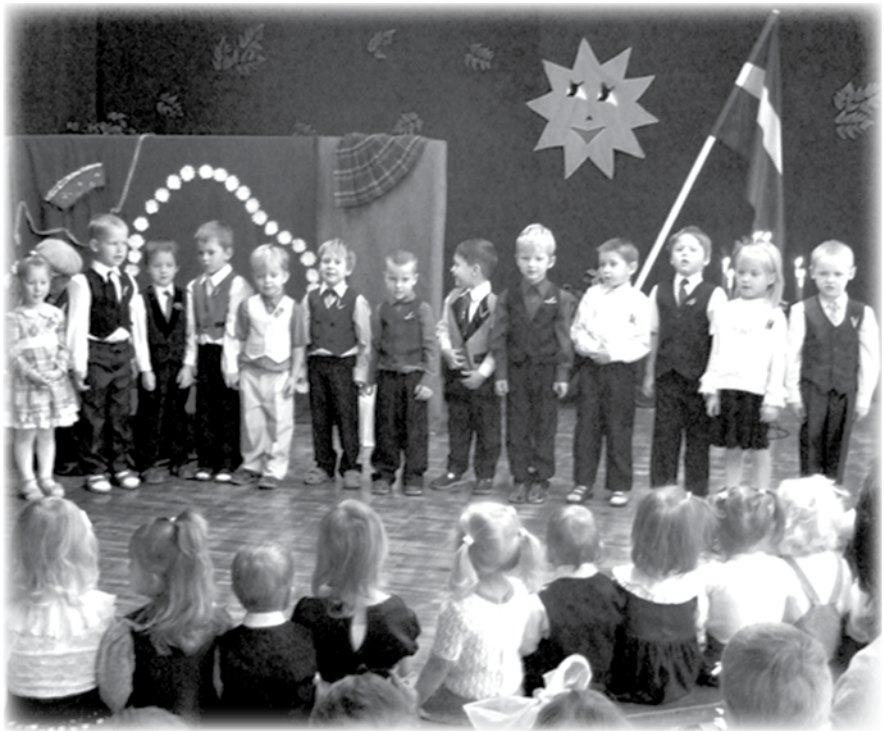
Dzied „Brīnumdārza” Rūķu grupa.