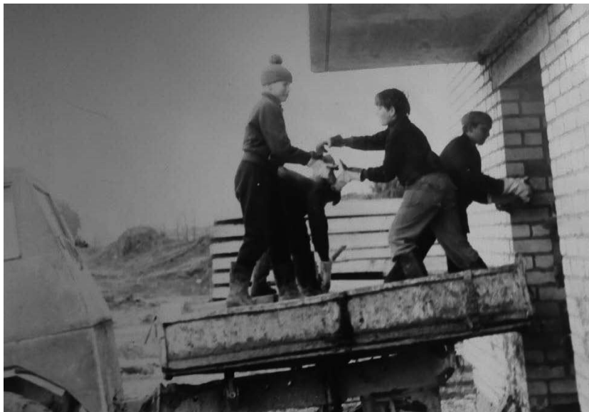
kā rūtēja skolas celtniecības darbi.

Lielākā problēma bija basketbola grozi – vajadzēja gūt priekšstatu par tiem no skolām, kurās jau bija šādi basketbola grozi ar organiskā stikla vairogiem. Tāda izrādījās Madlienas vidusskola, celta pēc tāda paša projek-