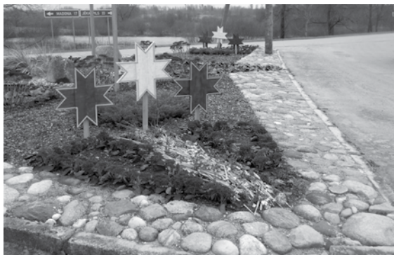
Ceļu krustojuma svētku noformējums – ausekļi.