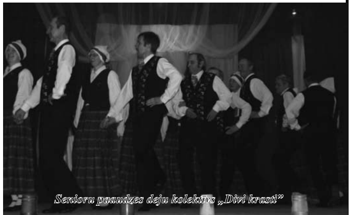
Senioru paaudzes deju kolektīvs „Divi krasti”

Paldies arī mākslinieciskajiem kolektīviem, kas sniedza skaistus priekšnesumus, un ļaudoniešiem, kas apmeklēja pasākumu, lai Latvijas 94. dzimšanas dienu varam atzīmēt visi kopā!