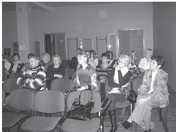
Skolotāji izglītojošo kursu laikā.

Janvāra sākumā tradicionāli 1.-12.kl. skolēni veido dzimšanas dienu kalendāru,