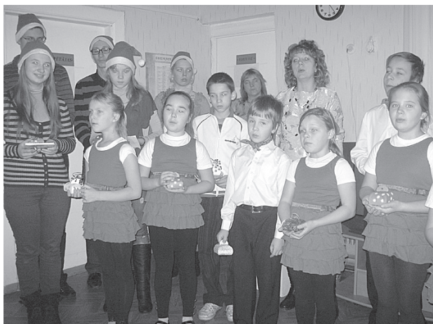
Skolēni viesojas pansionātā.

Skolotāji savukārt ziemas brīvdienās izglītoja kursus, kuri bija noorganizēti mūsu skolā. Piedalījās skolotāji no vairākām mūsu novada skolām, kursu tēma – "Mūsdienu radītie izaicinājumi un risinājumi bērnu un pusaudžu audzināšanā".