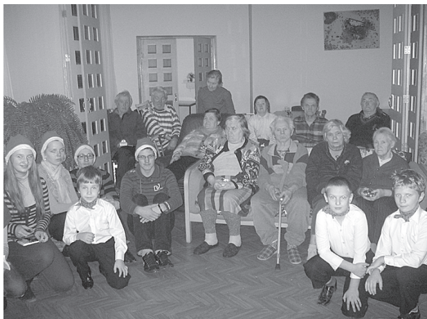
Bērni kopā ar sirmgalvjiem.