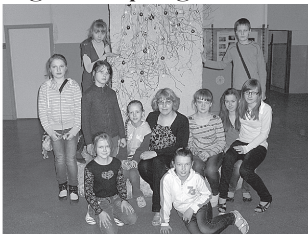
Floristikas pulciņa dalībnieki kopā ar vadītāju.

Plašāku vizuālu ieskatu pulciņa paveiktajā varat gūt Ļaudonas mājas lapas vidusskolas sadaļā – galerijas. Daļu no bildēm esmu ielikusi savās draugu galerijās, lai