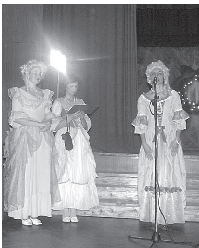
Ļaudonas pagasta galma dāmas.

Vasarā Ļaudona uzņēma Madonas novada pašvaldības darbiniekus, organizējot sporta spēles. Un nu ziemā novada pagastu pašvaldības darbinieki atkal pulcējās Ļaudonā, lai kopīgi nosvinētu 2011. gadā paveiktos darbus, sasniegtos mērķus un domātu par jaunu mērķu piepildījumu Jaunajā – Melnā pūķa – gadā!