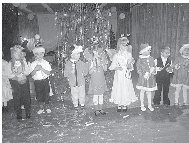
“Kaķu” grupa Ziemassvētku karnevālā.