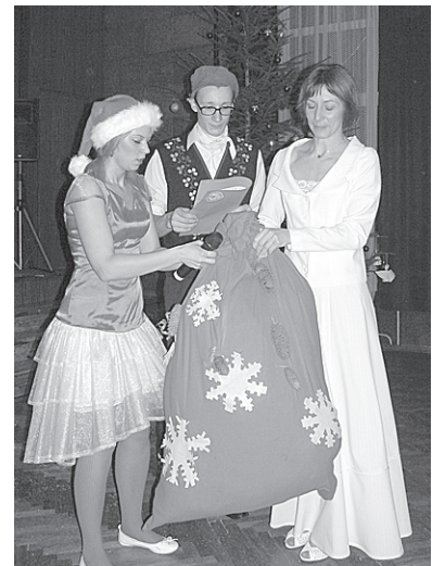
Rūķa lielais dāvanu maiss pagasta pārvaldei.