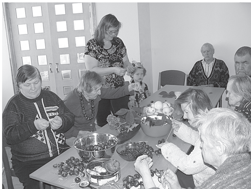
Pansionāta iemītnieki no dabas veltēm gatavo krelles.