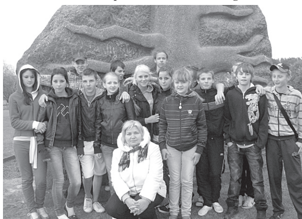
8. klases skolēni kopā ar audzinātāju Liepsalās.