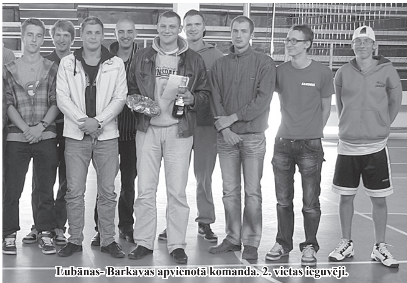
Lubānas-Barkavas apvienotā komanda 2. vietas ieguvēji.