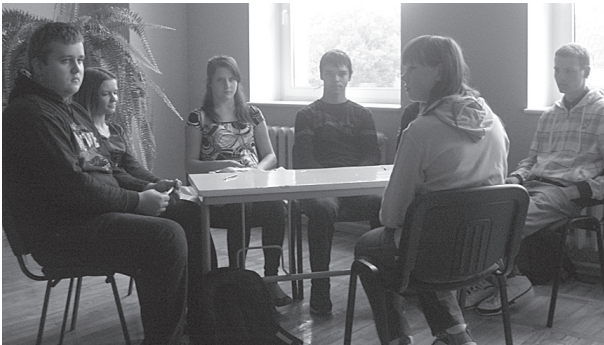
Konkursā 10. klases skolēni.

ļoti patika, jo vēlreiz tika apliecināti vārdi, ka mūsu skolā ir talantīgi skolēni.