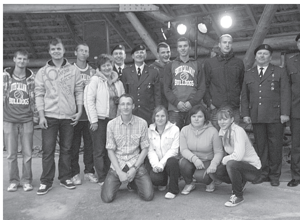
12. klases skolēni kopā ar Dobeles zemessargu ansambli.

Šajā dienā skolā notika tradicionālais starpklašu kon-