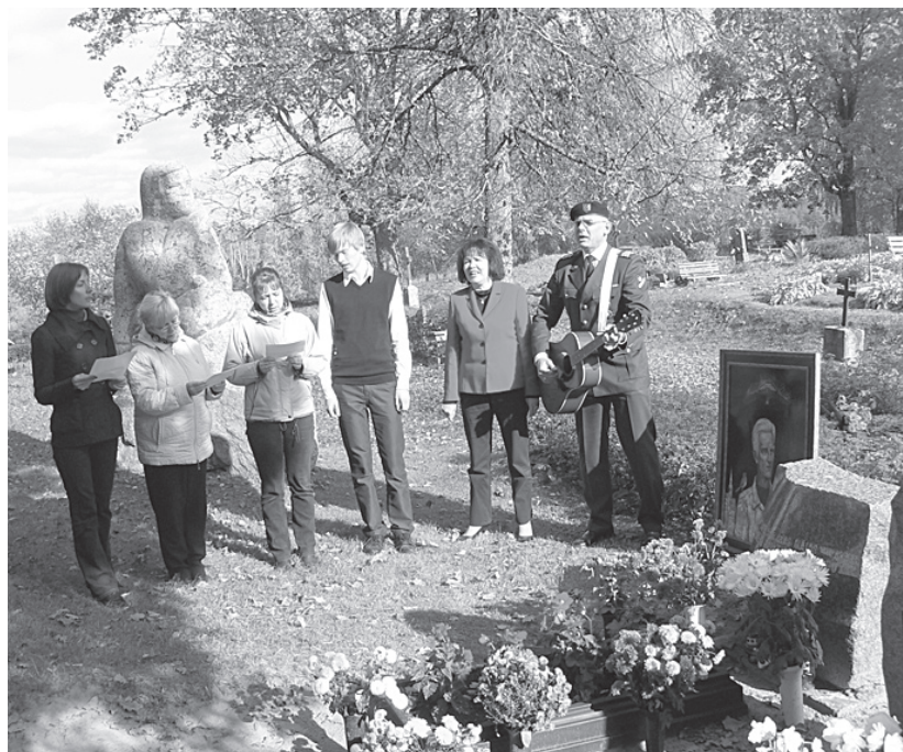
Pie dzejnieka kapa.