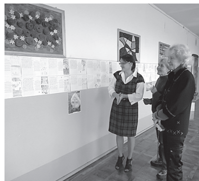
Fonda pārstāvji iepazīstas ar skolēnu darbiem tematiskajā konkursā par A. Eglīša dzejoli "Ļaudonai".