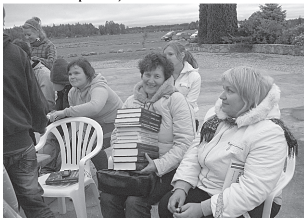
Dāvanā grāmatas skolas bibliotēkai.