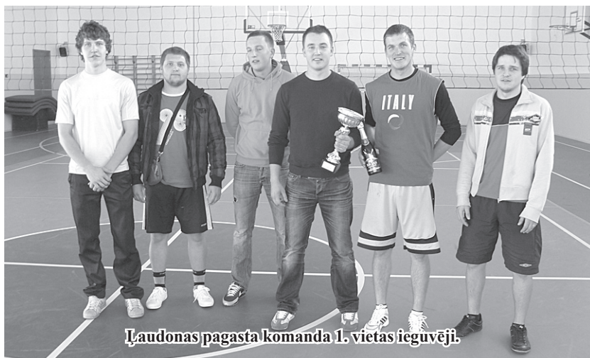
Ļaudonas pagasta komanda 1. vietas ieguvēji.