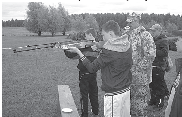
Trāpīt mērķi cenšas zēni no 8. klases.