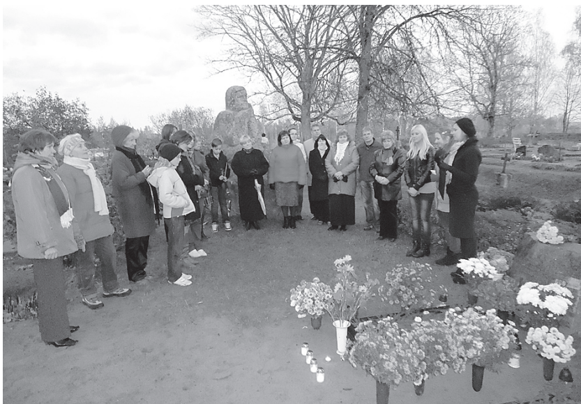
Piemiņas pasākums dzejnieka atdusas vietā.