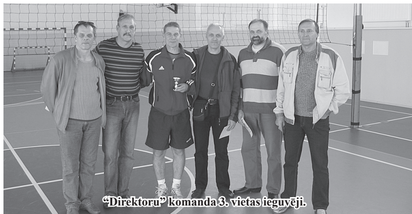
"Direktoru" komanda 3. vietas ieguvēji.