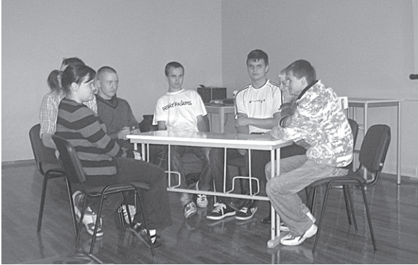
12. klases skolēni "Eiropas valodu dienas" konkursa laikā.

Skolā, protams, svinējām arī Skolotāju dienu. Divpadsmitās klases skolēni bija sagatavojuši ļoti jauku apsveikuma koncertu, kuru sniedza 1.-11.kl. skolēni, tika gan dziedāts, gan spēlēts, lasīta pašsacerētā dzeja, gan stāstītas anekdotes, gan runāti apsveikuma dzejoļi. Milzīgs Paldies visiem šī koncerta dalībniekiem un vadītājiem! Tik tiešām pasākums bija izdevies, un skolotājiem