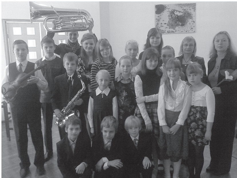
Jāņa Norviļa Madonas mūzikas skolas audzēkņi un skolotāji.

vidusskolas bērni ar koncertiņu un pašu darinātām dāvaniņām. Paldies skolotājām par ieguldīto darbu!