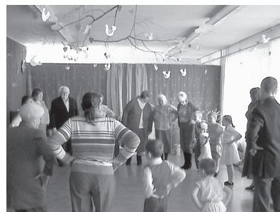
...un arī rotaļās.