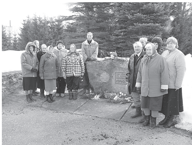
Ļaudonas pagasta politiski represētie pie piemiņas akmens.