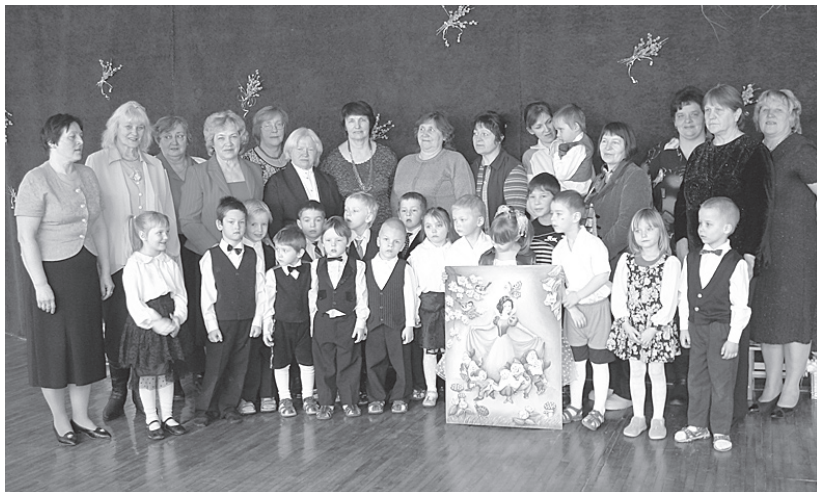
Vecvecāki kopā ar mazbērniem...