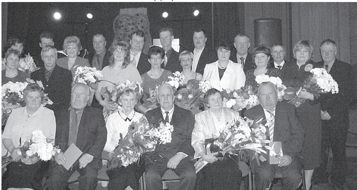
Ģimeņu vakara dalībnieki.

Patiess prieks par pāriem, kuri sagaidīs Zelta kāzas, svinot kopā nodzīvotus, piedzīvotus un pārdzīvotus 50 gadus.