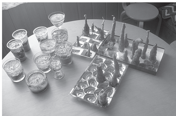
Jauniešu gatavotās svecēs.