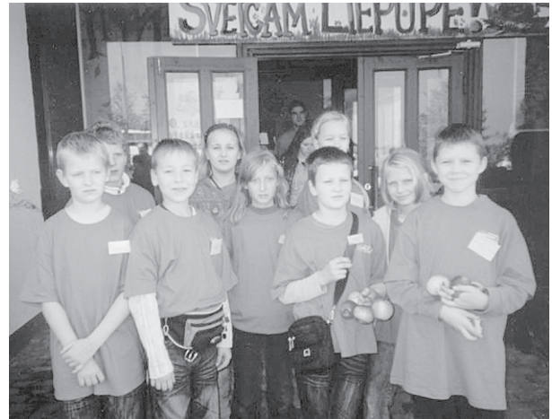
Ļaudonas 117. mazpulka dalībnieki Vidzemes novada forumā Liepupes vidusskolā.