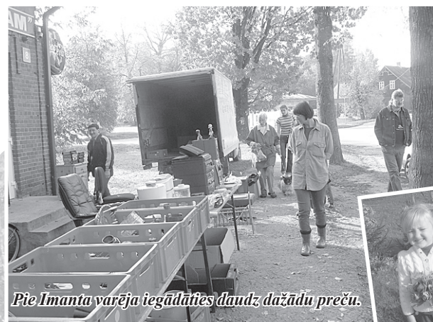
Pie Imanta varēja iegādāties daudz dažādu preču.