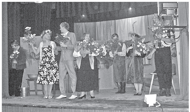
Kalšnavas aktieru kolektīvs.

Bet ko gan lai saka par 8. oktobra pasākumu? Vai tiešām pie vainas bija nelielā ieejas maksa, vai arī ļaudoniešiem nepatīk dzeja un mūzika?