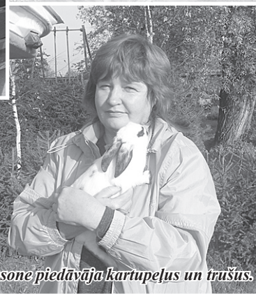
D. Simšone piedāvāja kartupeļus un trušus.