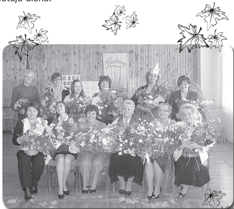
Laudonas vidusskolas skolotāji.

2. oktobrī ievēlējām 10. Saeimu. Oktobra pirmajā svētdienā, 3. oktobrī, suminājām mūsu skolotājus Sko- lotāju dienā.