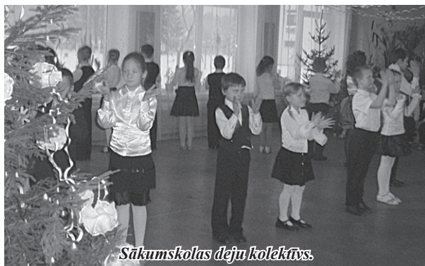
Sākumskolas deju kolektīvs.