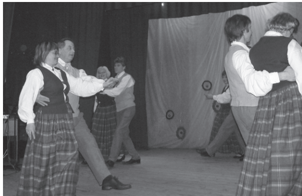
Vidējās paaudzes deju kolektīvs.

Labie vārdi ir kā bites stropā. Izlidojot labus darbus krāj, satur mūsu atšķirības kopā, ceļus, takas meklēt nepārstāj. Labie vārdi ir kā auglīgs lietus. Dziļi slēptām sēklām dzīvību spēj dot, veldzē tikko uzdīgušus dzietus, pāri siltumu un gaismu starojot. Labie vārdi – kaut to nepietrūktu, dzīves nedienas kad plecus lejup spiež! Mazāk būtu brīžu sūri grūti, smaida tauriņš atlidotu biežs.