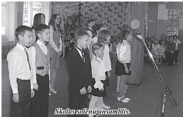
Skolas solēņu ansamblis.