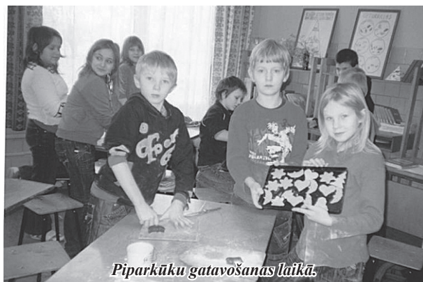
Piparkūku gatavošanas laikā.