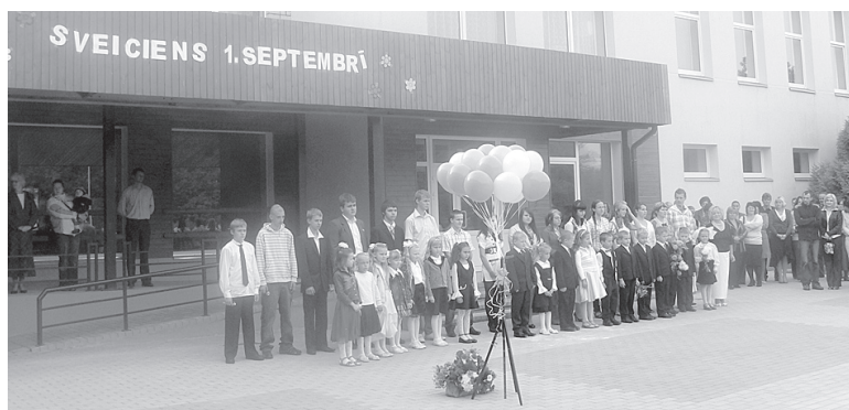
1. septembra svinīgajā pasākumā vidusskolas pagalmā.