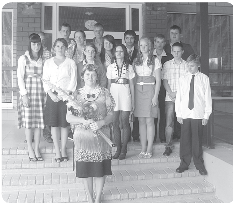
Ļaudonas vidusskolas 9. klase.

Atcerēsīties, ka 2.oktobrī katram no mums jāizpilda savs pilsoņa pienākums un jādodas pie vēlēšanu urnām.