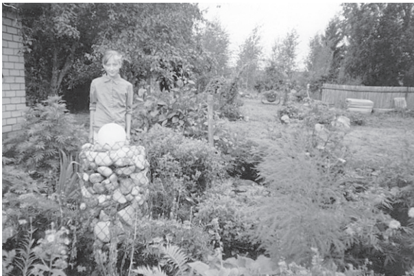
Diāna Podniece pie sava puķu dārza.