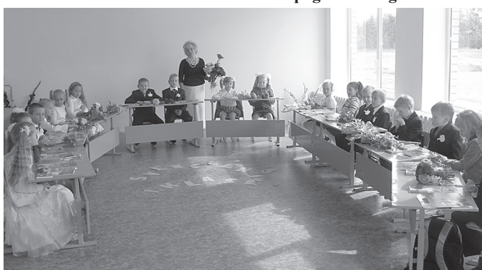
1. klases skolēni ar audzinātāju atremontētajā klasē.

Mairitai Ducenai par skolas apkārtnes apzaļumošanu.