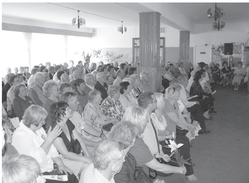
Vidusskolas absolventi, salidojuma dalībnieki.