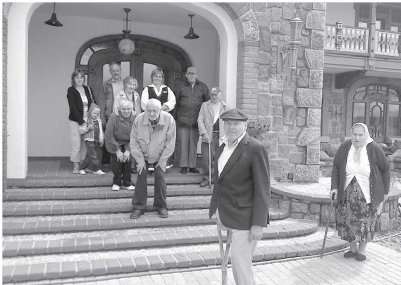
SAC iemītnieki Ķirsona muižā.

Jūnijs ir arī saulgriežu mēnesis, kad visi Jāņi un Līgas svin savus svētkus.