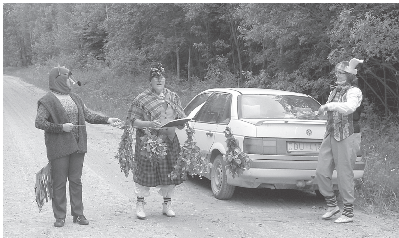
Ar teatralizētu uzvedumu lauku konsultantus sagaidīja mētrēnieši pie sava pagasta robežas.