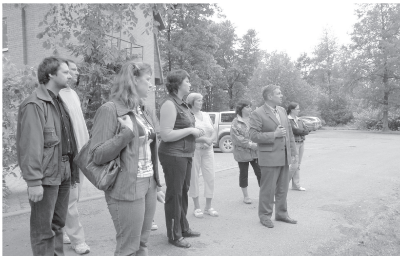
Teiču dabas rezervātā.