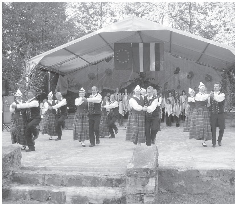
Trapenes Mazajos dziesmu un deju svētkos, deju ļaudonieši.

5. jūnijā Ļaudonas kultūras nama vidējās paaudzes deju kolektīvs piedalījās Apes novada Trapenes pagasta Mazajos dziesmu un deju svētkos. Šis bija kolektīva pirmais izbraukums ārpus bijušā rajona robežām. Aizbraucot izmēģinājām Trapenes estrādes skatuvi. Pēc tam viesu kolektīviem Trapenes kultūras nama dziedātāji sniedza koncertu kultūras namā. Pēc koncerta sākām pokies svētku gājienam. Gājiens notika no pašvaldības ēkas uz estrādi, kājas ritmā palīdzēja cilāt pūtēju orķestris. Estrādē notika plašs vietējo pašdarbnieku un viesu kolektīvu koncerts. Piedalījās Ozolnieku vidusskolas jauktais koris, Trapenes-Sikšņu pamatskolas koris, Kārsavas kultūras nama sieviešu vokālais ansamblis "Saulesprieks", līnijdeju grupas no Virešiem un Gaujienas "Sten up", Kalsnavas dāmu deju grupa "Magnolija", Cēsu kultūras centra vecākās paaudzes deju kolektīvs "Dzirnas", Trapenes kultūras nama dziedošie kolektīvi "Cālēni", "Skabargas", "Twister", "Ilūzija", Trapenes kultūras nama senioru deju kolektīvs "Bormanītes", Apes tautas nama pūtēju orķestris un viesi no Igaunijas-Lahedas deju kolektīvs, Lahedas jauktais koris un Parksepas pūtēju orķestris. Šie svētki Trapenē notiek jau