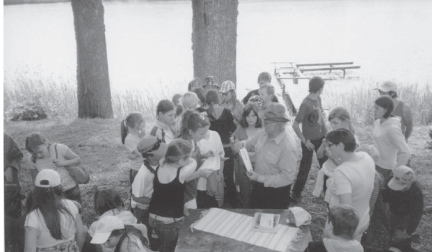
Zemnieku saimniecība "Zemnieki".