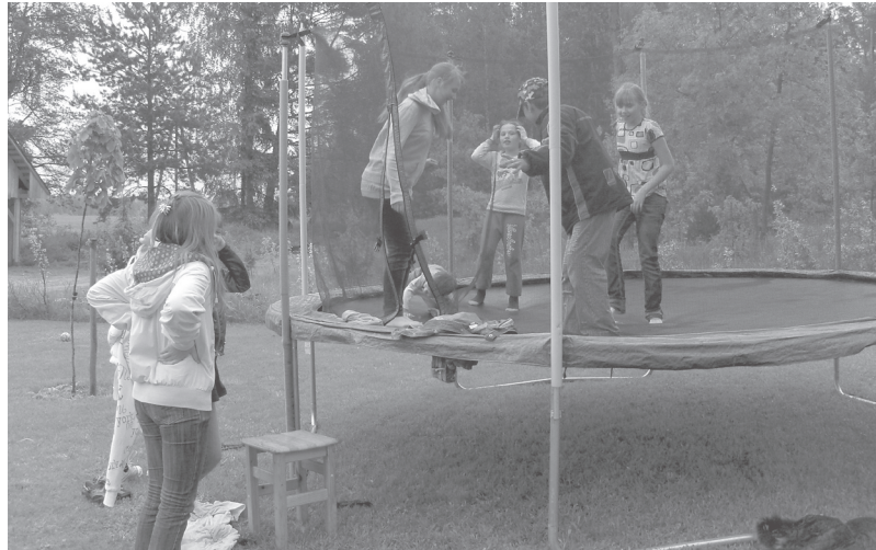
Bērni uz Ducenu ģimenes lielā batuta.

Bet atgriežoties pie 25. maija. Jāpastāsta arī tas, ka bērniem ļoti patika Ducenu ģimenes lielais batuts. Lai arī stipri lija lietūs, bija auksts, visi slapji –