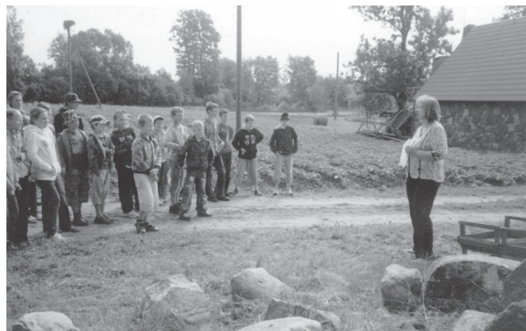
Zemnieku saimniecība "Pasilis".