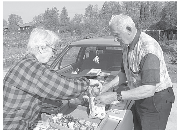
Kalsnaviešu Liepiņu ģimene piedāvāja iegādāties dažādu pupiņu sēklas.