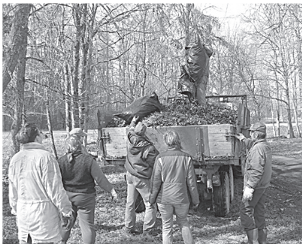
SAC un pagasta pārvaldes darbinieki talkoja parkā.