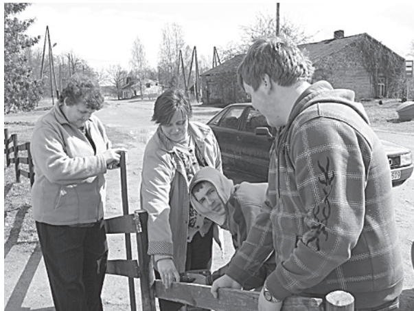
Jaunieši un darbinieki pie Jauniešu iniciatīvu centra.