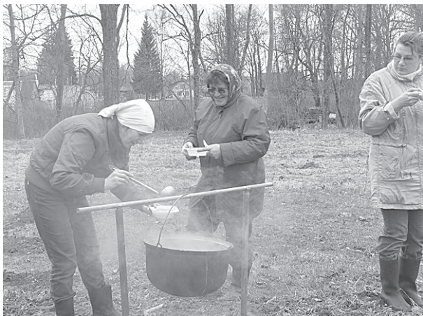
Pusdienas no lielā zupas katla.