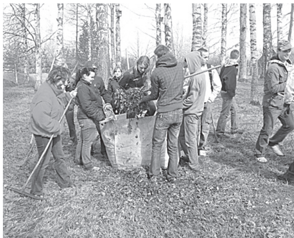
10. klases skolēni talko skolas parkā.