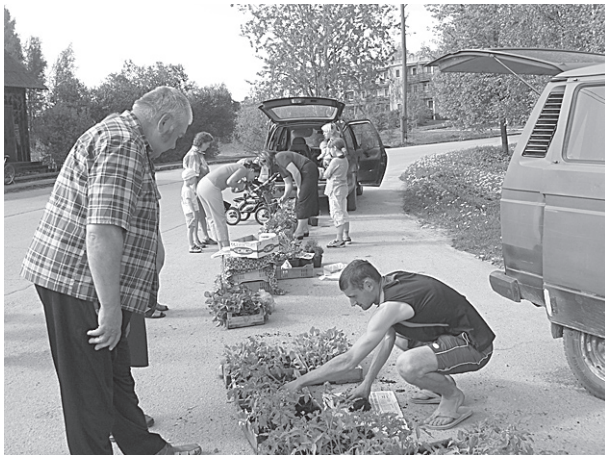
Tirgotāji piedāvā puķu stādus.

16. maijā laukumā pie „Dīvaru” veikla notika pavasara tirdziņš. Tirdziņā varējām iegādāties sēklas karstupeļus, dažādus stādus, tai skaitā arī ābeles, plūmes, ogulājus un mājās gatavotu alu.