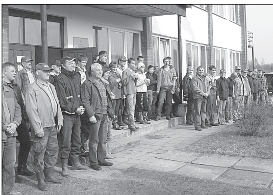
Talcinieki pie pārvaldes ēkas.

Šogad pēc astoņu gada pārtraukumu mūsu pagastā 30. aprīlī notika Meža dienu koku stādīšanas talka pagastam piederošajos īpašumos „Lapupurvs” un „Strīduspurvs”. Latvijas Republikas Neatkarības deklarācijas pieņemšanas 20. gadadienā Meža dienu pasākumi notika ar devīzi “Par zaļu un neatkarīgu Latviju!”. Talcinieki pulcējās pie pagasta pārvaldes ēkas. Talkā piedalījās Madonas novada pagastu un pilsētas pārvalžu vadītāji, Madonas virsmežniecības un Valsts meža dienesta darbinieki, Ļaudonas vidusskolas 10. klases skolēni un Mārcienas pamatskolas vides pulciņa skolēni.