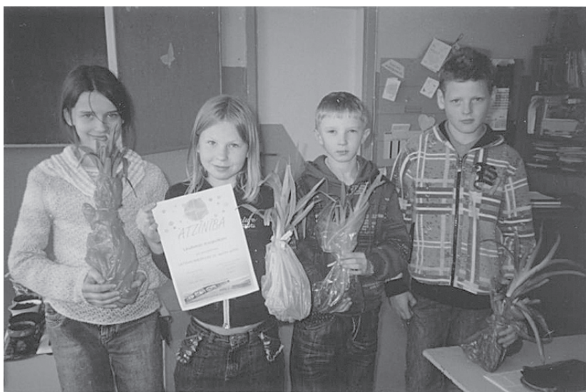
Ar saņemtajiem apbalvojumiem.