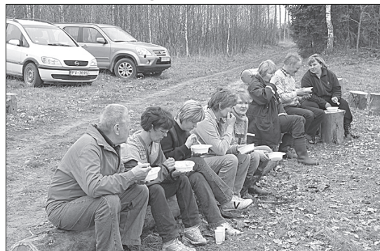
Pusdienas pēc padarītā darba.

4000 eglīšu talcīnieki sastādīja ātri un visi kopā pēc labi padarīta darba devās uz speciāli izveidoto atpūtas vietu, lai nobaudītu talcīniekiem īpaši pagatavotās pusdienas.