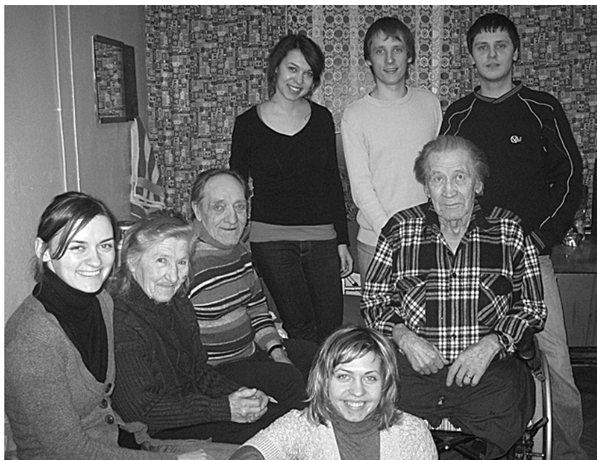
Jaunieši kopā ar sociālās aprūpes centra iemītniekiem.