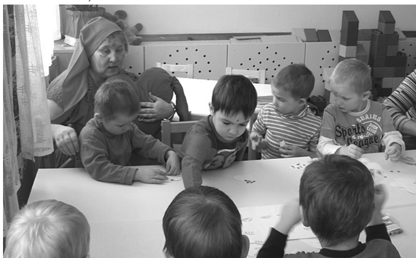
Rūķu darbnīcā bērni gatavo apsveikumus.

ceļojumā uz mīlestības pieturu. Bērni uzlika savas ceļojuma cepures, norunāja burvju vārdus, un piedzīvojums sākās. Pirmā pietura bija Valentīndienas izstāde iestādes foajē, kur mazie apskatīja skolēnu floristikas darbus un parakstījās viesu grāmatā.