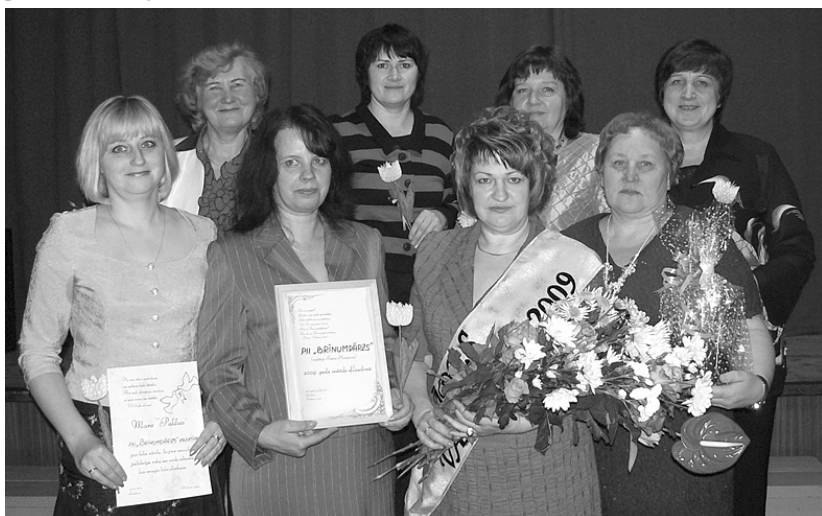
PII "Brīnumdārzs" pārstāves.

Nominācijai pieteiktas 9 pagasta iestādes, visvairāk balsis ieguvusi pagasta pirmsskolas izglītības iestāde "BRĪNUMDĀRZS"