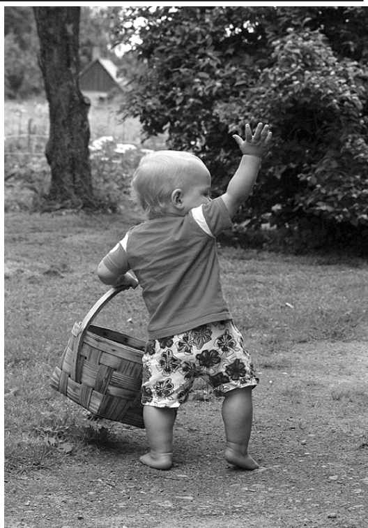
"Eju bekot."