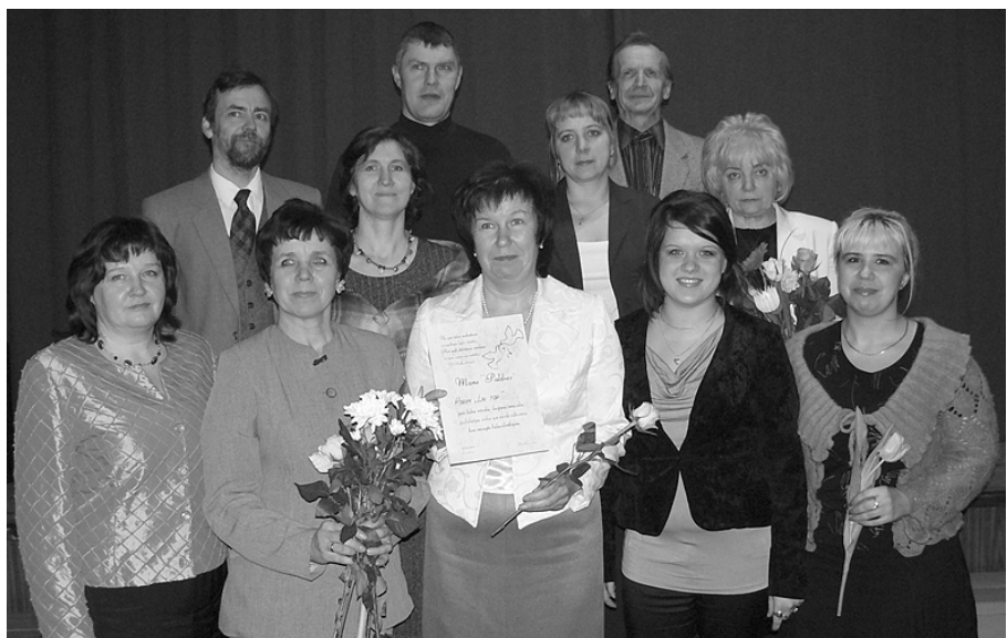
Kora “Lai top!” pārstāvji.