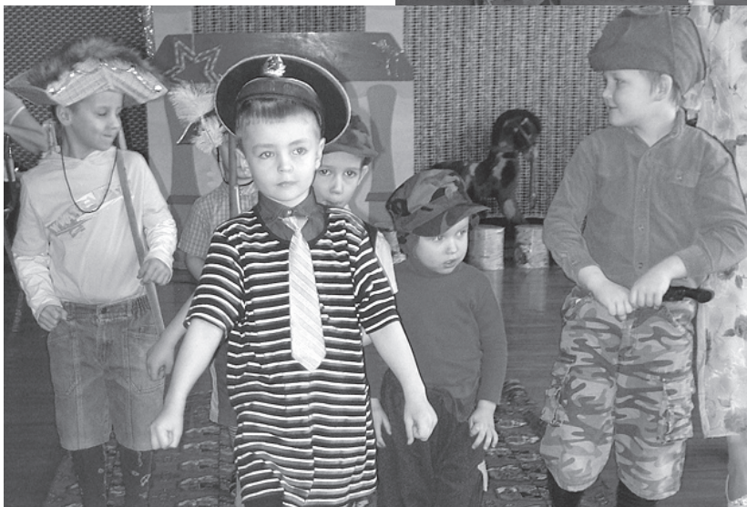
Kapteinis Džeks (Matiss) un pirāti.