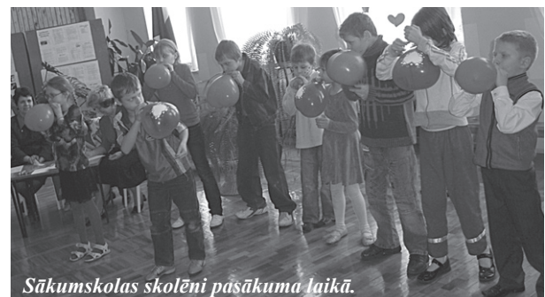
Sākumskolas skolēni pasākuma laikā.

Pāriem bija jāveic dažādi uzdevumi: jāsakārto tautasdziesmu teksti secībā, jāuzraksta pēc iespējas vairāk mīļvārdu un jāveido frizūras: meitenēm zēniem un otrādi.