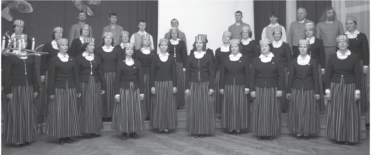
Koris "Lai top!"