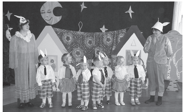
„Zaķu” grupas bērni.