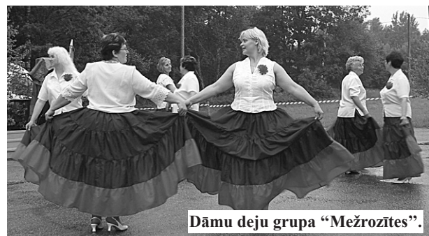
Dāmu deju grupa "Mežrozītes".