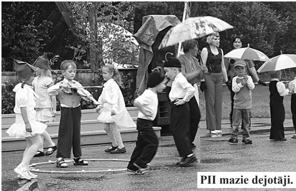
PII mazie dejojāji.