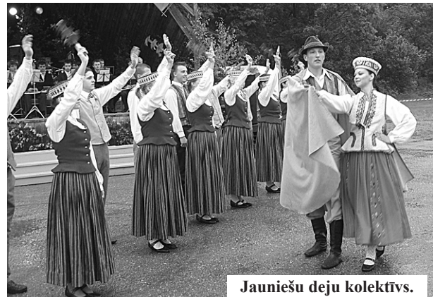
Jauniešu deju kolektīvs.