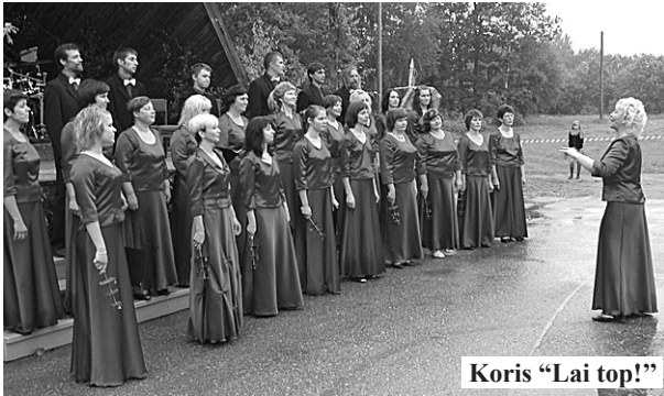
Koris "Lai top!"