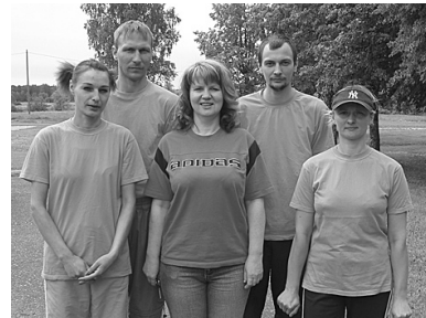
SIA "Ausmupe" komanda.