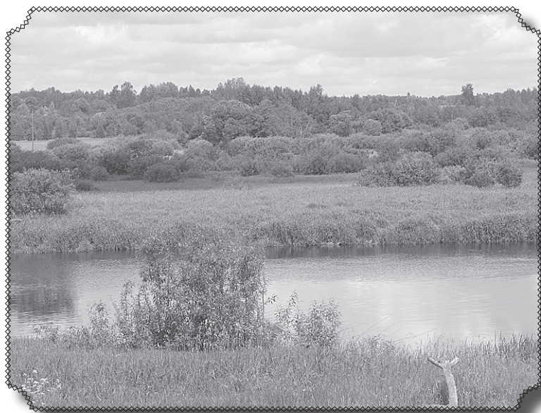
Aiviekste palienu plāvā.

Jūlijs ir pats labākais laiks, lai ievāktu visu, kas zaļo un zied virs zemes: ogas, sēnes, tējas zāles. Iziesim dabā un savāksim tās veltes, lai papildītu savus krājumus ziemai. Atpūtīsimies pie dabas un uzkrāsim spēkus.