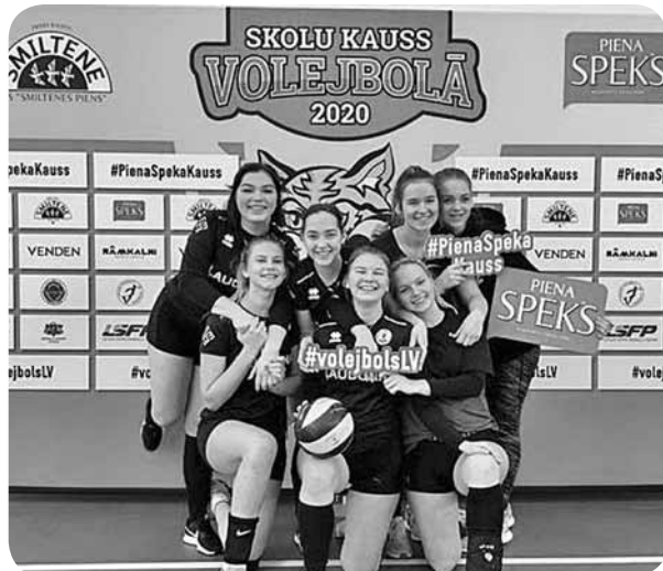
A. Eglīša Ļaudonas vidusskolas meiteņu komanda.

Arī starp zēnu komandām pirmo vietu ieguva Andreja Eglīša Ļaudonas vidusskolas komanda, uzvarot Lubānas vidusskolas komandu divos setos ar rezultātu 21:10 un 21:14. Madonas Valsts ģimnāzijas komandu Ļaudonas