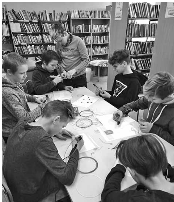
6. klases skolēnu radošā darbošanās ar 3D pildspalvām.