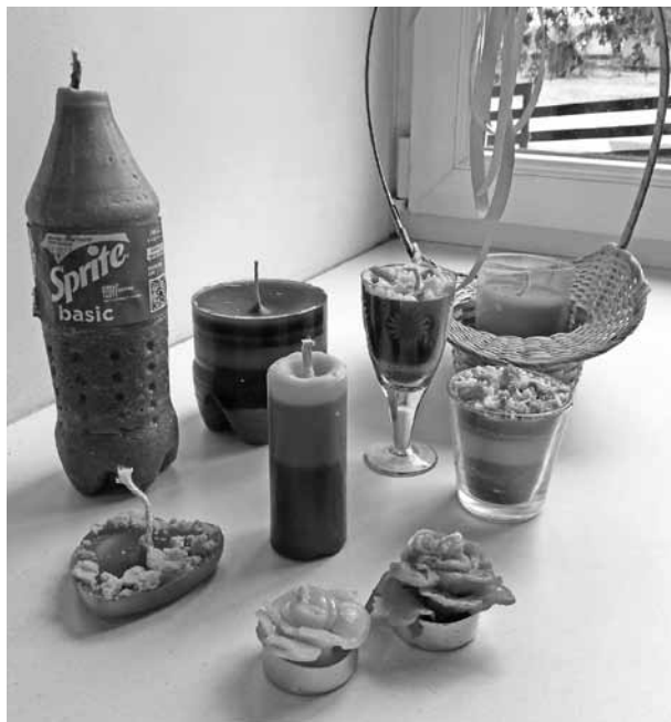
Daļa no bērnu gatavotajām svečm.

Katru otrdienu pie mums notiek dambretes pulciņš. Vai ir vēl kāds gribētājs? Ar prieku sagaidītu sākumskolas