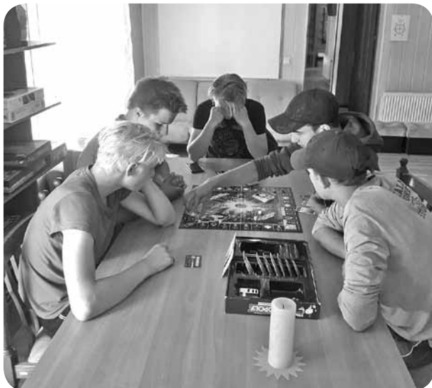
Ļaudonas zēni, spēlējot monopoli, kas pieejams jauniešu centrā.

sarūpējis vairākas izklaidējošas atrakcijas. Bērni varēja spēlēt lielformāta cirku, šķīvīšu mešanu uz punktiem un lielformāta domino. Gan mazos, gan lielos ļaudoniešus un Ļaudonas viesus aizrāva lielo burbuļu darbnīca. Burbuļoties gribētāji vēroja citus un mēģināja uztaisīt pēc iespējas lielāku, garāku gaisīgo brīnumu. Vislielāko atsaucību saņēmām par “Mans pieci Ļaudonai” aktivitāti. Katrs pagasta svētku viesis varēja atstāt savu krāsaino rokas nospiedumu, veidojot brīnišķīgu karogu Ļaudonai. Iznākums skaisti rotā jauniešu centra sienu, interesenti var nākt un atrast savu un savu draugu, kaimiņu rokas nospiedumus. Paldies kultūras nama vadītājam par tik skaistiem svētkiem, kas bija pilni ar dažādām aktivitātēm un darbošanos.