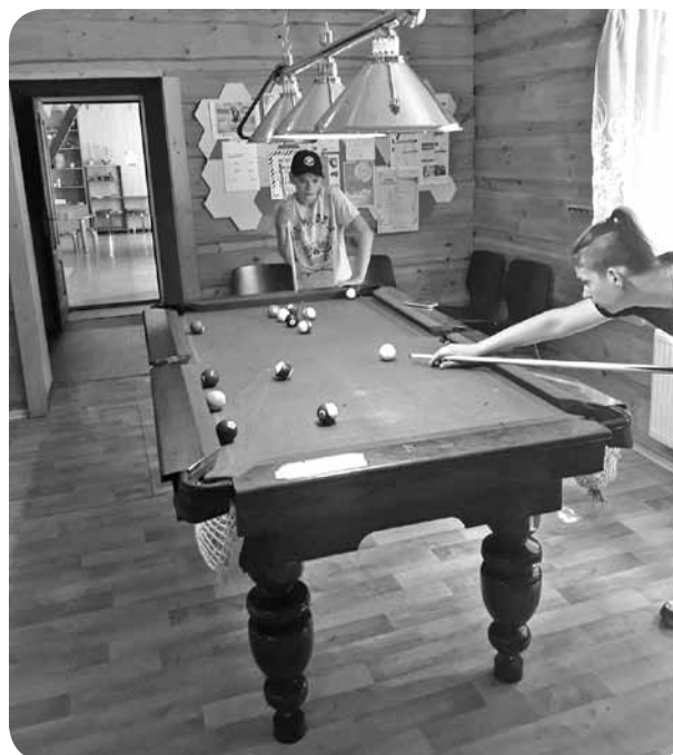
Aizrautīgā biljarda spēle.