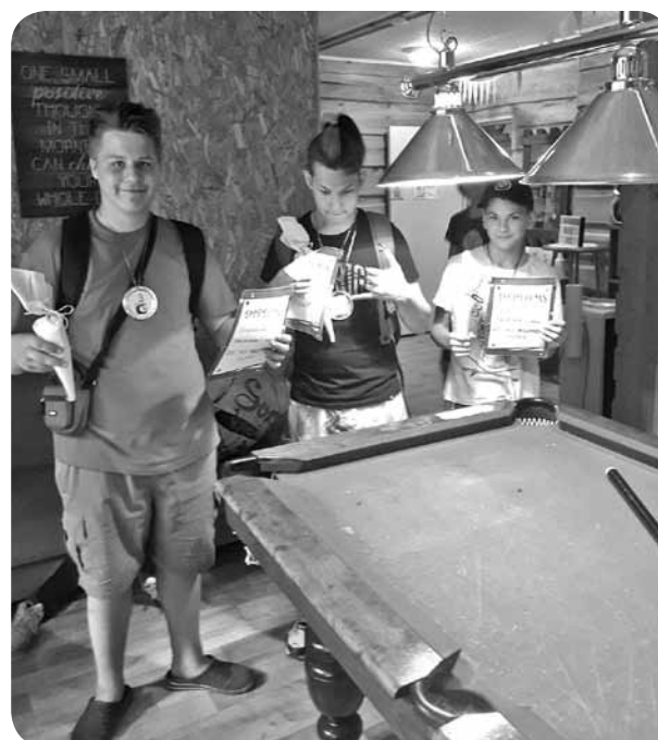
Saņemot godalgas pēc turnīra.