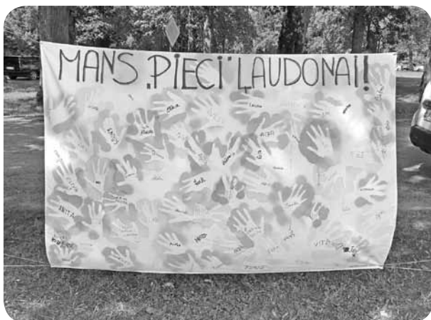
„Mans pieci Ļaudonai”.

sarūpējis vairākas izklaidējošas atrakcijas. Bērni varēja spēlēt lielformāta cirku, šķīvīšu mešanu uz punktiem un lielformāta domino. Gan mazos, gan lielos ļaudoniešus un Ļaudonas viesus aizrāva lielo burbuļu darbnīca. Burbuļoties gribētāji vēroja citus un mēģināja uztaisīt pēc iespējas lielāku, garāku gaisīgo brīnumu. Vislielāko atsaucību saņēmām par “Mans pieci Ļaudonai” aktivitāti. Katrs pagasta svētku viesis varēja atstāt savu krāsaino rokas nospiedumu, veidojot brīnišķīgu karogu Ļaudonai. Iznākums skaisti rotā jauniešu centra sienu, interesenti var nākt un atrast savu un savu draugu, kaimiņu rokas nospiedumus. Paldies kultūras nama vadītājam par tik skaistiem svētkiem, kas bija pilni ar dažādām aktivitātēm un darbošanos.