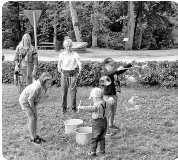
Ļaudonas pagasta svētkos. BJIC „Acs” aktivitātes maziem un lieliem.

Pirmais augusts atnāca ar Ļaudonas pagasta svētkiem, kurā piedalījāmies arī mēs! Visu dienu valdīja jautrība, cilvēku sarunas un bērnu smieklī. Jauniešu centrs bija