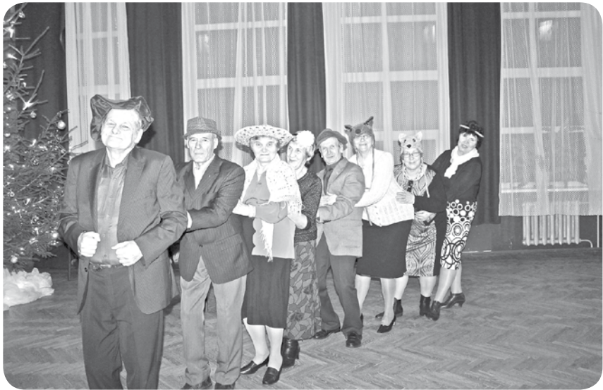
Jautrus brīžus sagādāja "Pasaka par rāceni", kur darbojošās personas bija paši pasākuma apmeklētāji.

6. janvārī uz svētku pēcpusdienu tika aicināta pagasta vecākā paaudze, lai kopā omulīgā kompānijā atskatītos uz aizejošo gadu un gūtu pozitīvas emocijas, jauno gadu uzsākot. Tika organizētas dažādas atrakcijas, lasīti horoskopi un laiks pavadīts sirsnīgās sarunās. Par muzikālo noformējumu rūpējās kapela "Meldiņš" no Lubānas, izpildot dziesmas, kas sirdij tuvas jau no jaunības dienām, un aicināt aicināja gan dziedāt, gan dejojot arī pasākuma apmeklētājus. Paldies ļaudoniešiem, kuri atnāca uz pasākumu! Cerams, ka aktīvo senioru pulciņš paliks arvien plašāks.