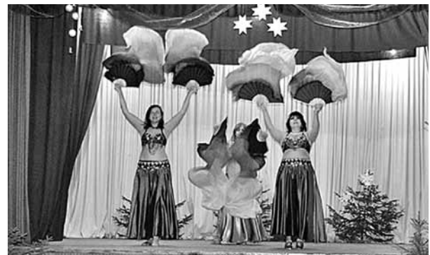
Ar krāšņiem priekšnesumiem priecēja eksotisko deju grupa "Oreo" no Sauleskalna.

Sākumā Nellijas sirdi aizkustinošā uzruna ar dzejas rindām un mūsu dziedātās dziesmas. Patīkami pārsteidza dāmu deju kopa "Mežrozīte" ne tikai ar interesanti veidotiem deju