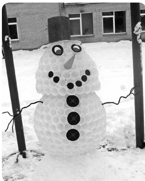
Sniega dienas dalībniekus sagaidīja īpašais sniegavīrs.