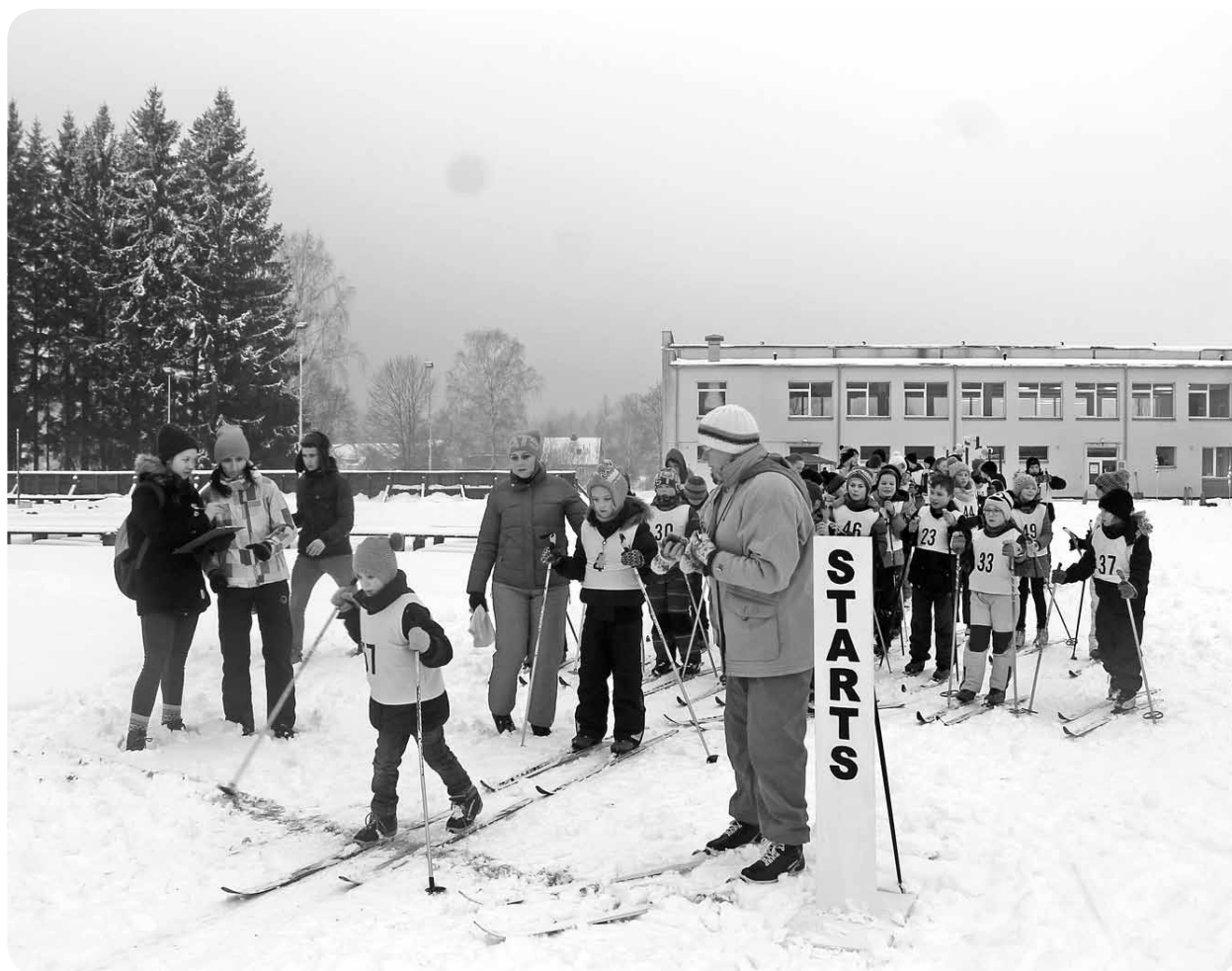
Pa vienam vien no starta līnijas trasē dodas vairāk nekā 60 slēpotāji.

14. janvārī, atzīmējot Vispasaules sniega dienu, Ļaudonā ikviens tika aicināts baudīt ziemas dienu. A. Eglīša Ļaudonas vidusskolas sporta laukumā, piedaloties dažādās sportiskās aktivitātēs.