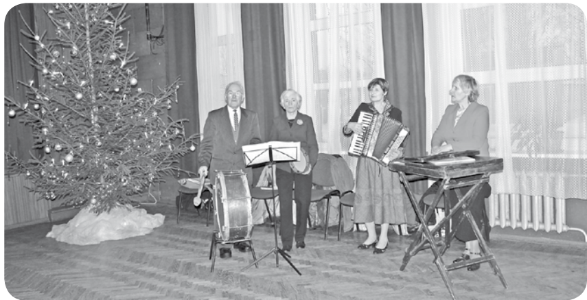
Muzicē lauku kapela "Meldiņš".