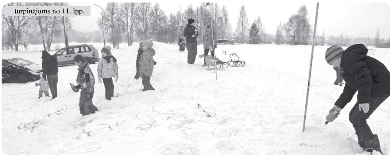
Baltā sniega sega ir vislabākais audekls bērnu radošajiem zīmējumiem.