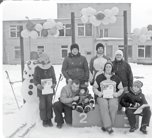
Veiksmīgākie jautrības stafetu dalībnieki.