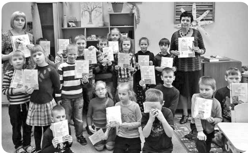
A.Eglīša Ļaudonas vidusskolas 1., 2., 3. klases skolēni, pateicoties savām skolotājām, aktīvi piedalījās lasīšanas konkursā, finālā saņemot pārsteiguma balviņas.

Tomēr gribu teikt, ka ir paveikts liels, ražīgs darbs - pusgada garumā lasīts, pārlasīts, pārdomāts, pārskatīts un galu galā izlasīts noteiktais grāmatu skaits. Grāmatas ir vērtētas un aizpildītas anketas. Pienācis arī patīkamais pateicību saņemšanas brīdis. Par ieguldīto