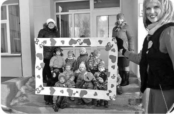
Sirsniņmeitene iepriecināja un patīkami pārsteidza bērnus gan bērnudārzā, gan skolā.