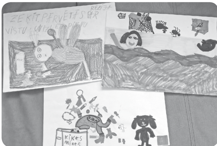
Rēzijas Grundmanes žūrijas grāmatiņu zīmējumi.

Paldies visiem lasīšanas maratona dalībniekiem - lieliem un maziem - par aktīvo piedalīšanos!