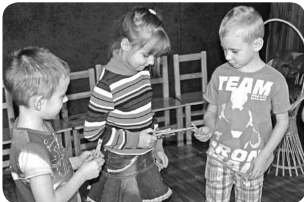
Bērni pilda Cūkmena doto uzdevumu, izmantojot tikai cūkas nagus (knaģus), - jāpadod aploksne.