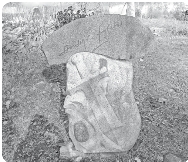
„Viscietāko akmeni esmu atradis beidzot - Tavu dvēseli, tur nezūdami iecirtīšos steidzot...”