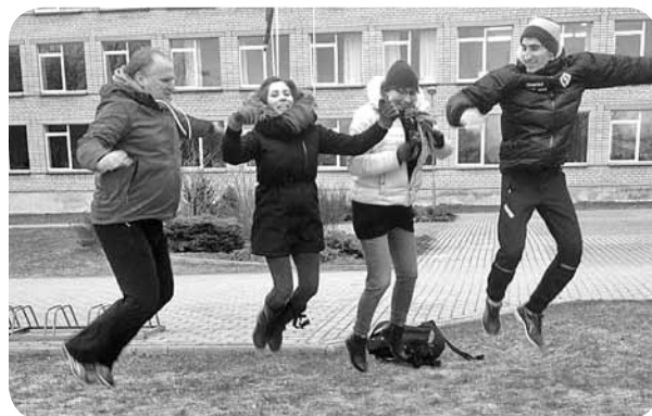
Kolēģu komanda, kuri tika „atstāti” Ļaudonā – lai nezināmā vietā izpildītu dažādus uzdevumus.

Sirsnīgs paldies ļaudoniešiem par mums sniegto atbalstu, bez kura mēs savu uzdevumu nebūtu izpildījuši. Vē-