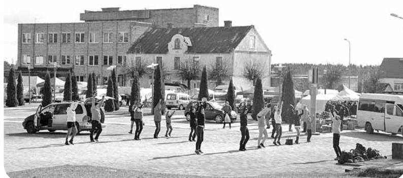
Viens no uzdevumiem – novadīt rīta vingrošanu Madonas pilsētas Saieta laukumā. Dalībniekiem par izbrīnu uzdevuma veikšana sakrita ar Lielā tirgus dienu.