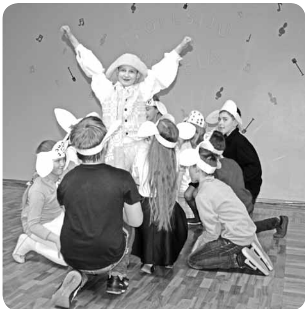
4.klase ar vizuāli interesantu priekšnesumu dziesmai „Vientulais ganiņš”.