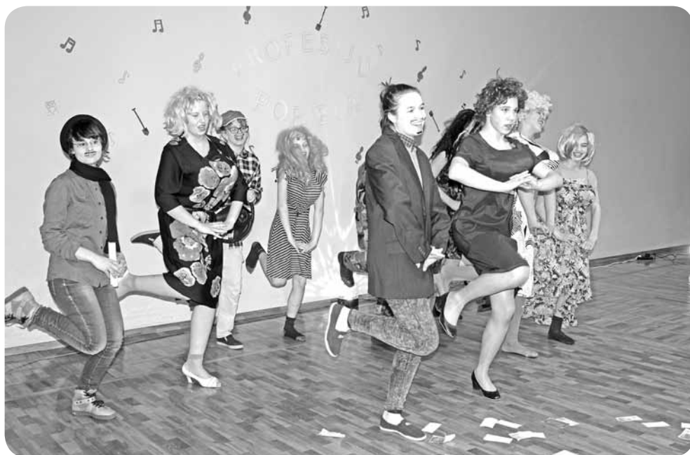
Īpašas skatītāju ovācija un atzīnību guva 7.klases skolnieki – atraktīvi attēlojot dziesmu „Seksuālie čiekuri”.

Mūsu klasei palaimējās izvilkt dziesmu “Mazais makšķernieks”. Šī dziesma nav no populārākajām, taču tas mums netraucēja. Mēs izdomājām dziesmu atdarināt gan teatrāli, gan ar deju soļiem. Mums ļoti patika gan skolasbiedru iznācieni, gan 10. klases skolēnu prasme vadīt pasākumu.”