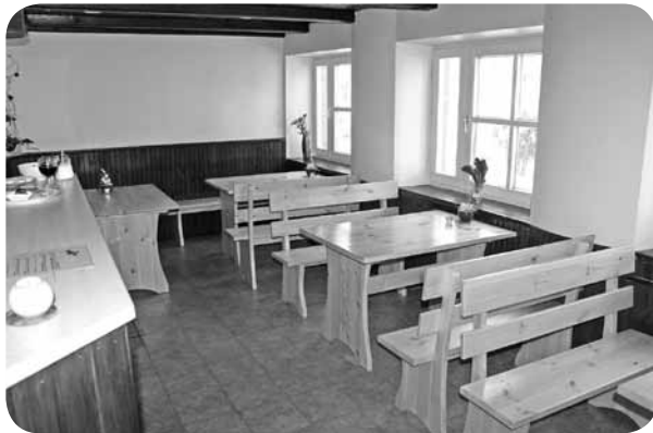
Kafejnīcā „Mokka” iespēja nesteidzīgi atpūsties gan ģimenēm ar bērniem, kad draugu kompānijai. Iespējams izmantot telpas arī privātiem pasākumiem.