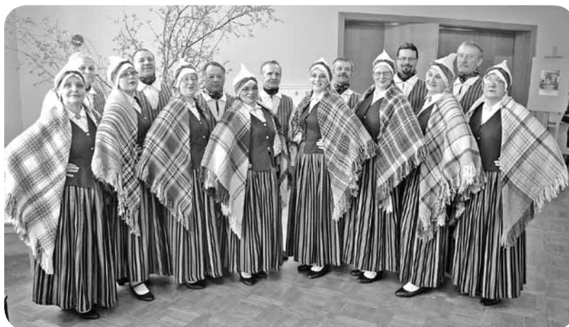
Senioru deju kolektīvs „Divi krasti”, ar Madonas novada rokdarbnieču austajiem lakatiem, kas tapuši speciāli dejas specifikai.

Uģis Prauliņš - latviešu komponists un mūziķis.