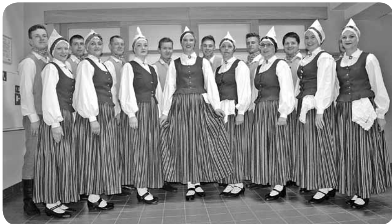
Vidējās paaudzes deju kolektīvs – dejotāji gandarīti par pirmo lielo uzstāšanos.

Varbūt kāds ļaudonietis vēl prāto, vai iesaistīties kādā pašdarbības kolektīvā, tad - uz priekšu! Gan dziedātāju, gan dejotāju nevar būt par daudz, un mēģinājumi allaž vainagojas ar skaistiem priekšnesumiem, kas priecē gans sevi, gan citus!