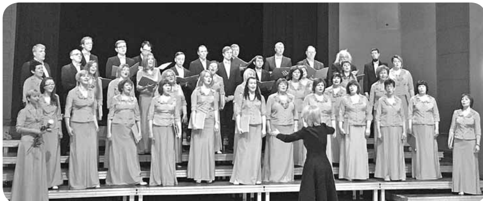
Jauktais koris „Lai top” Madonas kora apriņķa skatē izpildīja trīs dziesmas.