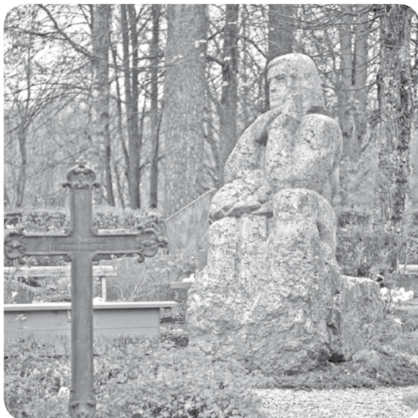
Skulptūra „Jauneklis” pie A. Eglīša kapavietas.

„Jauneklis III” - skulptūrai dots trešais kārtas numurs, jo tā ir kā turpinājums autora esošajai varoņjaunekļu sērijai. Divas iepriekšējās skulptūras atrodas Turaidas Dainu kalnā, trešais - jauneklis - pie Andreja Eglīša kapavietas. Interesants ir skulptūras ceļš līdz Ļaudonai.