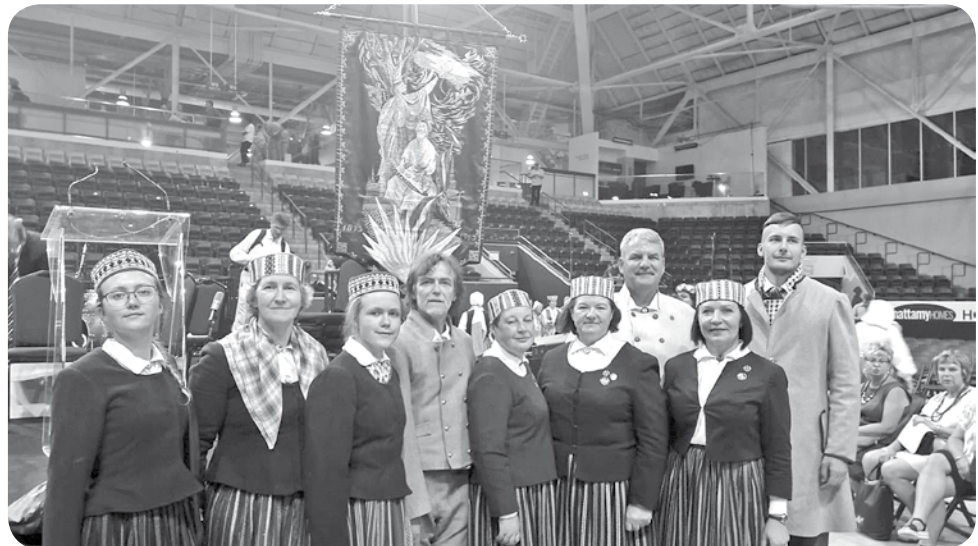
Kora grupa pie Dziesmusvētku karoga pēc kopkora koncerta.