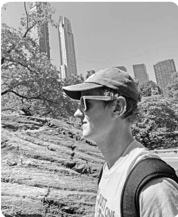
Ar zīmola „Ļaudona” saulesbrillēm tika izpētīta Ņujorka.

-Apmācības ir obligātas. Nepiedaloties tajās, nav iespējams tikt tālāk uz ASV. Šajās apmācībās pirmajā dienas daļa jāklaušās prezentācijas, kurās cilvēki, kas tirgojuši grāmatas jau vairākus gadus, dalās par tehniskām lietām un niansēm. Lielākā daļa no prezentētājiem ir miljonāri, kas liek saprast, ka darbs, kas tiks paveikts, nesīs labus