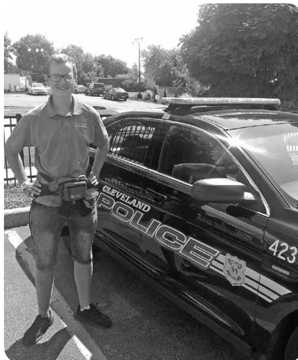
Reinis par šo foto saka: „Nācās aprunāties ar Klīvlendas policistiem. Nekas nopietns - tikai draudzīga saruna.”

Apbrīnoju sakārtotos lielceļus, kuru nav Latvijā. Piemēram, vasaras beigās, braucot no Ņujorkas uz Nešvilu,