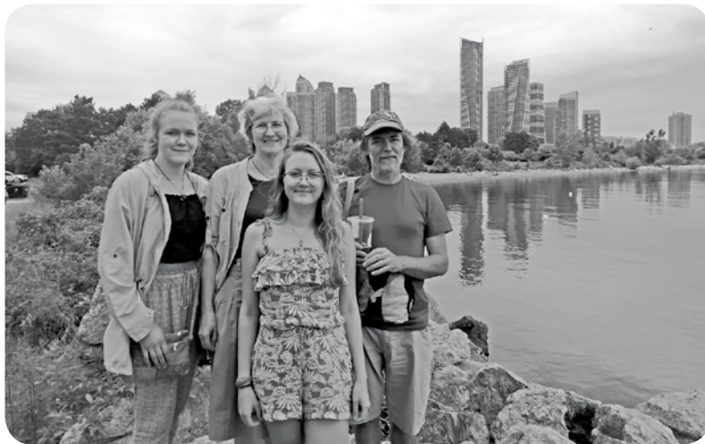
Karlonu ģimenes kora dziedātāji ar Toronto debesskrāpjiem fonā.