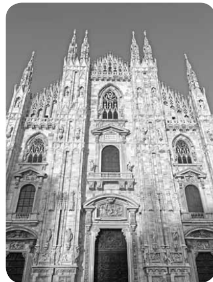
Doms Milānā, Itālijā.

- Jā, mani aizrauj ceļošana. Es gribētu doties uz Skandināviju, jo nu Centrāleiropa daļēji ir apceļota. Gribētu uz Lielbritāniju, īpaši - Īriju un Skotiju. Mani ļoti saista šo valstu iedzīvotāju nacionalitāte, arhitektūra, tas senatnīgums, kas tur saglabājies.