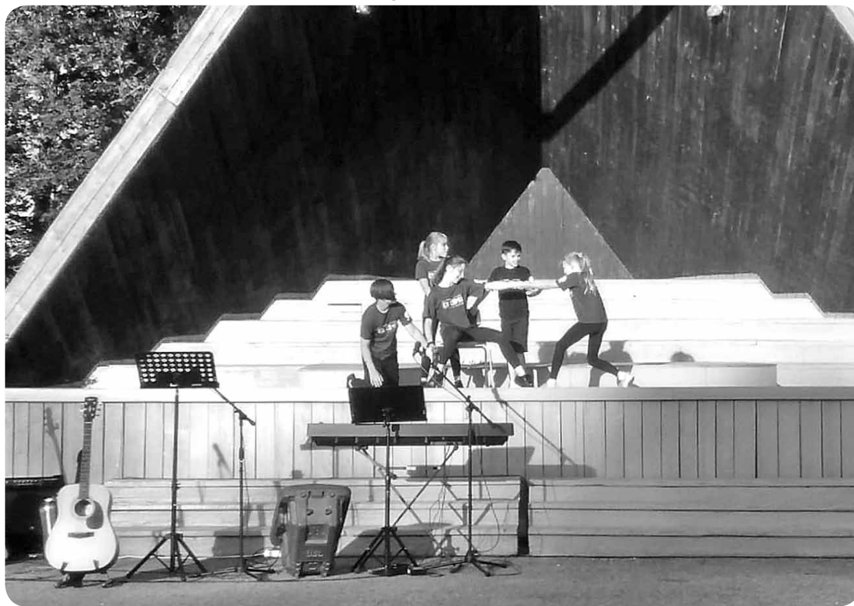
Ļaudonas estrādē vakara pasākuma laikā, rādot atnākušajiem ļaudoniešiem sagatavotos priekšnesumus.

14. augusta vakarā ar diviem maziem autobusiem Ļaudonā ieradās bērni no Valdemārpils. Pirms tam nedēļas garumā apmācību centrā "Jaunatne ar misiju" bērni mācījās dejas un dziesmas, kas priecēja arī ļaudoniešus, kuri apmeklēja vakara pasākumu Ļaudonas estrādē 15. augustā. Bērni iepazīna arī kristīgās vērtības un to, ka Dievs mīl katru cilvēku, katrs ir vērtīgs, unikāls, talantīgs, skaists, īpašs! Tā ir galvenā vēsts, ko bērni vēlējas nodot katram satiktajam cilvēkam Ļaudonā.