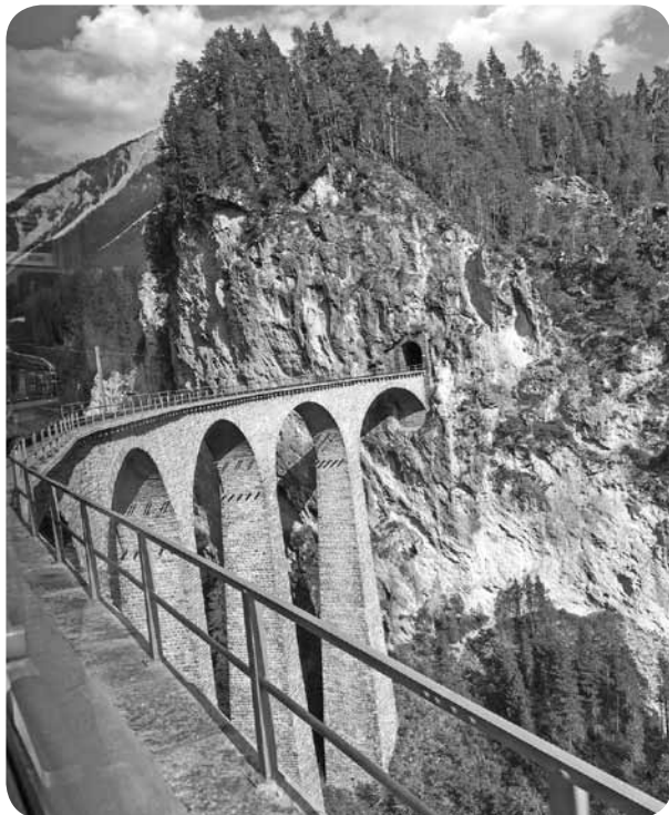
Skats, kas paveras, braucot ar Šveices skatu vilcienu.

Esot Berlīnē, ar Aigu bēgām no cilvēkiem. Noīrējām divriteņus un braucām uz desmit kilometrus tālo botānisko dārzu, kur atradāmies tuvāk dabai. Māca liels nogurums pēc sešām pavadītām dienām starp cilvēku sejām, troksni.