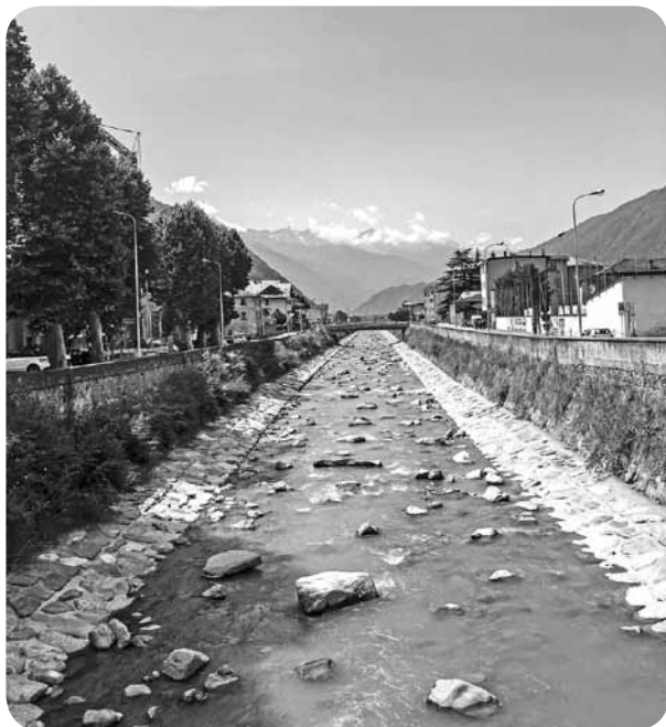
Tirano pilsētiņā Itālijā.