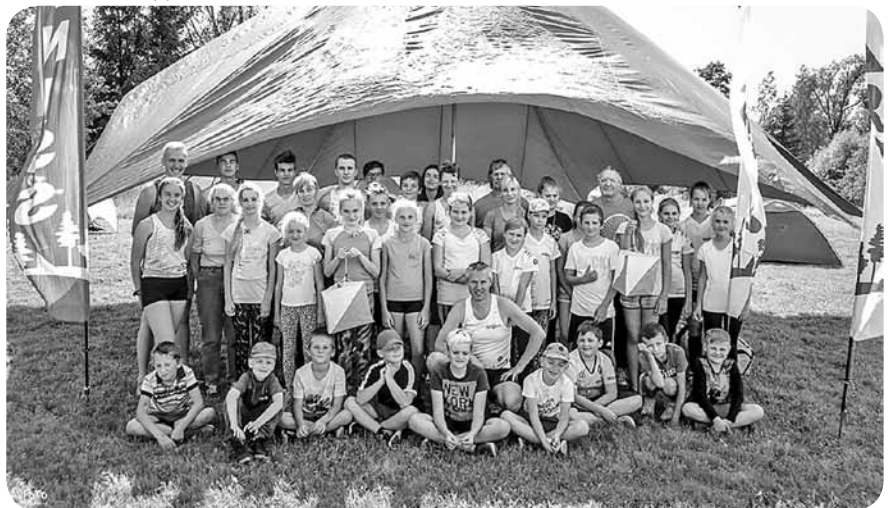
„Orientēšanās ABC” dalībnieki un audzinātāji.

Orientēšanās klubs "Arona" laika posmā no 12. līdz 16. augustam Ļaudonā, Andreja Eglīša Ļaudonas vidusskolā, organizēja diennakts āra nometni, kas bija paredzēta 20 dalībniekiem vecumā no astoņiem līdz pat astoņpadsmit gadiem, kuri iepazīst orientēšanās sportu un kuri jau aktīvi sporto.