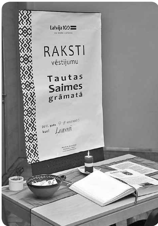
Saimes grāmata goda vietā, aicinot ikvienu veikt tajā ierakstu.

Biedrība „Rasa” ir izveidojusi īpašu Latvijas Tautas Saimes grāmatu, tā aktivizējot senioru sabiedrību un katru līdzpilvēku Latvijā un ārvalstīs, uzrakstot vēstījumu, vēlējumu, novēlējumu, pārdomas, apsveikumus, attīstības ideju Latvijas valstij jubilejā. Par cerībām, sapņiem, valsts nākotnē skatoties un atzīstoties mīlestībā Latvijai. Ar domu par Latviju un Latvijas cilvēkiem tapa Latvijas Valsts simtgadei veltītā iniciatīva - rakstīsim savas Tautas Saimes grāmatu.