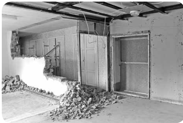
Veicot sienas demontāžas darbus, atkal varēja ieraudzīt zaļas durvis, kas savulaik kalpojušas kā otra izeja/ieeja pasākuma apmeklētājiem.