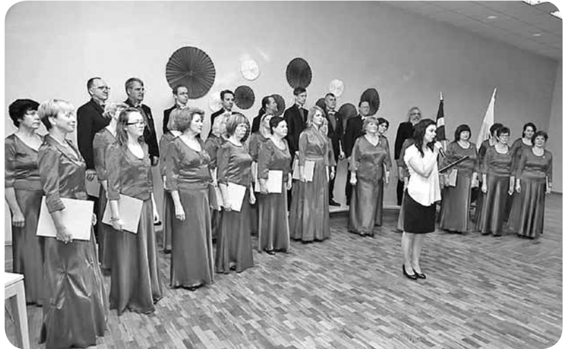
Svētku koncertā uzstājās Ļaudonas jauktais koris „Lai top!”.