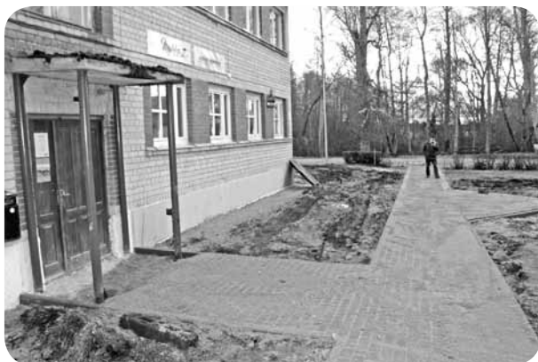
Nedaudz izmainot plānojumu, tiek izveidoti jauni gājēju celiņi un smēķētāju zona.

Kā jau ļaudonieši to novērojuši, kopš oktobra notiek aktīva rošība pie Ļaudonas kultūras nama. Būvdarbi tiek īstenoti projekta „Ļaudonas pagasta kultūras nama atjaunošana” ietvaros. Pasūtītājs: Madonas novada pašvaldība, būvdarbu veicējs: SIA „Trast Būve”. Ēkai, kurai līdz šim nav tikuši veikti nekādi uzlabojumi, šie būs lieli darbi. Šobrīd, kamēr laikapstākļi atļauj, notiek āra darbi - ir uzlikts jumts, paralēli notiek arī iekšdarbi.