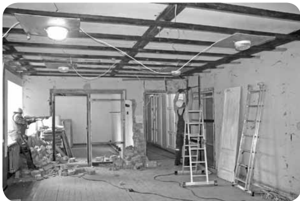
Kultūras nama ēkas iekštelpas piedzīvos acīmredzamas izmaiņas, domājot par apmeklētāju ērtībām un estētisko baudījumu.