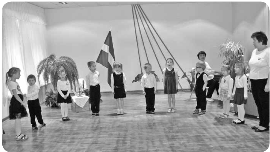
“Kaķu” grupas bērni valsts svētku koncertā.

Novembra mēnesis mums visiem saistās arī ar sarkanbaltsarkanām svecēm, karogu un Latvijas dzimšanas dienu. Šos svētkus PII “Brīnumdārzs” svinēja 17. novembrī. Visi bērni zina, ka dzimšanas diena katram ir īpaša diena, kurai ikviens rūpīgi gatavojas. Arī Latvijas dzimšanas dienas svinībām bērni kopā ar skolotājām centīgi gatavojās. Skolotājas skaidroja bērniem valsts